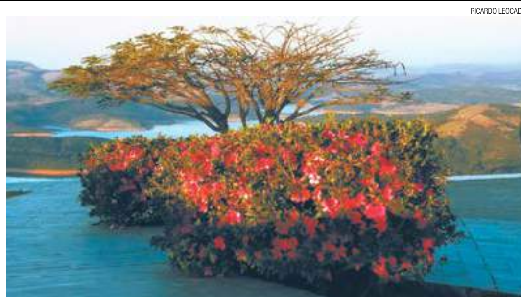
Flores - Vista do mirante, no alto de um morro na cidade de Caconde, divisa entre Minas Gerais e São Paulo