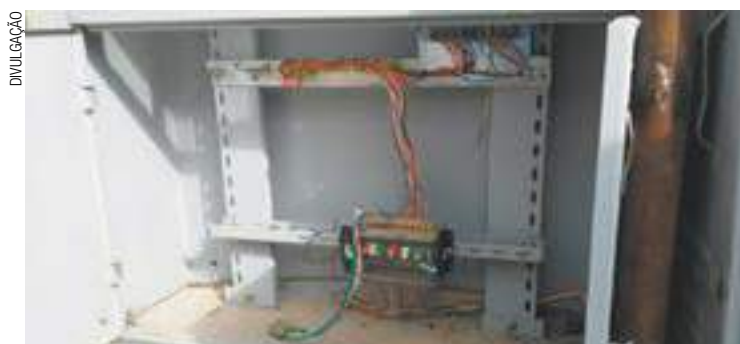
Ousadia - Além do furto de equipamentos, também houve vandalismo

O Boletim de Ocorrência foi registrado no 7º DP (São João). Após o primeiro furto, em maio, a empresa aumen-