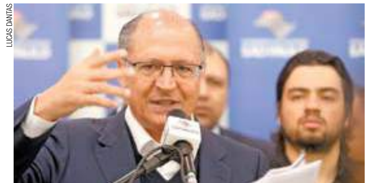
Discurso - Em Guarulhos, Alckmin tenta se descolar do governo federal

Ainda em tom crítico, o tucano afirmou que o governo de Michel Temer gasta mais do que arrecada e que os brasileiros não têm “noção” da gravidade da situação financeira do País, com gasto de R$ 159 bilhões a mais do que a arrecadação. “Essa é a herança que o Brasil recebe de um populismo fiscal irresponsável, mas a nossa tarefa, é todo dia, reduzir gastos”, disse.