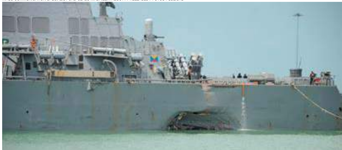
"Barbeiragem" - Dez marinheiros estão desaparecidos; este é o segundo acidente na região em 60 dias