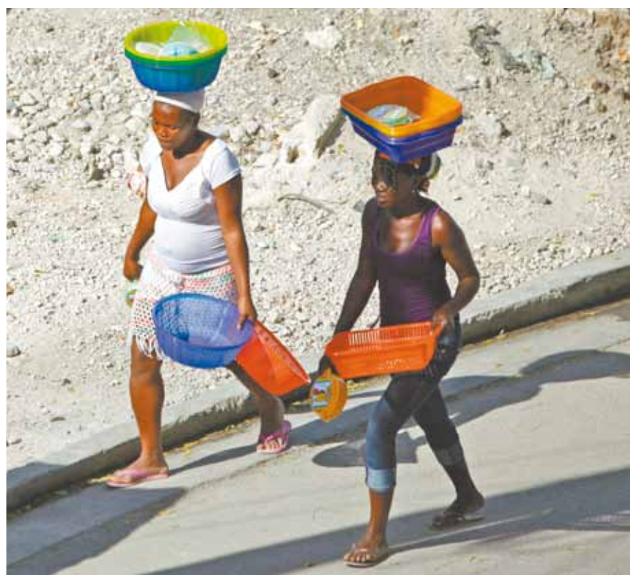
Extremamente difícil encontrar mulheres haitianas que não estejam trabalhando