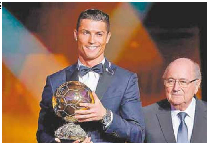
Consagração - Cristiano Ronaldo venceu Lionel Messi e Manuel Neuer

O português sobrou na votação promovida pela Fifa este ano. Recebeu 37,66% dos votos, contra 15,76% de Messi e 15,72% de Manuel Neuer, goleiro alemão do Bayern de Munique que era