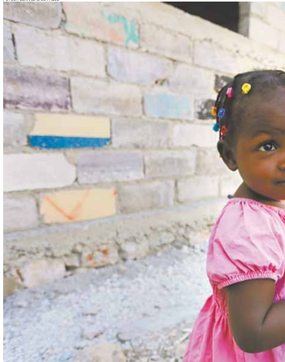
A esperança no olhar, na preocupação com o colorido e na muda de planta nas mãos da g