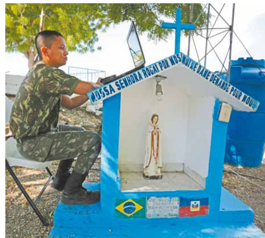
Soldado busca sinal de internet para matar a saudade da família no Brasil