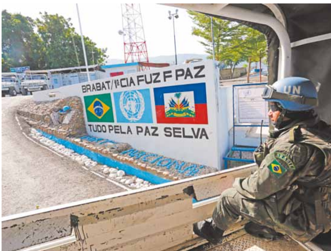
Forte Nacional foi um dos pontos mais atingidos em 2010. Vítimas foram enterrados nas proximidades