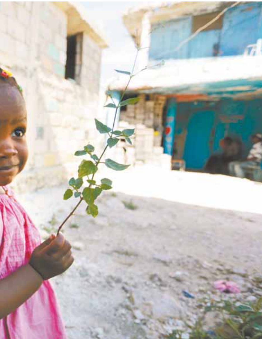
Garotinha haitiana: o que reserva o futuro?