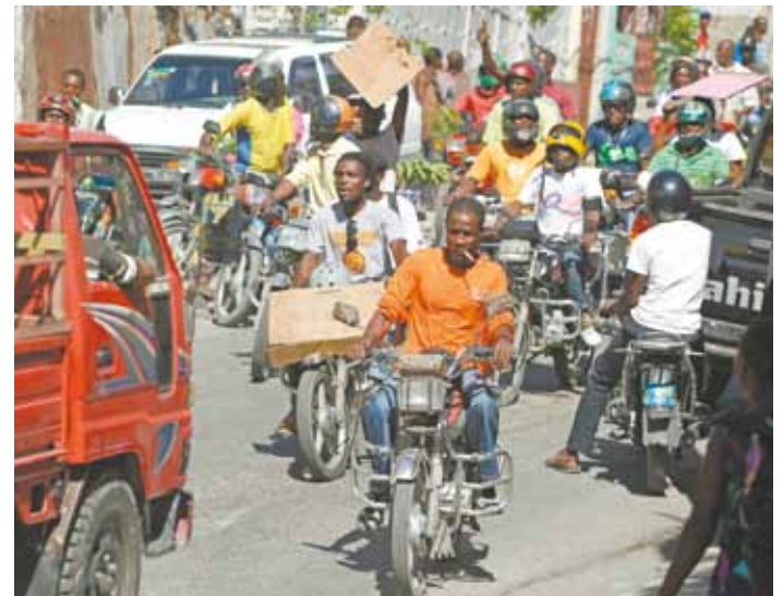
Susto! Manifestação contra o governo nos pegou de surpresa

Apenas 10% das casas no Haiti têm energia elétrica