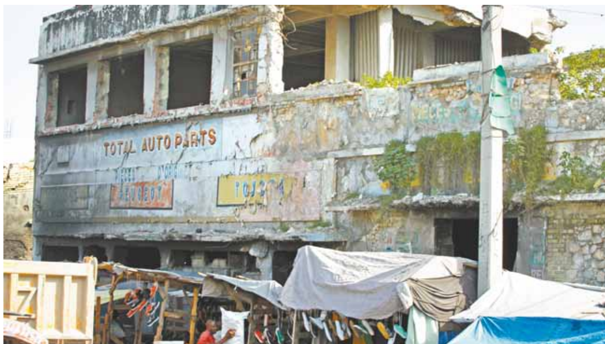
Prédios avariados e condenados pelo terremoto permanecem vazios, como uma cidade fantasma; pouco foi refeito desde 2010

Passamos pela área portuária de Porto Príncipe, onde se encontra o Mercado Venezuela, mais conhecido como "A Cozinha do Inferno". Uma feira gigantesca, sem a menor condição de higiene, onde é comercializado de tudo. De frutas a cascas de laranja. De ervas a biscoitos de barro. Cheiro forte de alimentos estragados. Um mar de gente se amontoa e transita pelas vielas estreitas e escuras. O apelido é merecido.