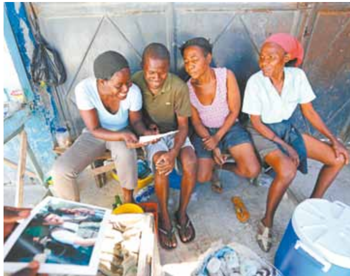
Na 'saga' para encontrar a garota, a foto passou por muita gente