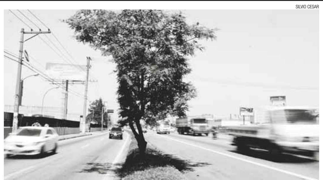
Um pouco de verde - Árvore resiste à paisagem cinzenta e ao vai e vem frenético dos carros na Via Dutra