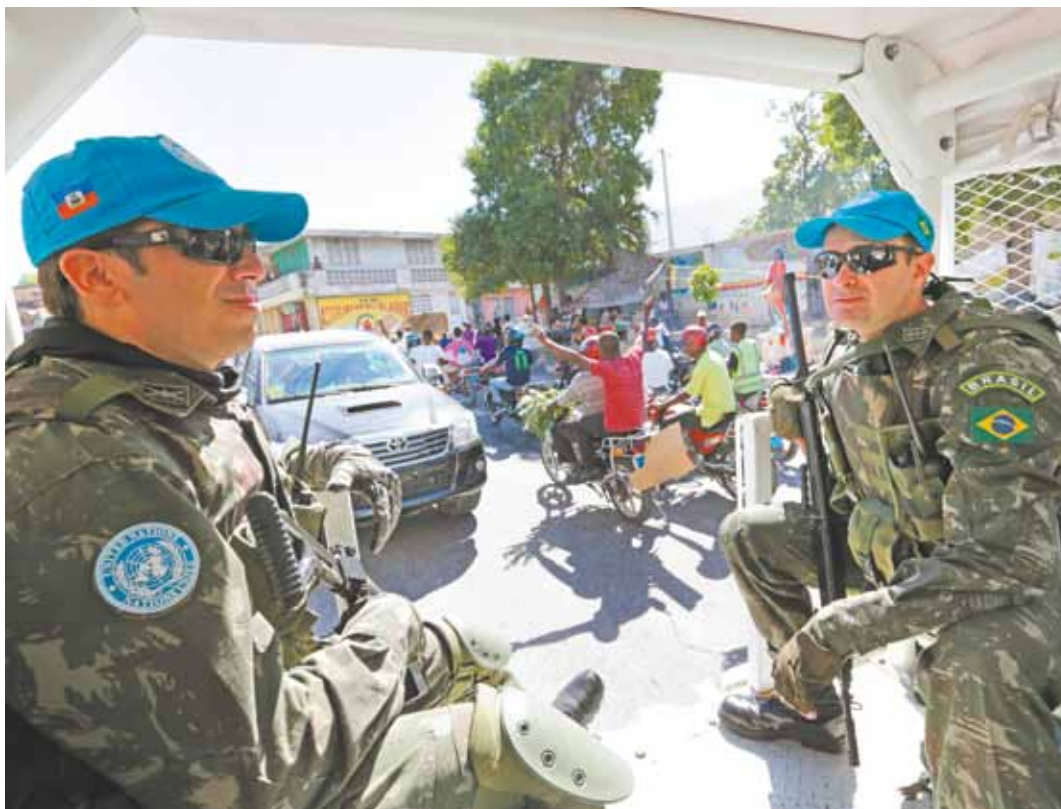
Patrulhas armadas são diárias para manter o que os militares chamam de “ambiente seguro e estável”

É em frente à antiga sede do Poder Executivo, inclusive, que ocorrem as constantes manifestações da oposição ao presidente Michel Martelly. Lugar que transpira história!