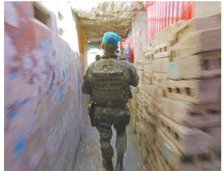
Incursoão por vielas estreitas de favela em Bel Air para achar a garota