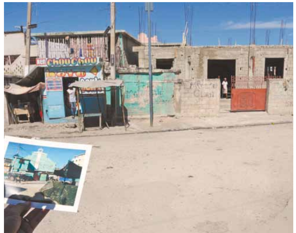
Parede verde foi o que restou do antigo templo (no detalhe, à esquerda, foto tirada em 2005)

A moeda oficial é o gourde (US$ 1 equivale a 45 gourdes, aproximadamente)