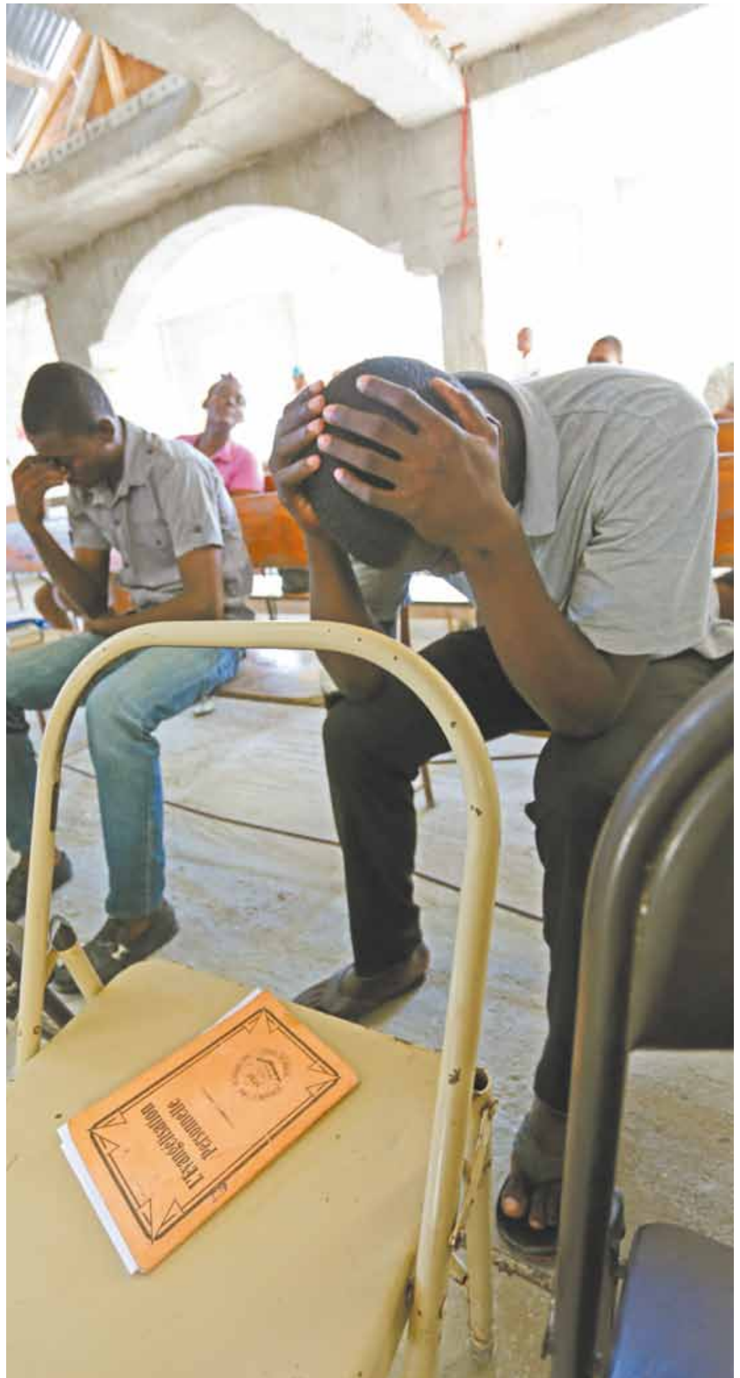
Evangélicos são minoria em um país majoritariamente cristão, mas que não abandona o sincretismo religioso