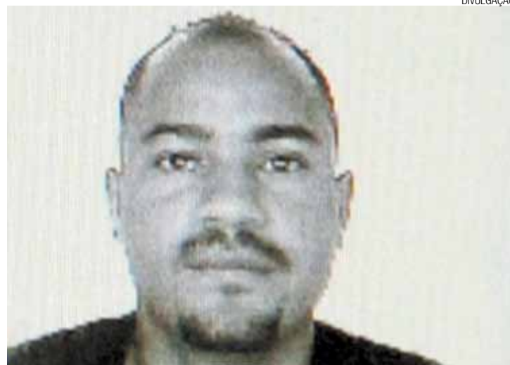
Disciplina - Lima ocupa o terceiro cargo na hierarquia do crime