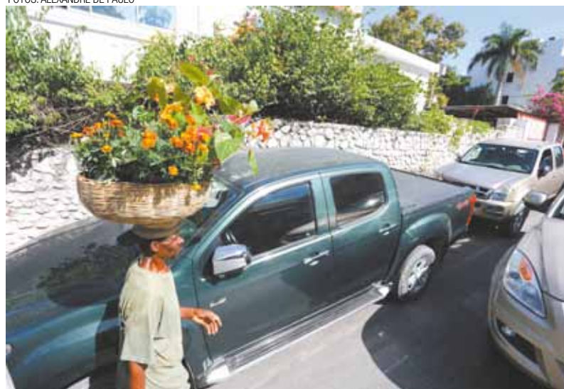
Bairro exibe mansões, carros de luxo e raro verde: face triste dos contrastes

Mais tarde, voltamos ao bairro. Jantamos em um restaurante localizado na mesma praça visitada pela manhã. No Quartier Latin, a impressão era a de estarmos em Paris: idioma francês, música ao vivo de qualidade, atendimento e comida de primeira. Impossível não se lembrar dos biscoitos de barro e da água insalubre consumida a poucos metros dali.