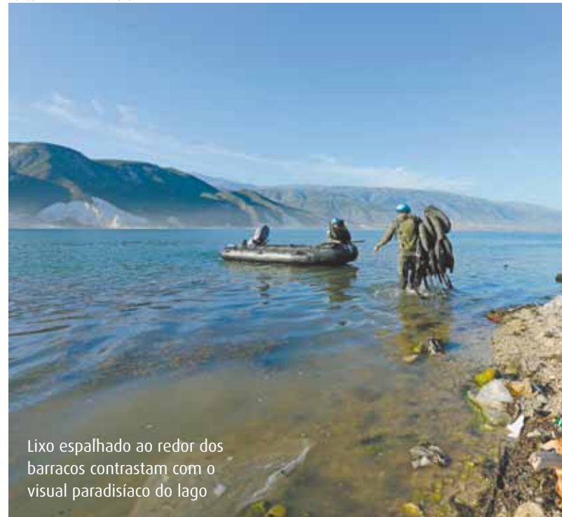
Lixo espalhado ao redor dos barracos contrastam com o visual paradisíaco do lago