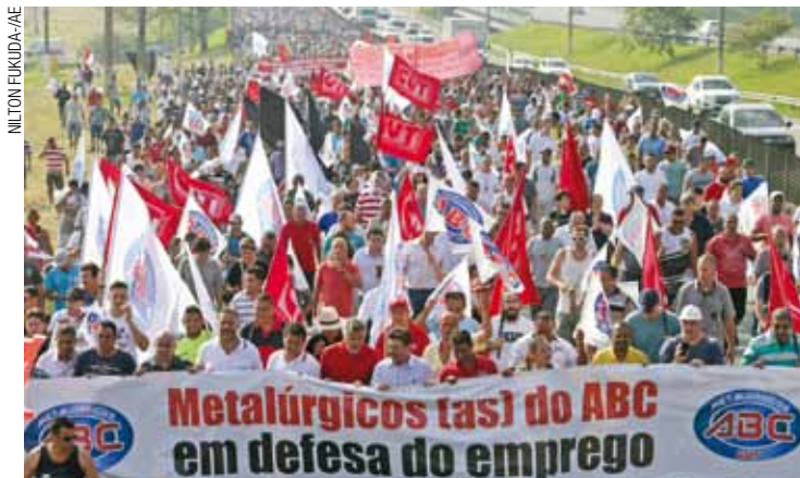
Protesto - Metalúrgicos fizeram passeata na Via Anchieta na segunda

De acordo com a assessoria da Volkswagen, a proposta previa o “aditamento” do acordo atual, revendo as “condições estabelecidas e propondo