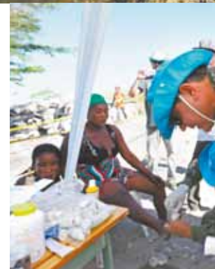
Mulher demonstra sentir dor ao ser atendida por médicos brasileiros: pés judiados