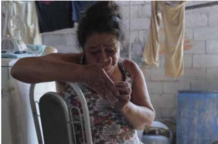
Ameaça antiga - Dona de terreno onde estava a árvore proibiu o corte