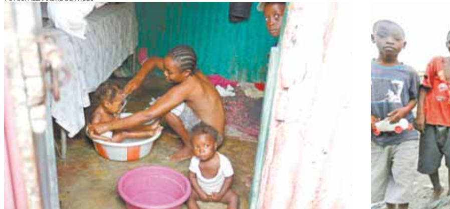
Mãe banha filha em barraco de zinco na favela de Ti Haiti