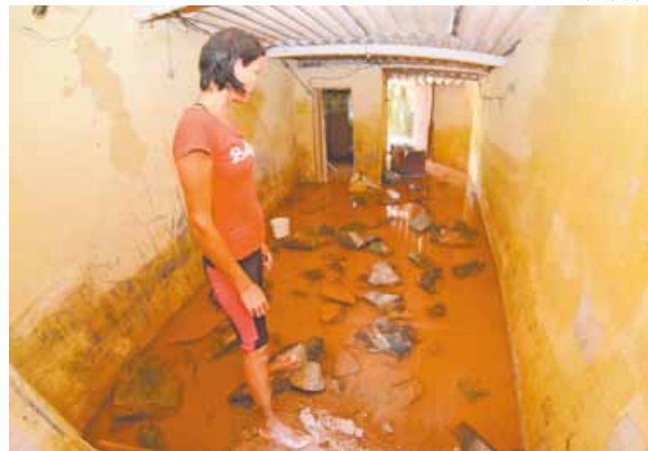
Desespero - Moradores aguardam providências do governo e empresa

Já a Construcap afirmou que não houve deslizamento na obra do Rodoanel e que o alagamento das casas é recorrente aos períodos chuvosos,