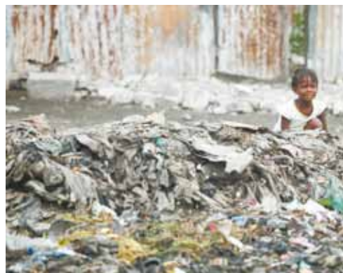
As pessoas parecem acostumadas com o lixo; não têm opção e sobrevivem aos perigos