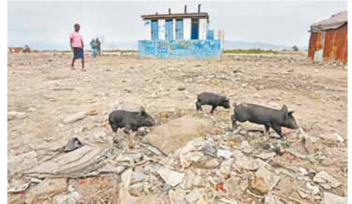
Porcos e cabras são comuns em meio ao lixo e entre as várias crianças