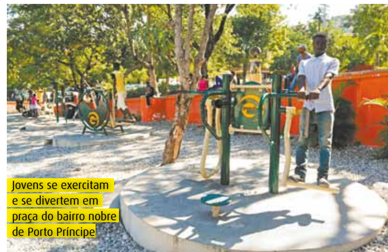
Jovens se exercitam e se divertem em praça do bairro nobre de Porto Príncipe

Amanhã, no último capítulo da série “Haiti - O passado presente”, o impasse da ONU com o futuro da Minustah, o trabalho dos militares e as histórias de quem sobreviveu ao terremoto.