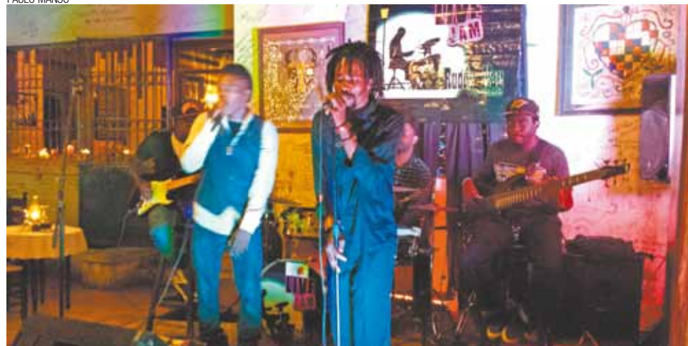
Boa música caribenha em restaurante chique de Pétienville