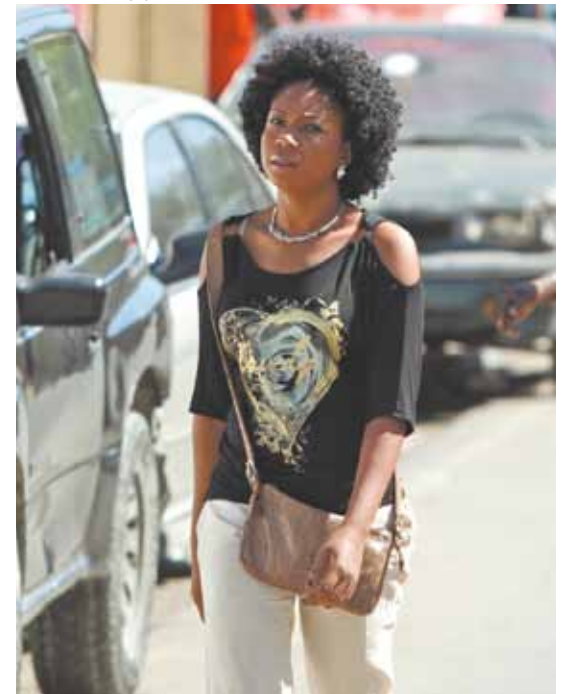
Bem vestida, mulher caminha pelas ruas de Pétienville entre carrões e árvores: outra realidade