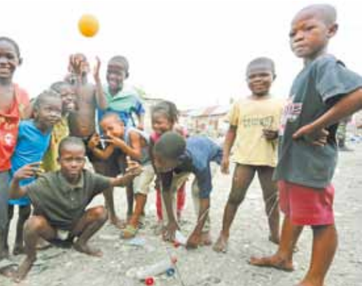
habilidade com a bola e se alegram com nossa presença