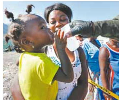
Garotinha recebe medicamento durante ação de cooperação civil-militar: novidade