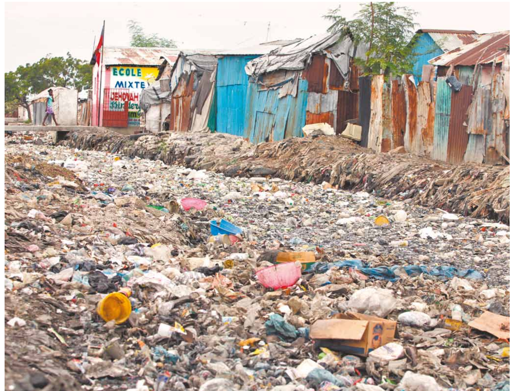
Canal que deveria escoar água para o mar está entupido de lixo. Quando chove, todo esse material pode invadir os barracos onde vivem centenas de pessoas. É o cotidiano em Cité Soleil