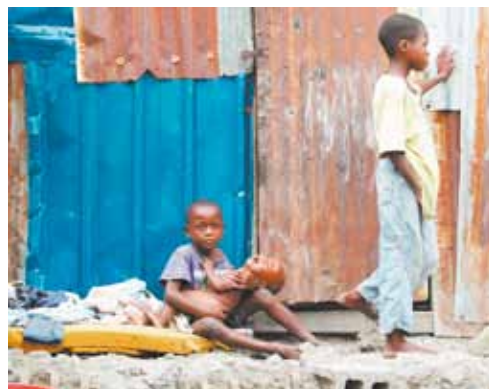
Cena comum após o terremoto: órfãos que se vêem obrigados a cuidar de irmãos menores