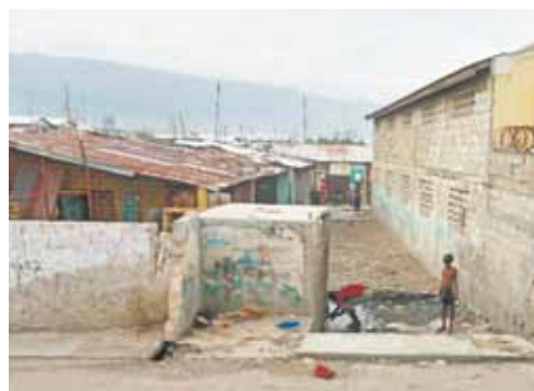
Pai busca água - suja - para tomar banho enquanto filho aguarda com uma bucha nas mãos