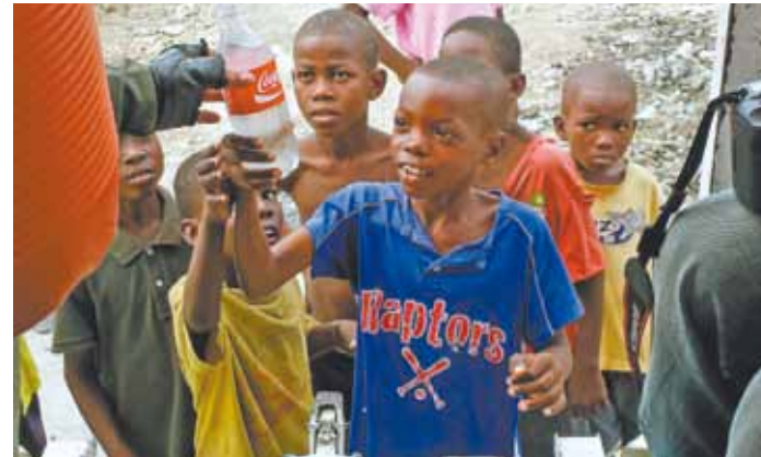
Água é aguardada com ansiedade por um grupo de meninos