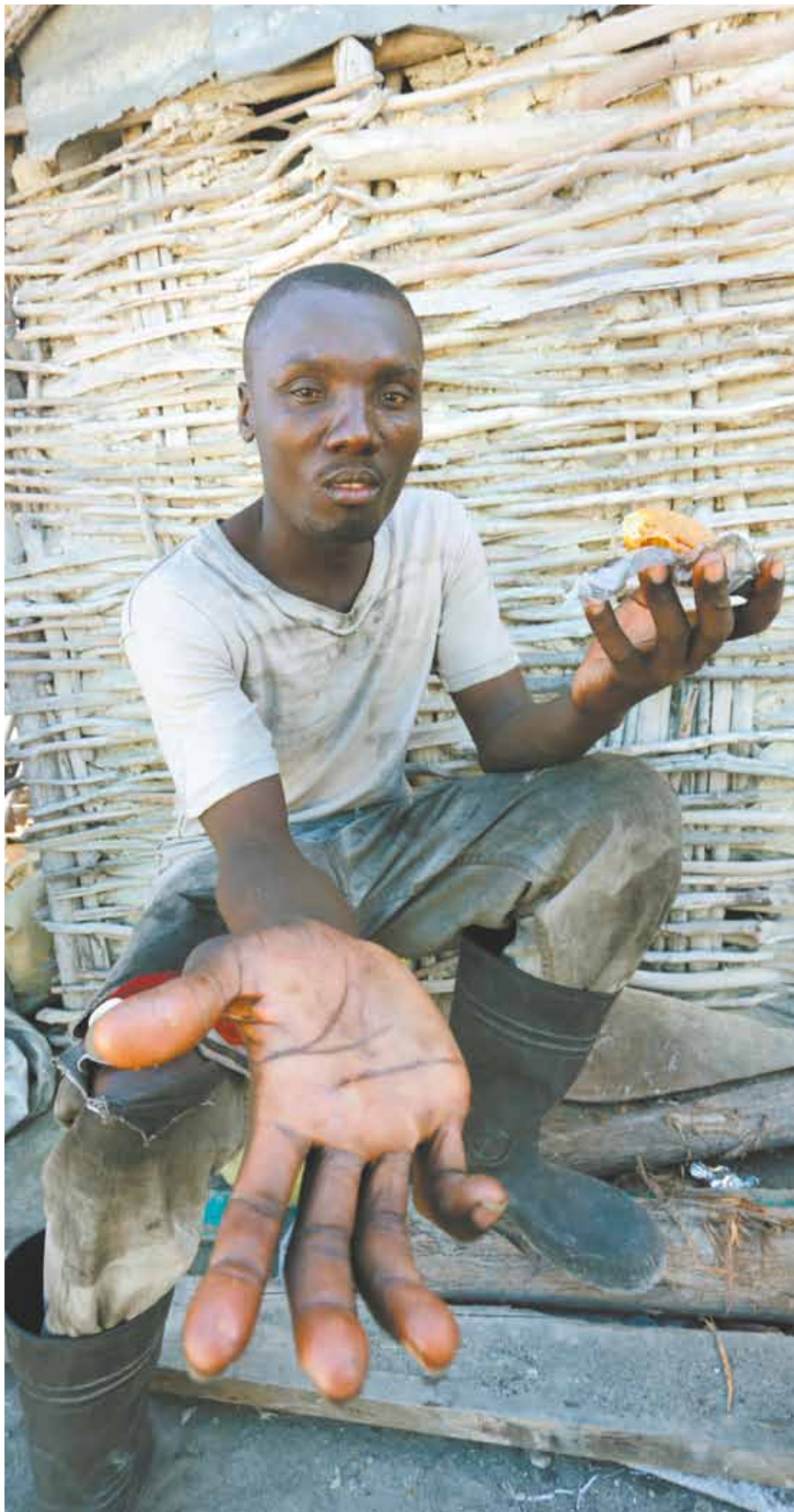
Homem sobrevive produzindo carvão na aldeia Port Glacé, na fronteira com a República Dominicana