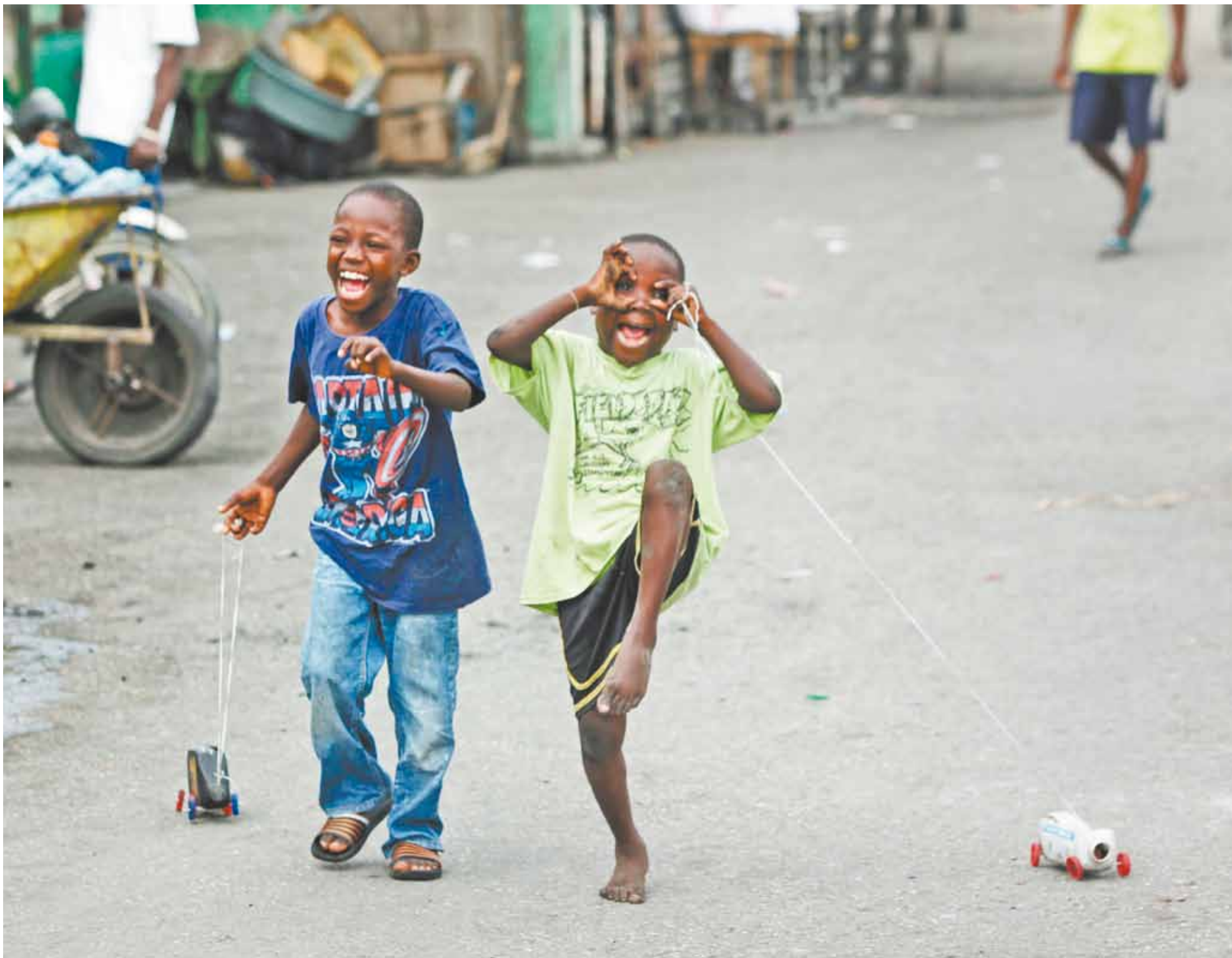
Garotos brincam com carrinhos feitos de garrafas de plástico: nem mesmo a dura realidade tira o sorriso do rosto dos haitianos, que insistem em manter acesa a chama da esperança