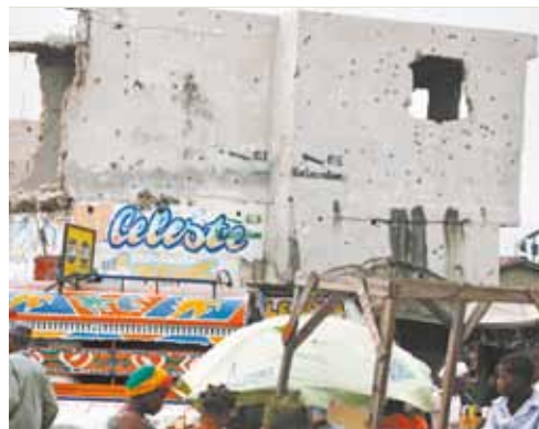
Marcas de tiros são comuns nas paredes das casas de Cité Soleil: violência permanece