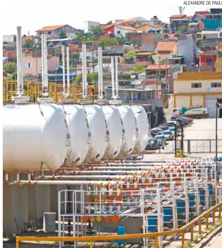
Servgás - Empresa alega que forte cheiro é por causa de manutenção

Moradores do bairro passam mal com o forte odor