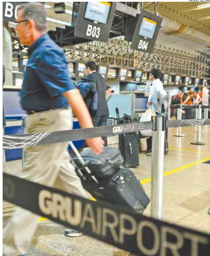
Férias - Aeroporto registra grande movimentação neste período

O Guia do Passageiro está disponível nos sites da GRU Airport, Anac, Infraero e da Secretaria de Aviação Civil da Presidência da República (SAC)