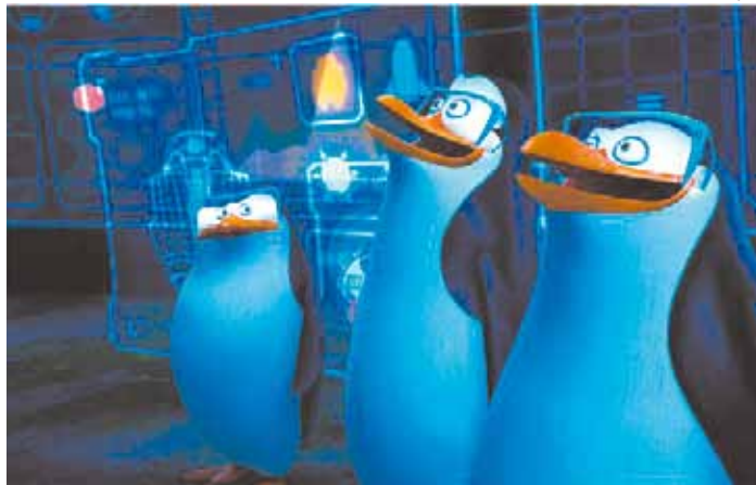
Protagonistas - Os pinguins serão os grandes astros do novo filme