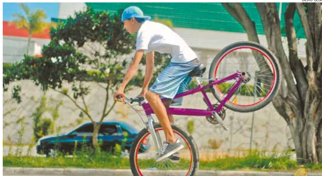
Diversão e habilidade - Jovem demonstra destreza e se diverte nas manobras realizadas com a bicicleta