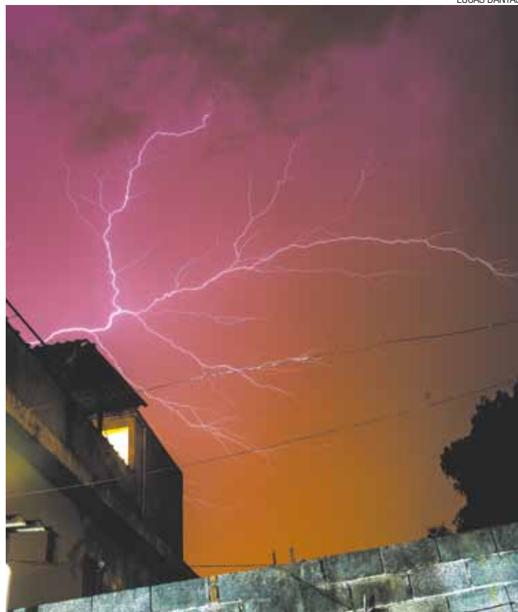
Perigo - Em risco de raio orientação é evitar locais abertos e árvores