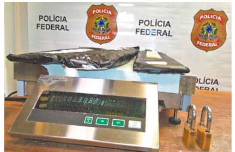
Pesagem - Droga estava escondida em bagagem de brasileiro