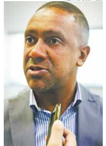
Meta - Presidente da Câmara tentará aprovar sua proposta

As únicas sessões fora da Câmara são as de posse dos prefeitos e vereadores, no primeiro dia de cada Legislatura.