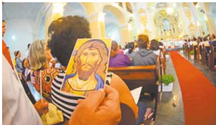
Missa - Influência do catolicismo é forte desde o descobrimento do País

Estudo indica que 86% das empresas ouvidas combatem o preconceito