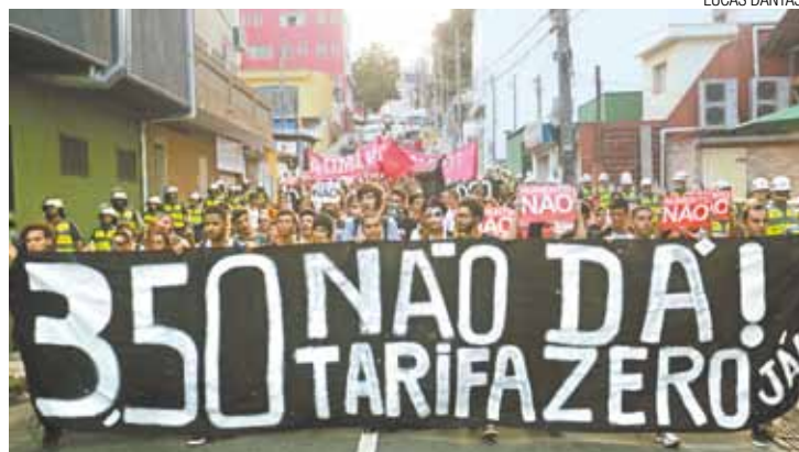
Futuro - Uma das principais questões é o passe livre para estudantes

Na mobilidade, uma das principais questões é o passe livre para estudantes que está