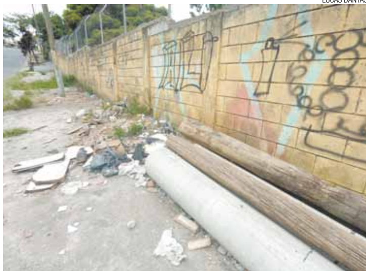
Descarte - Postes e entulhos largados no chão causam poluição visual

Um dos moradores da rua, Valdomiro Sampaio, está indignado com a situação. "A Bandeirante veio trocar os postes, não fez nada e ainda deixou os outros no chão. Os vizinhos também não colaboram, pois sujam toda a calçada", contou.