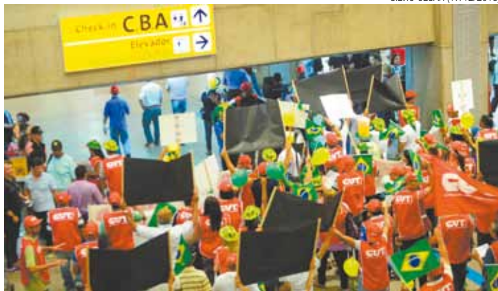
Luta - Trabalhadores, com apoio de sindicalistas, tentam fechar acordo