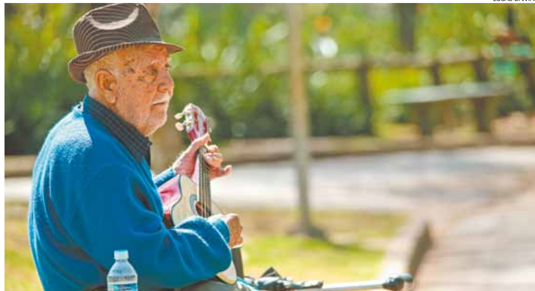
Companheiro - Um instrumento musical, seja qual for, é um bom aliado para qualquer momento e lugar