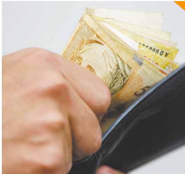
Planejamento - A ordem é ter cautela nos gastos e nos investimentos