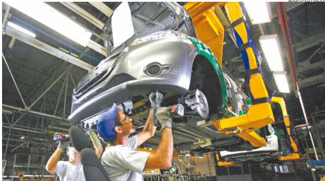
Crise - Indústria paulista teve 140 mil cortes em 2014; especialista aposta em retomada em 2016