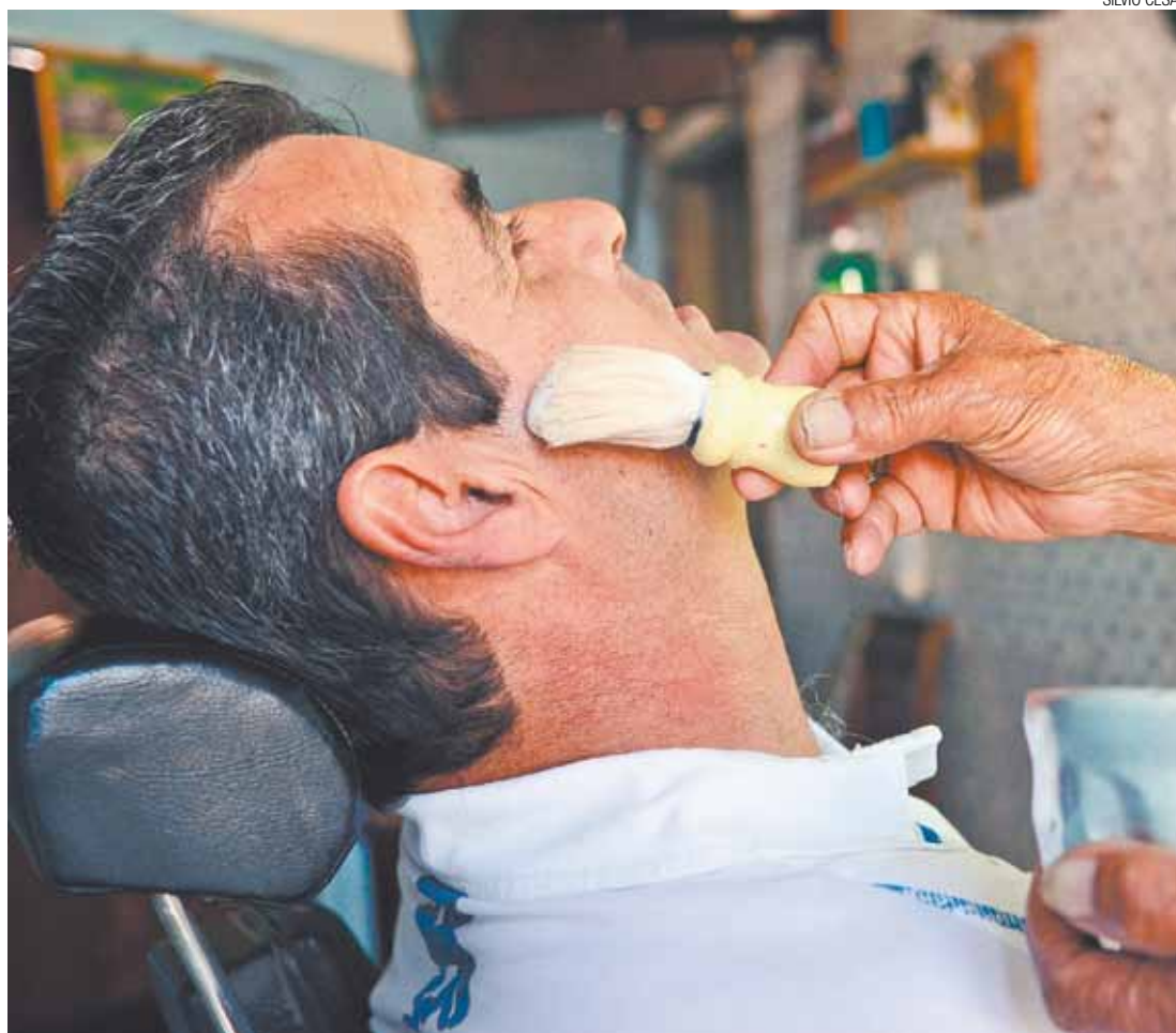
Em alta - Serviços tiveram desempenho satisfatório apesar da forte crise da indústria de transformação

Os aeronautas conseguiram que as empresas aceitassem criar comissão para discutir carga horária de pilotos e co-pilotos.