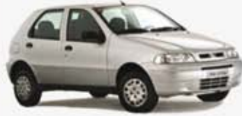
PALIO EX 1.0 4P 00/01 DDT5106 - VERDE - BÁSICO DE R$ 14.900, POR R$ 10.900,