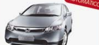
CIVIC EXS 06/07 DUD0043 - PRATA - COMPLETO DE R$ 39.000, POR R$ 36.000,