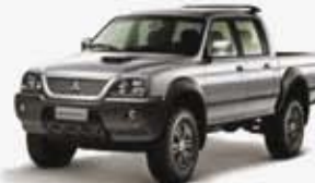
L200 GL CD 4X4 10/11 HLH5290 - PRATA - COMPLETO DE R$ 49.000, POR R$ 45.500,