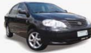
COROLLA XEI 06/06 DSC7590 - PRETO - COMPLETO DE R$ 29.800, POR R$ 25.900,