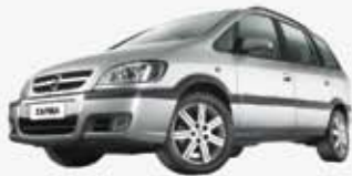
ZAFIRA ELEG. 2.0 08/09 EET8438 - CINZA - COMPLETO DE R$ 38.900, POR R$ 35.000,