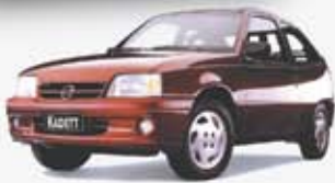
KADETT SL 1.8 93/94 BOI0787 - PRETO - BÁSICO DE R$ 10.000, POR R$ 7.890,