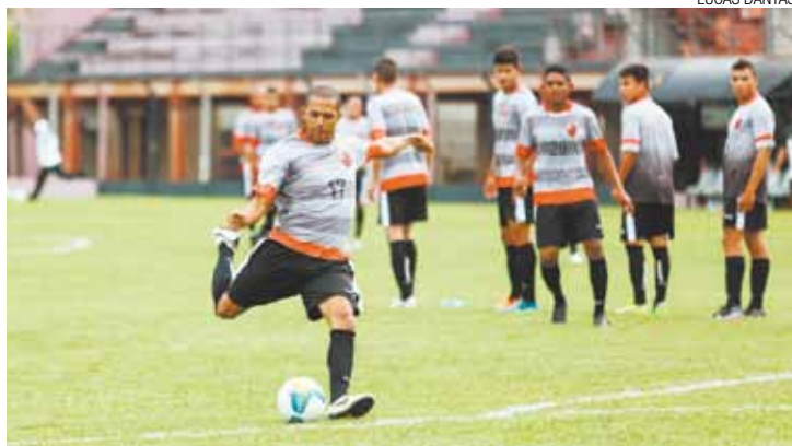
Treino - Jogadores treinaram finalizações a gol ontem, visando estreia

RÔMULO MAGALHÃES - O Flamengo de Guarulhos estreia na Série A3 do Campeonato Paulista amanhã e o treinador Caco Espinoza já esquentou a cabeça para escalar a equipe. Por "problemas com inscrições" para a primeira rodada, o Corvo não poderá contar com o goleiro Alonso, ex-Tigres (RJ), e os atacantes Billy, ex-Boa Esporte (MG), e Arlindo, atletas considerados titulares. O time joga contra o Santacruzense, às 16h, fora de casa.