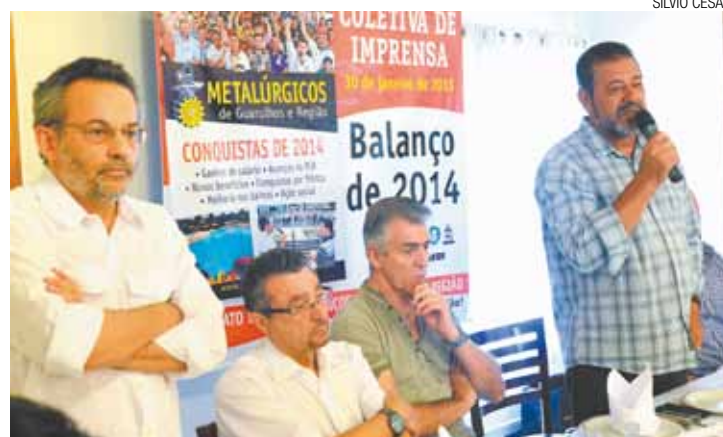
Balanco - Sindicato apresentou conquistas de 2014 em almoço