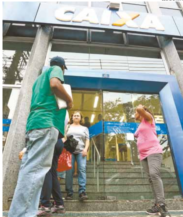
Ansiedade - Clientes esperavam ontem por uma reabertura imediata

GUARULHOS AV. DR. TIMÓTEO PENTEADO, 3042 ABERTO TODOS OS DIAS