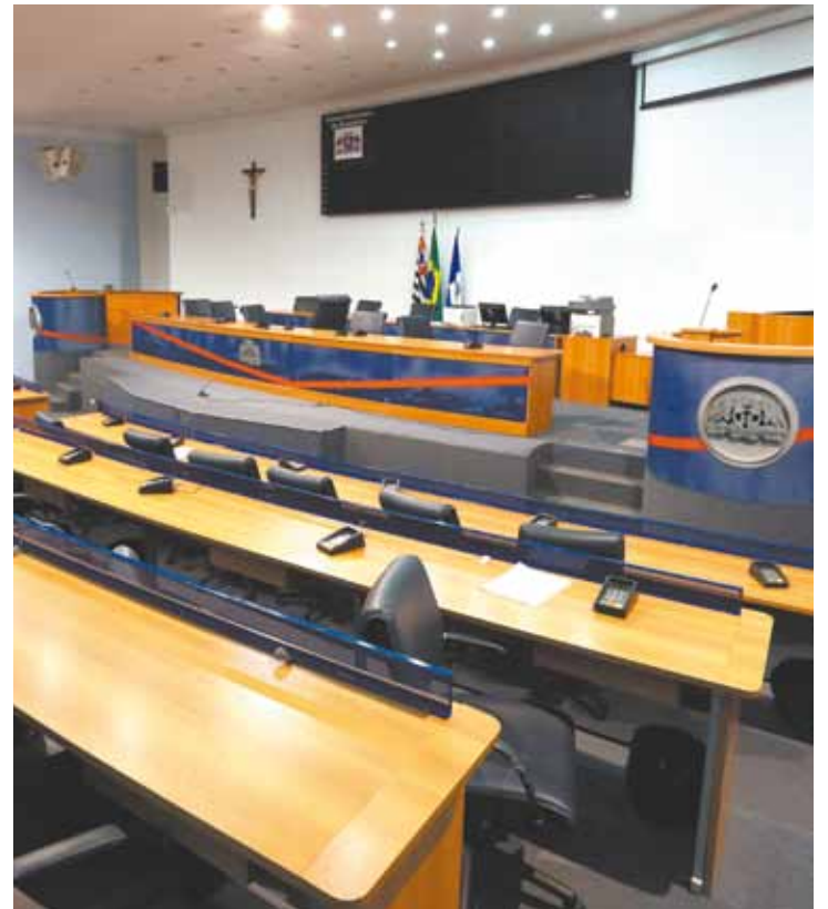
Silêncio - Nenhum cidadão guarulhense apresentou qualquer projeto

O cientista alerta que o objetivo não é só apresentar projetos, mas incluir debates e sugestões. "Ela [a comissão] é muito mais ampla. É um ambiente no qual as pessoas podem apresentar ideias que melhorem a sociedade. Se o vereador sabe que uma ideia tem vício de iniciativa ele pode indicá-la para que o prefeito a faça."