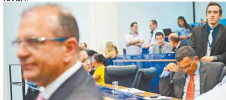
Disputa - Americano (à esq.) e Vasconcelos disputam espaço entre taxistas