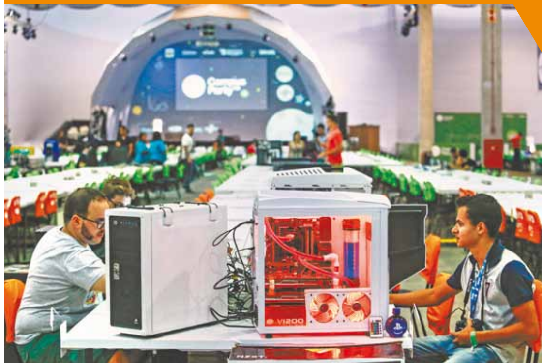
Nerds - Oitava edição da Campus Party foi aberta ontem na Capital; serão 700 horas de atividades

Com previsão de 100 mil 'campuseiros', começa a festa da tecnologia em SP Pág. 8