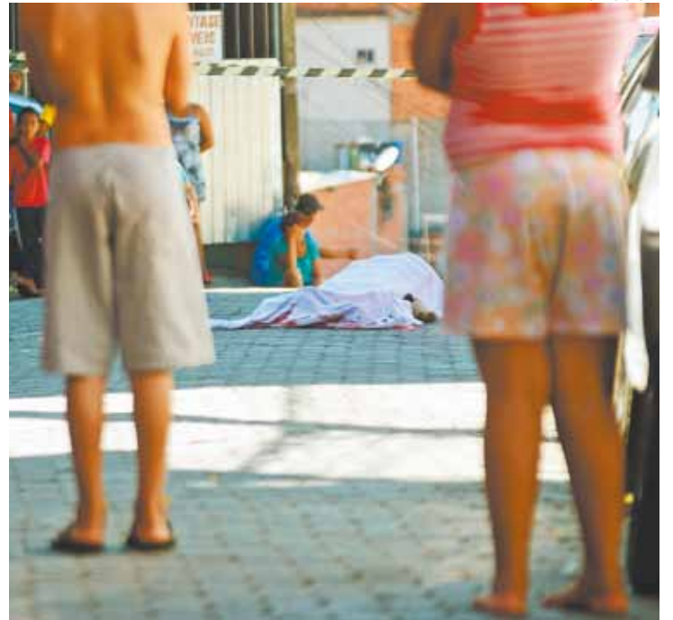
Violência - Nenhum suspeito pelos crimes ainda foi identificado pela polícia

Até a conclusão desta edição o homem não havia sido identificado. Nenhuma câmera de vigilância foi encontrada nas proximidades das cenas de ambos os crimes.