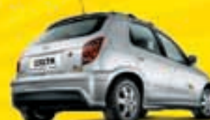
CELTA 1.0 2008 DYG5637 - PRETO - TT