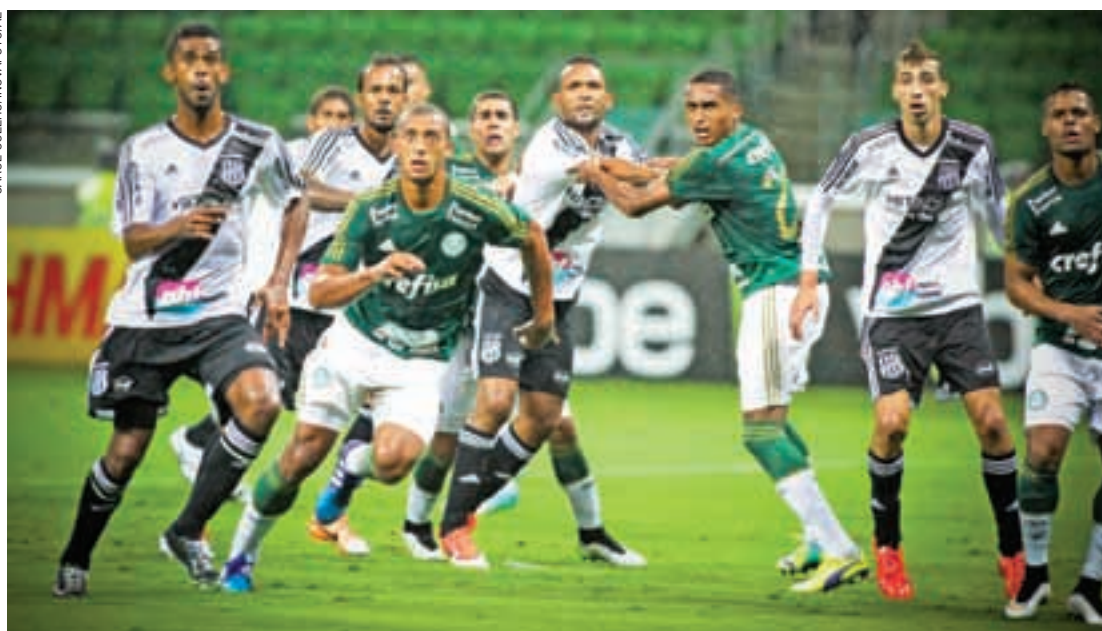
Embolado - Jogadores do Palmeiras e da Ponte Preta se engalfinham na área; "Macaca" levou a melhor