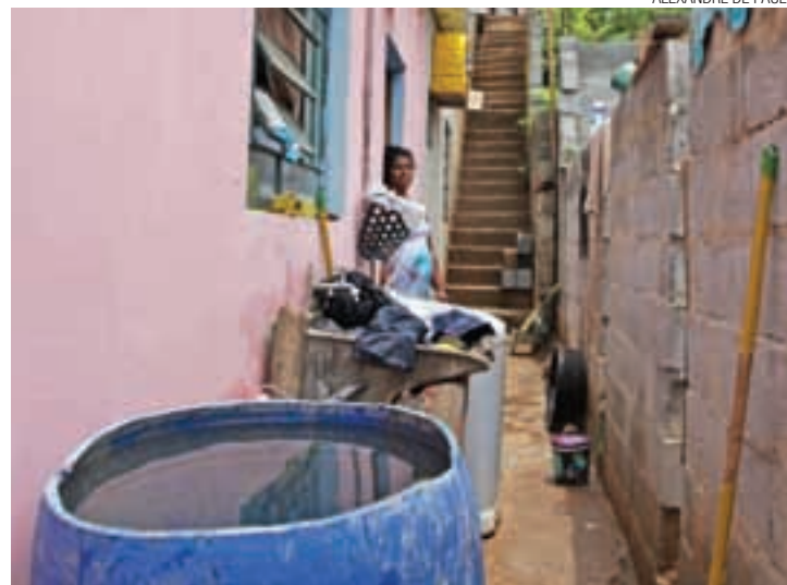
Risco - Armazenamento inadequado de água torna-se foco de proliferação

Na última quarta-feira (4) houve um mutirão no Portelinha. "Cerca de 30 agentes de Saúde entraram de casa em casa para retirar criadouros do mosquito e orientar a população sobre a importância de se eliminar todo recipien-