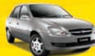
CLASSIC 1.0 2010 ELF3909 - PRETO - TT