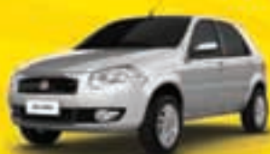
PALIO FIRE 1.0 4P 2012 EZD8764 - PRATA - LT/TE/VE/TT