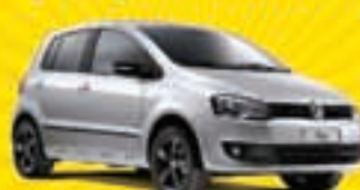
FOX 1.6 GII 2012 EUR4060 - PRATA - DH/LT/TE/VE/TT