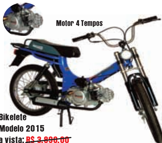
Motor 4 Tempos

VENHA APROVEITAR NOSSA OFERTA DE CARNAVAL!