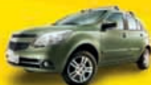
AGILE LTZ 2010 EMP4338 - VERDE - COMPLETO DE R$25.900