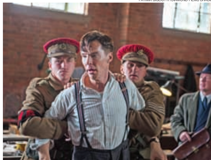
Enigma - Benedict Cumberbatch em cena de “O Jogo da Imitação”