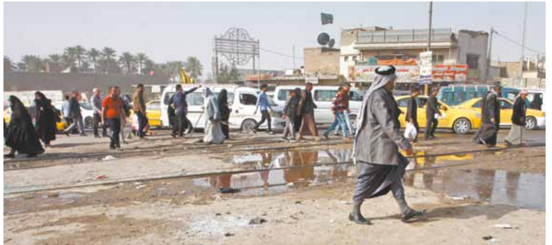
Puro terror - Governo iraquiano suspendeu o toque de recolher na capital Bagdá; explosões seguidas mataram 22

O governo iraquiano tem lutado para impor segurança desde a retirada das forças militares americanas em 2011. Em meados do ano passado, o grupo Estado Islâmico, que assumiu diversos ataques em Bagdá e arredores, assumiu o controle de um terço do país, tomando a segunda maior cidade, Mosul. Uma coalizão liderada pelos EUA vem fazendo ataques contra o grupo desde agosto de 2014.