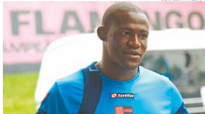
Retorno - Riascos deve fazer seu primeiro jogo contra o Rio Preto, em casa

Jogador assinou contrato até o fim da Série A3 do Paulista