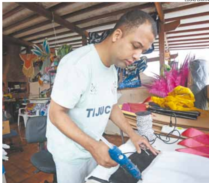
Trabalho - Na reta final para os desfiles, barracões funcionam 24h

O Grêmio Recreativo Caprichosos da Vila falará sobre a água. Eles entram na avenida contando o samba "Omim - a essência da vida para o povo Yorubá". A Acadêmicos do Picapão vai cantar sobre uma das maiores paixões nacionais. Com o enredo "Paixão Nacional, a pátria de chuteiras", a homenagem será ao futebol. A Unidos do Jardim São João usará o samba "Trabalhar e protestar, esta odisséia nunca vai acabar", para contar um pouco a história de protestos no Brasil.