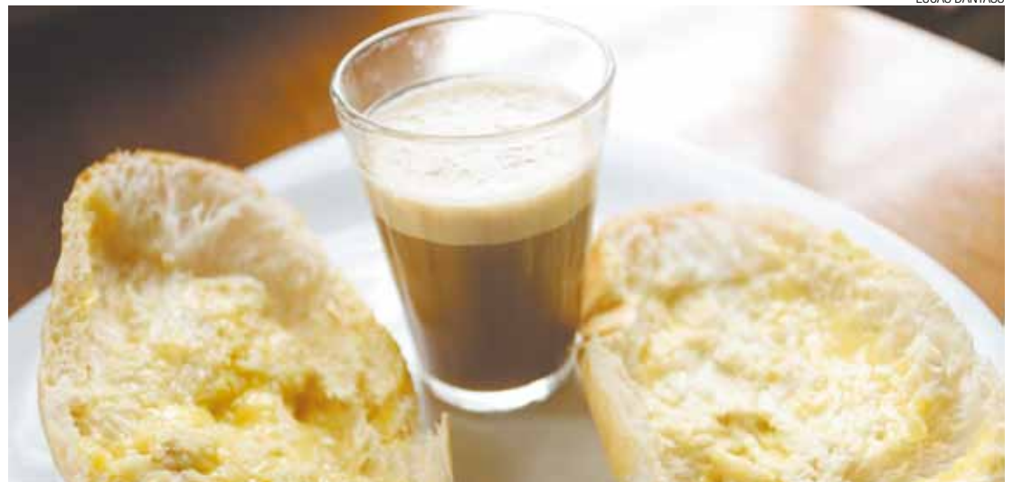
Salgado - Pãozinho com margarina e café com leite são os vilões na alta de preços mensurados pela Folha

A Folha Metropolitana comparou os valores a partir das pesquisas semanais feitas pela Secretaria de Desenvolvimento Urbano (SDU) entre os meses de janeiro de 2012 e de 2015. Os