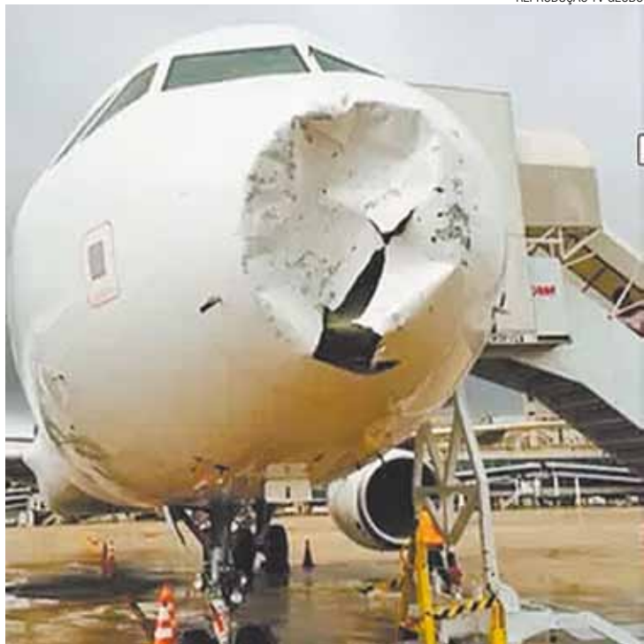
Destruição - Frente do avião ficou toda amassada; susto foi grande