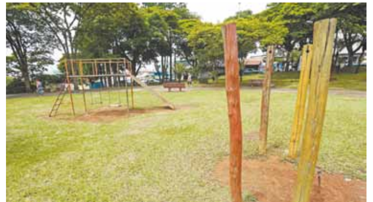
Vazio - Brinquedos deteriorados no playground desestimulam o uso