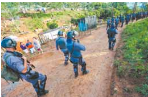
Operação - Policiais militares fortemente armados permaneceram na região para evitar vandalismo