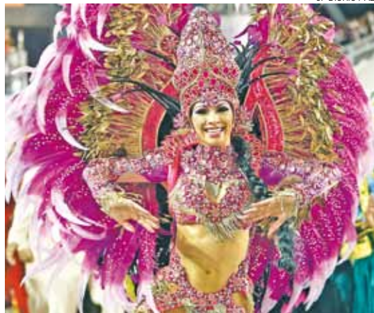
No embalo - Rosas de Ouro, uma das favoritas em SP