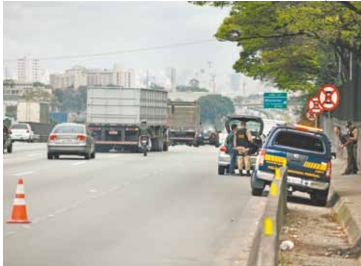
Via Dutra - São Paulo é o terceiro estado com maior número de casos

O Mato Grosso do Sul lidera os casos de tráfico de