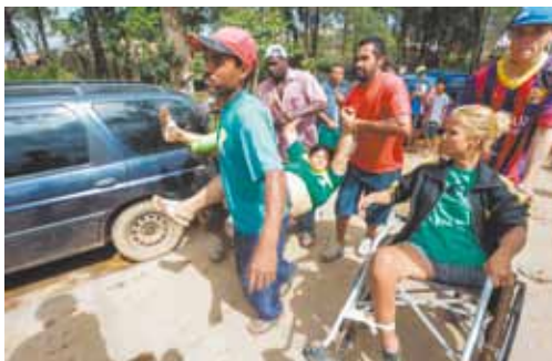
Revolta - Famílias denunciaram que polícia agiu com "truculência" e também com "deboche"