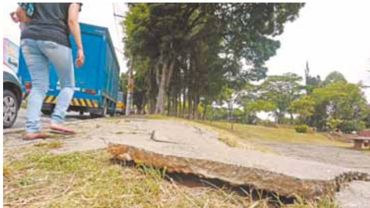
Perigo - Calçada quebrada oferece risco de acidentes aos moradores

No dia 26 de janeiro, dez mulheres que fazem caminhadas diariamente na praça se reuniram para mostrar à Folha Metropolitana os problemas do local. Além da falta de manutenção, havia muito entulho e o mato já encobria as pessoas. Nove dias depois, a Proguaru limpou.