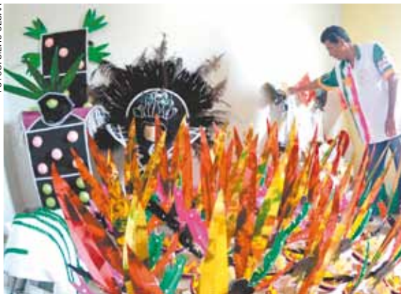
Jogos - Tema deste ano será sobre brincadeiras em geral