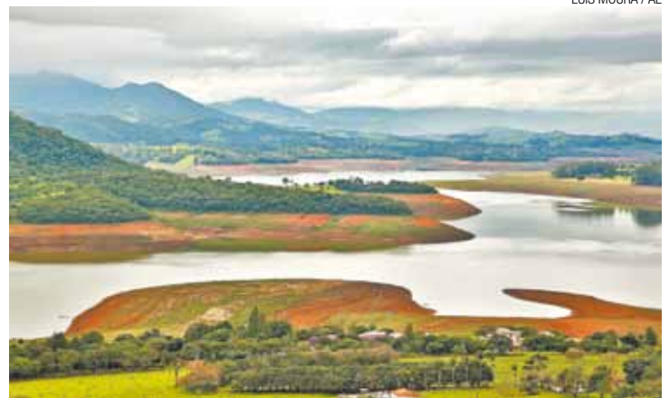
Aumento - Nove dias consecutivos sem nenhuma queda no sistema

O Cantareira não registra nenhuma queda há nove dias, período em que o manancial conseguiu recuperar 1,1 ponto percentual da sua capacidade.