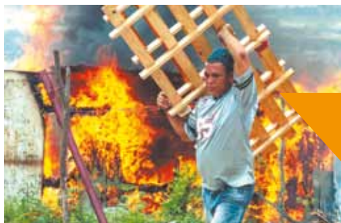
Dúvida - Ocupantes fizeram suas mudanças às pressas, a maioria sem ter para onde ir