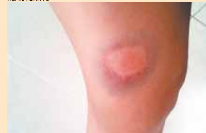
Ferimento - Repórter da Folha foi atingida