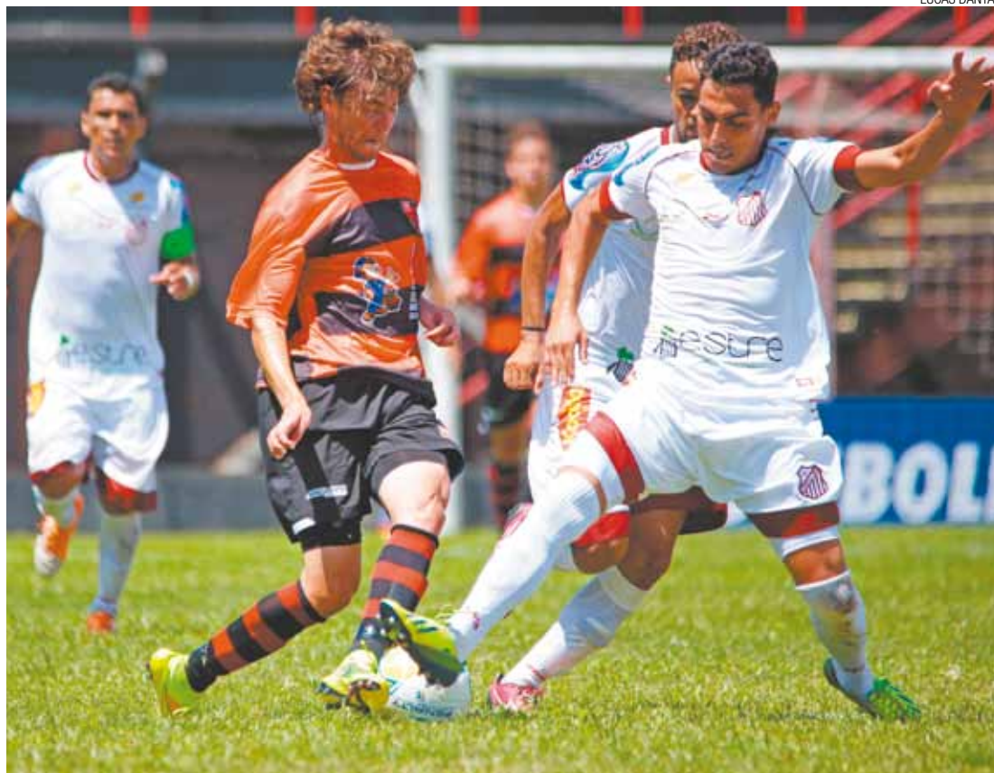
Empate - Na última rodada, em casa, o Flamengo empatou com o Sertãozinho e perdeu a 3ª colocação na tabela

O primeiro confronto aconteceu em 2002 e as duas equipes empataram em 3 a 3, no Ninho do Corvo, pela 12ª rodada da Série A2 do Campeonato Paulista. Os times não se enfrentam em uma competição oficial há cinco anos. No último encontro, a Águia venceu o Corvo em Guarulhos, pela quarta rodada da Série A2 de 2010.