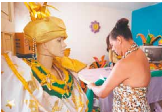
Trabalho - Equipe de arte trabalha até 13 horas por dia