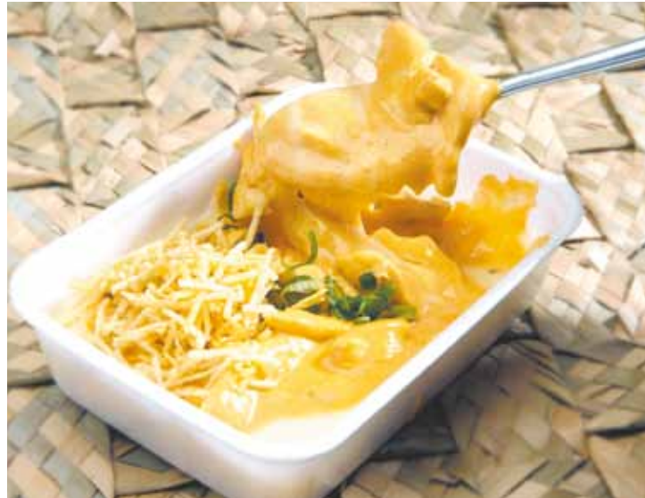
Diferente - "Aparecidinho de frango" é aposta de sucesso no evento