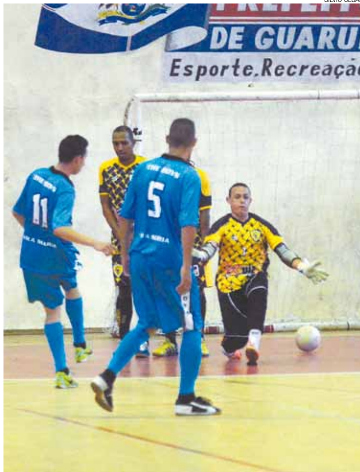
Carimbou - Camisa 11 Bolacha abriu caminho dos paulistanos à finalíssima

Depois de mais de um mês com 60 jogos de futsal, a Copa Montana chega ao fim, com uma grande decisão. Neste ano, o torneio beneficente que tem o apoio da Folha Metropolitana e da Secretaria de Esportes, reuniu 62 equipes. Cada uma doou pelo menos três cestas básicas. Os alimentos serão entregues ao Fundo Social de Solidariedade, ao Grupo Espírita Esperança e à Igreja Betel de Guarulhos.