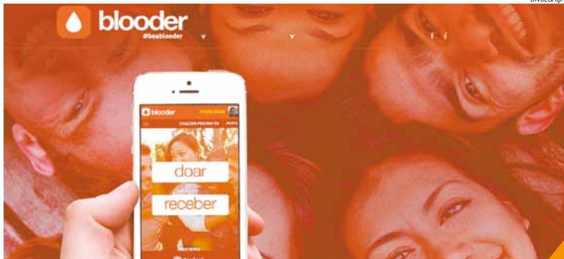
Eficiência - Estudantes criaram o aplicativo para unificar dados dos bancos de sangue da Grande SP e Rio

A Fundação Pró-Sangue, instituição pública ligada à SES, mantém um "placar" eletrônico no site ( http://www.prosangue.sp.gov.br/ ), onde informa seu estoque de sangue diário. No dia da realização desta reportagem os estoques de sangue O+, O- e A- eram críticos. Para efeito de comparação a quantidade de bolsas de O- ideal é 65 e o estado é considerado grave quando este número é menor do que 44 bolsas/dia.