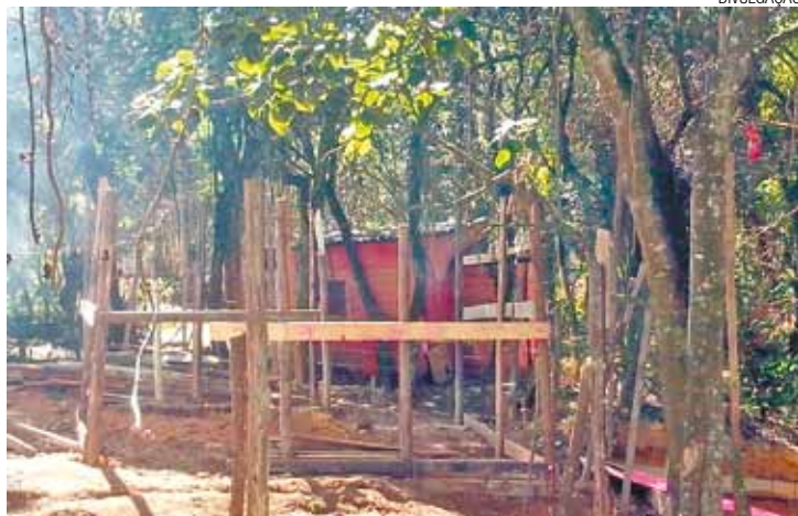
Projeto - Demarcações foram feitas com pedaços de madeira e faixas