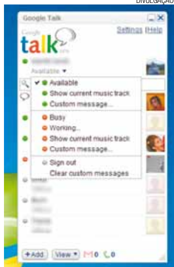
Instantâneo - Programa de comunicação foi criado em 2005

O caso lembra o Orkut, rede social muito popular no Brasil e pertencente ao Google que foi desativada em setembro do ano passado. Em 2011, a rede social contava com uma base de 30 milhões de usuários brasileiros, segundo