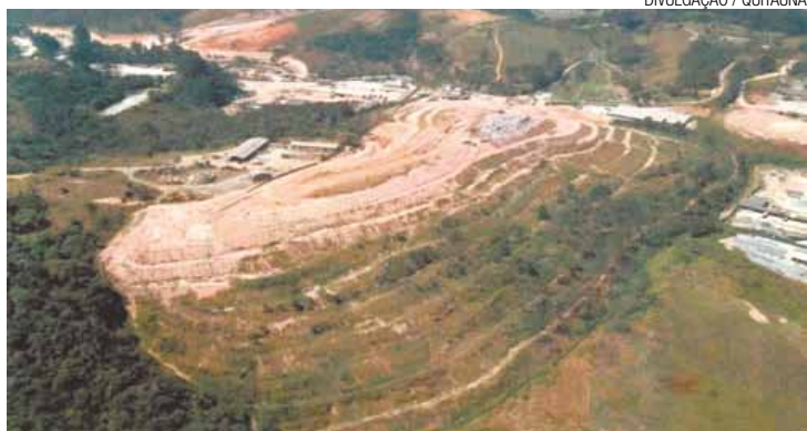
Saída - Prefeitura já estudava recorrer ao espaço do Cabucu até 2024