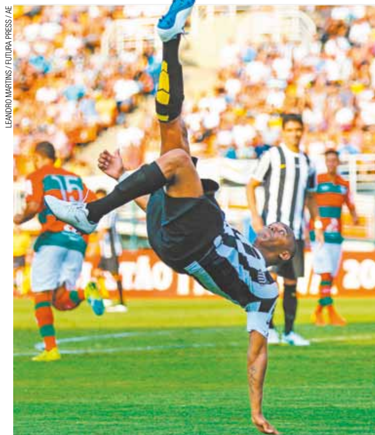
Quase fez chover - Craque do Peixe jogou tudo e mais um pouco ontem

GOLS - Robinho, aos 17 e aos 32, e Cicinho, aos 44 minutos do primeiro tempo. Jean Mota, aos 44 minutos do segundo tempo. CARTÕES AMARELOS - Fabinho Capixaba, Cicinho. CARTÃO VERMELHO - Alex Lima. ÁRBITRO - Marcelo Aparecido Ribeiro de Souza. RENDIA - Não disponível. PÚBLICO - 14.361 pagantes. LOCAL - Estádio Pacaembu.