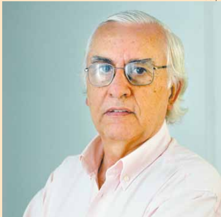
Realista - Diretor espera movimento menor nos shoppings

Não digo que uma coisa mata a outra. Assim como o comércio eletrônico não mata a loja física. Em um congresso em Nova York vimos que a loja física é a alma do varejo. No caso de shopping e centro urbano, um não perde para o outro. O que acontece nas cidades que lançam shoppings é que elas crescem. As prefeituras exigem cada vez mais dos empreende-