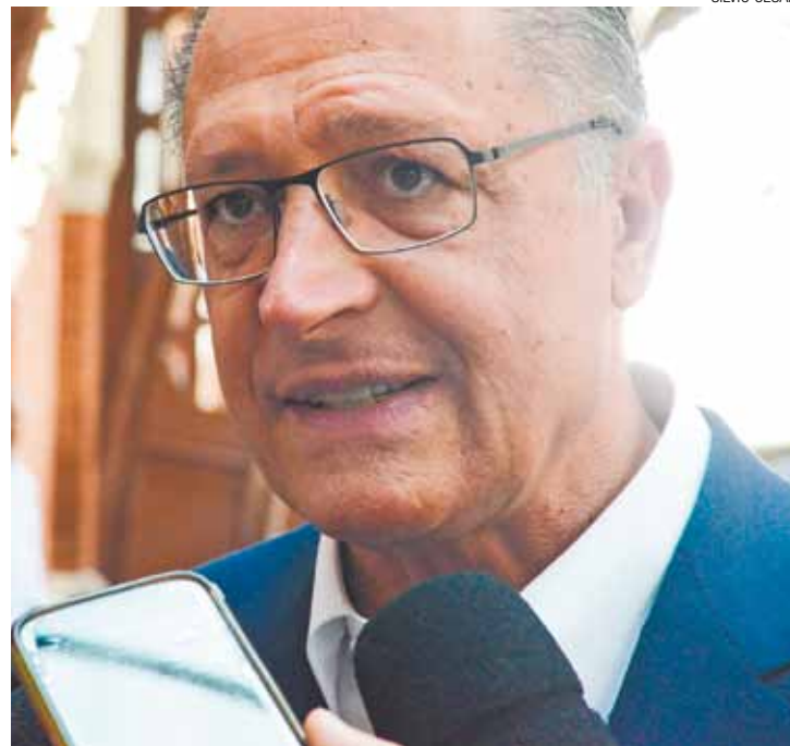
Prudente - Governador está feliz com as chuvas, mas com os pés no chão