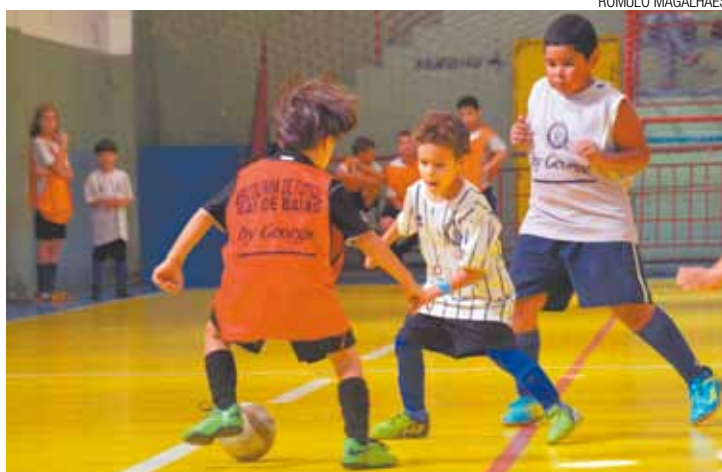
Coletivo - Garotos disputam bola na quadra da escolinha Sai de Baixo

ador Zanoni, além da promoção da prática esportiva, o aulão servirá para captar novos talentos, que poderão ganhar bolsas de treino. “Apresentamos às crianças todos os benefícios físicos, mentais e educacionais que o esporte