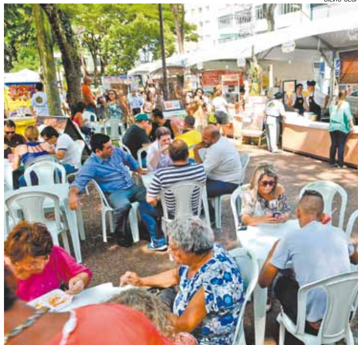
Almoço - Ontem à tarde o público na praça era bastante diversificado

No final de semana, outro evento do segmento está previsto: o Guarulhos Food Truck. Realizado de 27 de fevereiro a 1º de março, das 12h às 22h, na Praça Prefeito Paschoal Thomeu, este reúne estabelecimentos especializados em comida de rua.