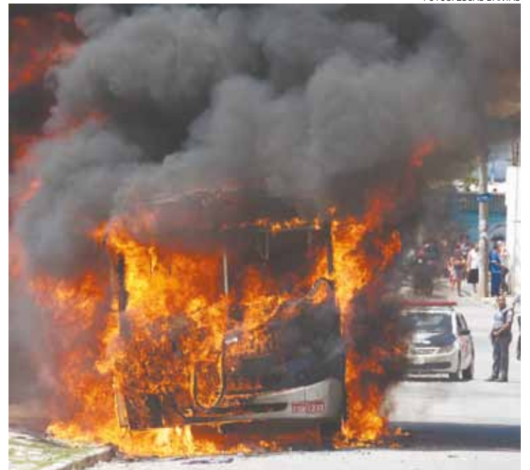
Violência - Vândalos ameaçaram queimar mais veículos coletivos

Ninguém saiu ferido e ninguém foi preso.