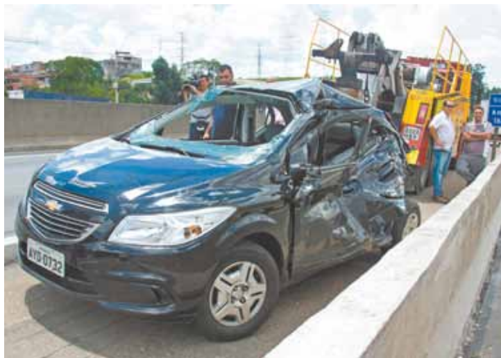
Acertado - Carro da GM também foi atingido no acidente

Helicóptero Águia, da Polícia Militar, foi acionado para ajudar no socorro