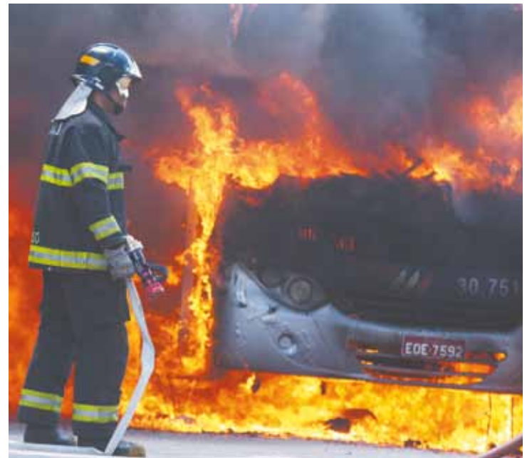
Perda total - Carros foram totalmente danificados pelas chamas