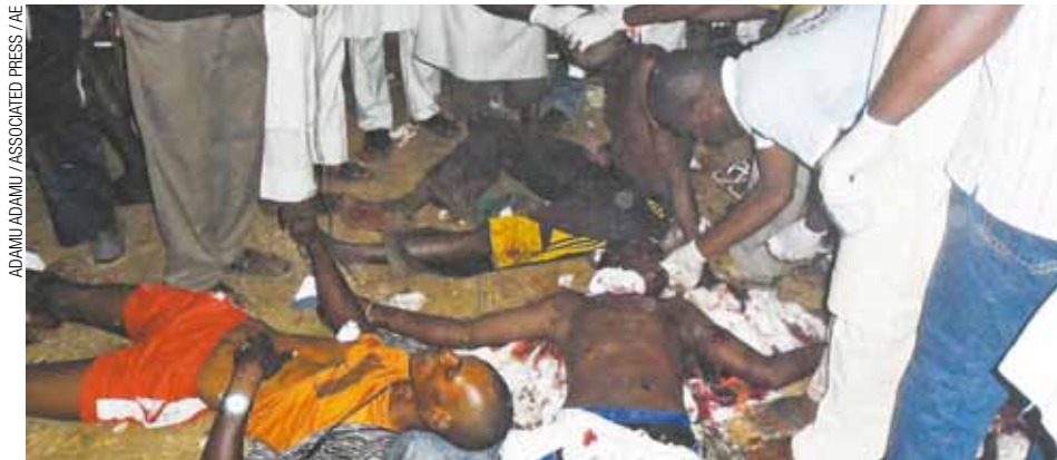
Dor - Mortos e feridos em cenário de barbárie completo na Nigéria

Espera-se que as eleições sejam as mais disputadas da história da Nigéria, o país mais populoso da África. O Boko Haram declarou que vai fazer de tudo para atrapalhar o evento com ataques aos locais de votação, além de denunciar a democracia como um "conceito Ocidental corrupto."