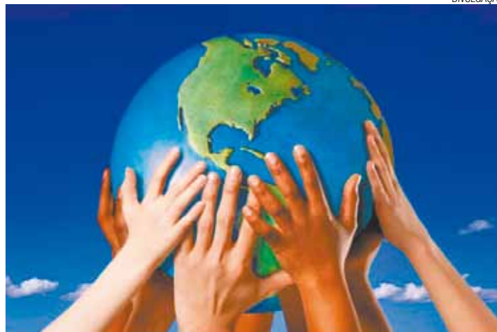
Oportunidade - Proposta da franquia é trazer ampla opção de destinos