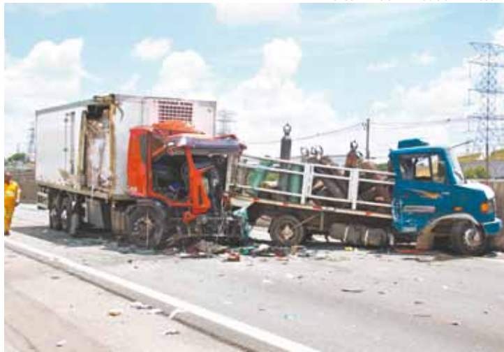
Na traseira - Caminhão vermelho acertou o outro com violência

Um ajudante, que estava no mesmo caminhão, não sofreu nenhum tipo de ferimento, apesar da violência do choque.