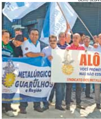
Repúdio - Trabalhadores querem revogação de medidas provisórias

Também foram alterados benefícios como abono salarial, seguro-defeso, pensão por morte, auxílio-doença e auxílio-reclusão.