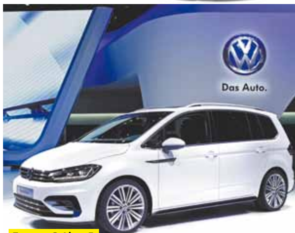
Touran R-Line E