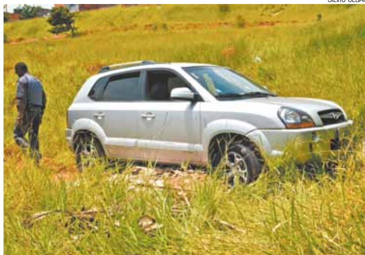
Perseguição - Depois da fuga, dois tiros atingiram a Tucson, no matagal