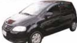
FOX 1.6 4P 07 PL-5743 - DH/VE/TE/LTT R$ 18.990,