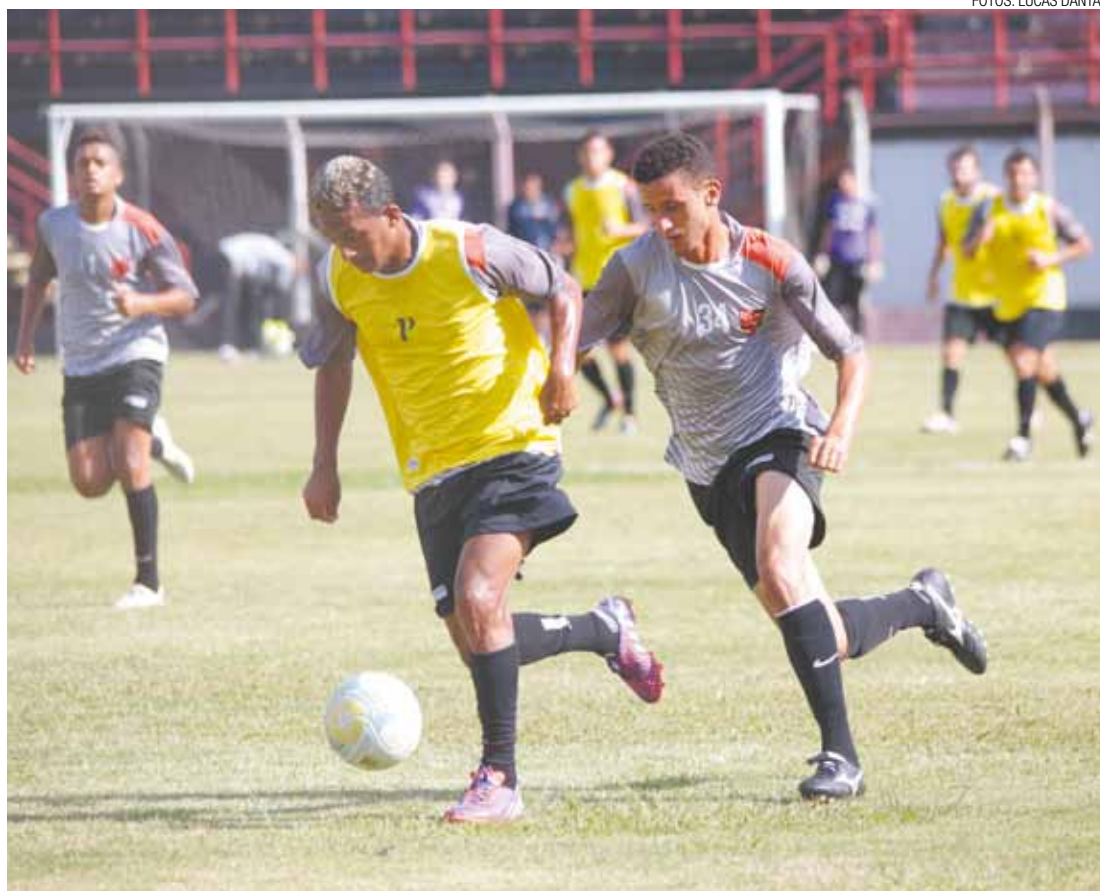
Preparação - Jogadores do rubro-negro suaram a camisa durante o treino de ontem, no Ninho do Corvo