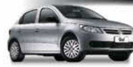
GOL G5 4P 11 PL-8580 - AR/DH/CONJ. ELÉTR. R$ 21.990,