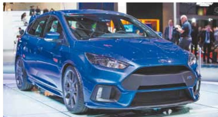
Focus RS - Primeiro veículo da marca a oferecer seleção de modo “drift”