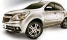
AGILE LT 1.4 11 PL-7433 - DH/CE R$ 25.900,