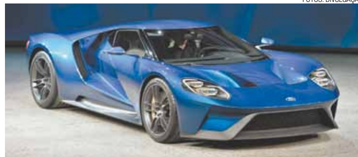
Ford GT - Carroceria de fibra de carbono e motor V6 EcoBoost com 600 cv

Motor EcoBoost presente no novo monoposto Fórmula MSA