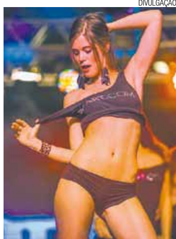
Sensualidade - Strippers fazem a diversão do público na feira

Feira reúne ícones do mercado adulto da América Latina