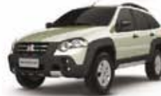
PALIO WEEK ADV. 1.8 8V FLEX 10 PL-5684 - COMPLETA R$ 33.500,