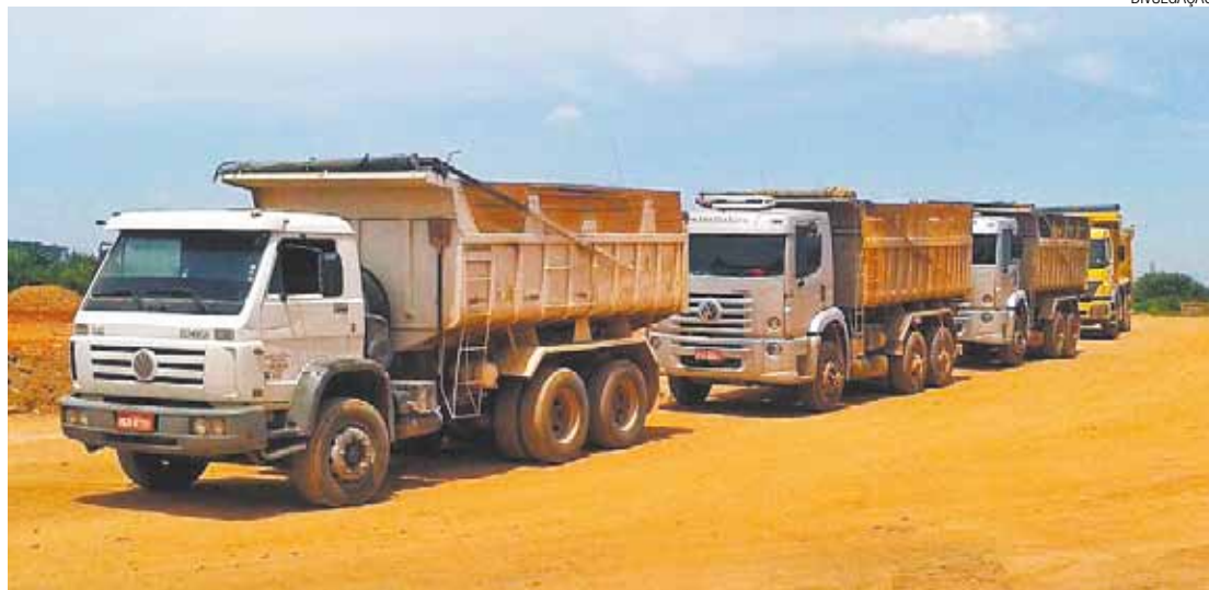
Multas - Para recuperar caminhões que despejavam terra no local, empresas terão de pagar multa nos pátios

O proprietário do terreno tem interesse em construir um centro de exposições e um shopping no local, em investimento de aproximadamente R$ 4 bilhões. Ele também será multado por movimentação irregular de terra.