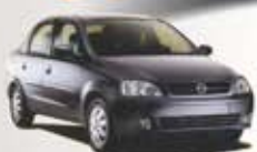
CORSA SD SUPER 01 PL-5917 - DH/VE/TE R$ 9.990,