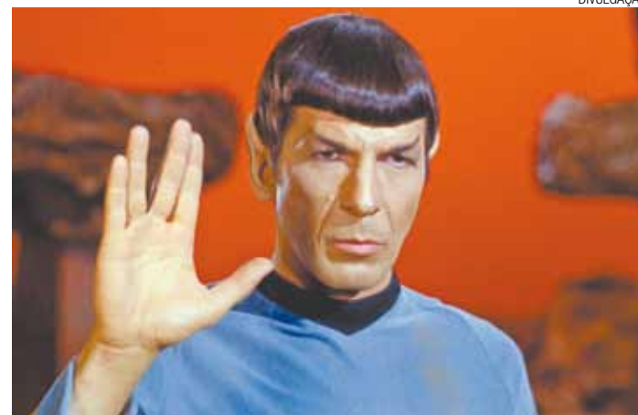
Leonard Nimoy - O célebre Spock, da série "Jornada nas Estrelas"