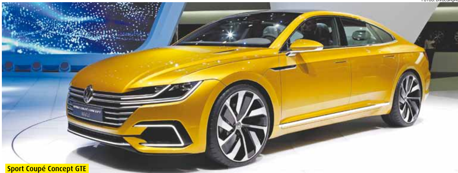
Sport Coupé Concept GTE

Ampla e variada gama de modelos da marca foi apresentada no Salão Internacional do Automóvel de Genebra