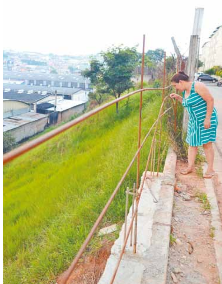
Risco - Moradores temem que parte do terreno do condomínio ceda