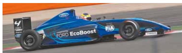
Fiesta R2 e Fórmula MSA - Carros de competição com motor EcoBoost