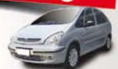
PICASSO EXCLUSIVE 1.6 FLEX 08 PL-8687 - AR/DH/DIG/RD/SOM R$ 22.990,