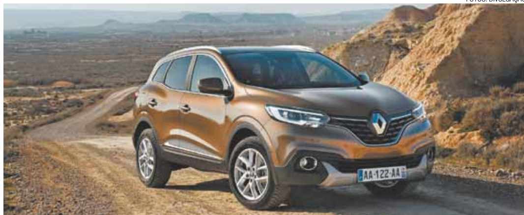
Crossover - Disponível em 4x2 e 4x4, o Kadjar é um convite à aventura tanto na estrada quanto na cidade

A comercialização do Kadjar se inicia em meados de 2015 na Europa e em vários países de África e da Bacia do Mediterrâneo.