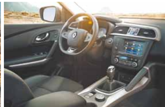
Segurança e conectividade - Interior esportivo e sofisticado, graças à qualidade dos acabamentos

Carro convida à aventura, mas também à cidade