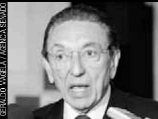
Senador Edison Lobão (PMDB-MA)