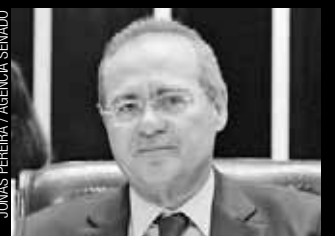
Senador Renan Calheiros (PMDB-AL)