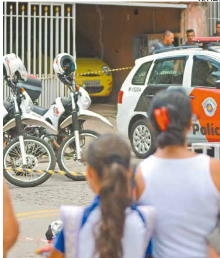
Indignação - Vizinhos e amigos lamentavam a morte da comerciante

Ela teria tentado pegar a arma que um dos ladrões derrubou durante o assalto. Ao perceber a reação da vítima um dos bandidos atirou. A bala atingiu o tórax dela. Os policiais chegaram ao local e conseguiram prender os três homens em flagrante. A mulher foi socorrida e levada para o Hospital Municipal de Urgências (HMu), no Bom Clima, mas não resistiu aos ferimentos.