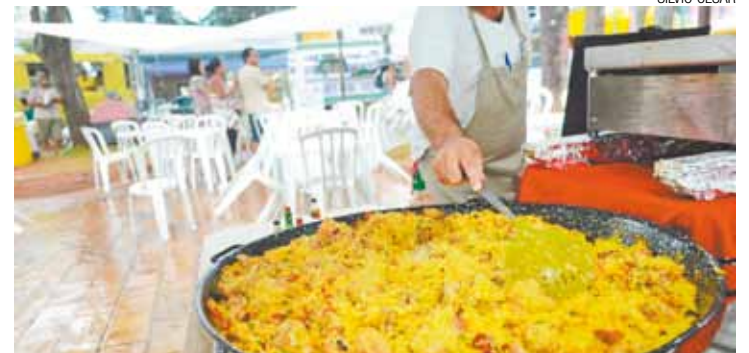
Diversidade - Evento itinerante oferece diversos tipos de comida