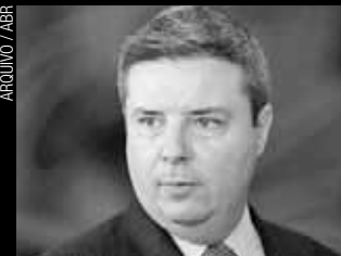
Senador Antonio Anastasia (PSDB-MG)