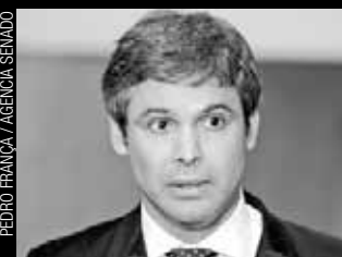
Senador Lindbergh Farias (PT-RJ)