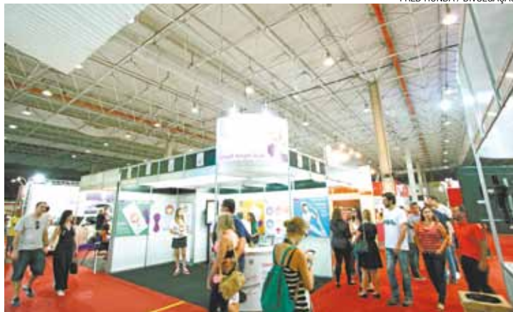
Diversidade - Evento conta com produtos para agradar todos os gêneros

A expectativa é manter o mesmo índice neste ano.