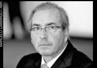
Deputado Eduardo Cunha (PMDB-RJ)