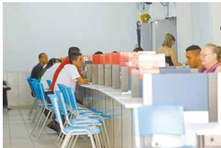
Ciet Centro - Agência indica vagas de empregos aos guarulhenses