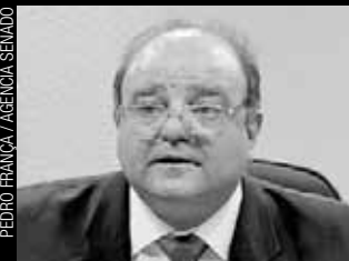
Ex-deputado Cândido Vaccarezza (PT-SP)