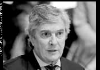
Senador Fernando Collor (PTB-AL)