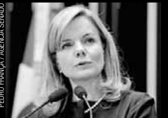
Senadora Gleisi Hoffmann (PT-PR)