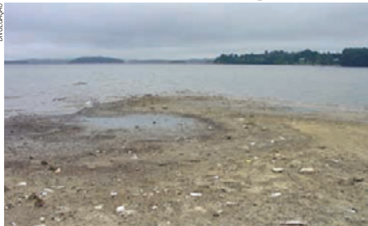
Número 1 - Sistema torna-se o maior fornecedor da Região Metropolitana