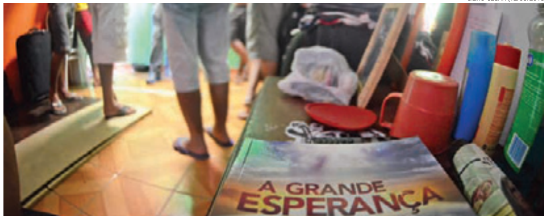
Aeroporto - Trabalhadores ficavam amontoados em imóveis pequenos, mal ventilados e sem comida

A Advocacia Geral da União e a Procuradoria Geral da República recorreram da decisão.