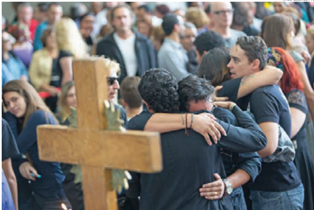
Emoção - No cemitério do Morumbi, amigos e familiares deram adeus à apresentadora do 'Viola, Minha Viola'