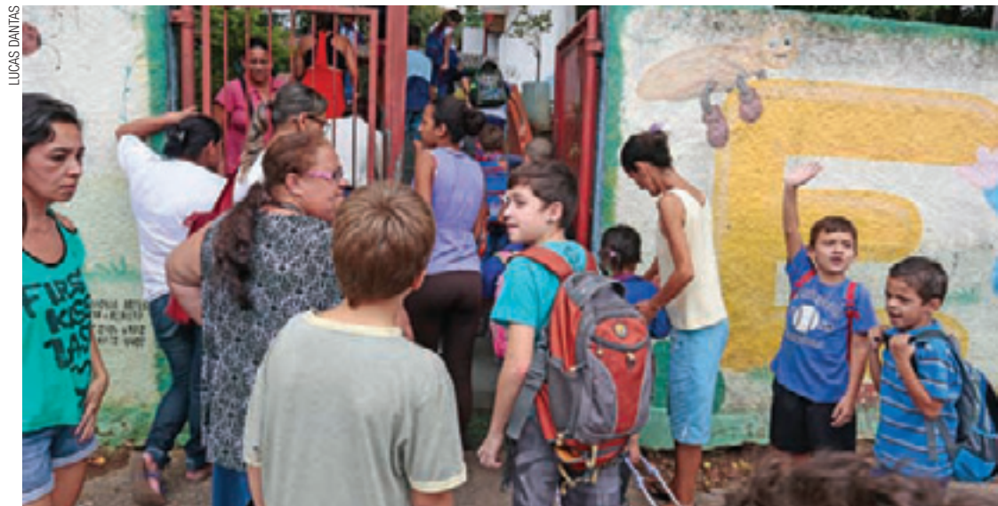
Reincidência - Mães deixam seus filhos, sem uniforme, na Escola Municipal Tia Anastácia, no Jardim Pinhal