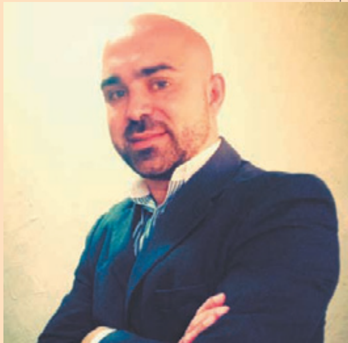
Crescimento - BNI espera ter três grupos em Guarulhos em 2015

São reuniões onde os profissionais seguem uma agenda estruturada de 20 itens com duração de 1h30.