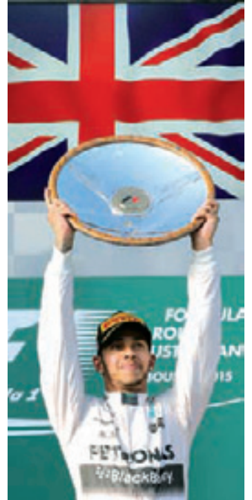
Faturou a primeira - Inglês ganhou abertura da Fórmula 1