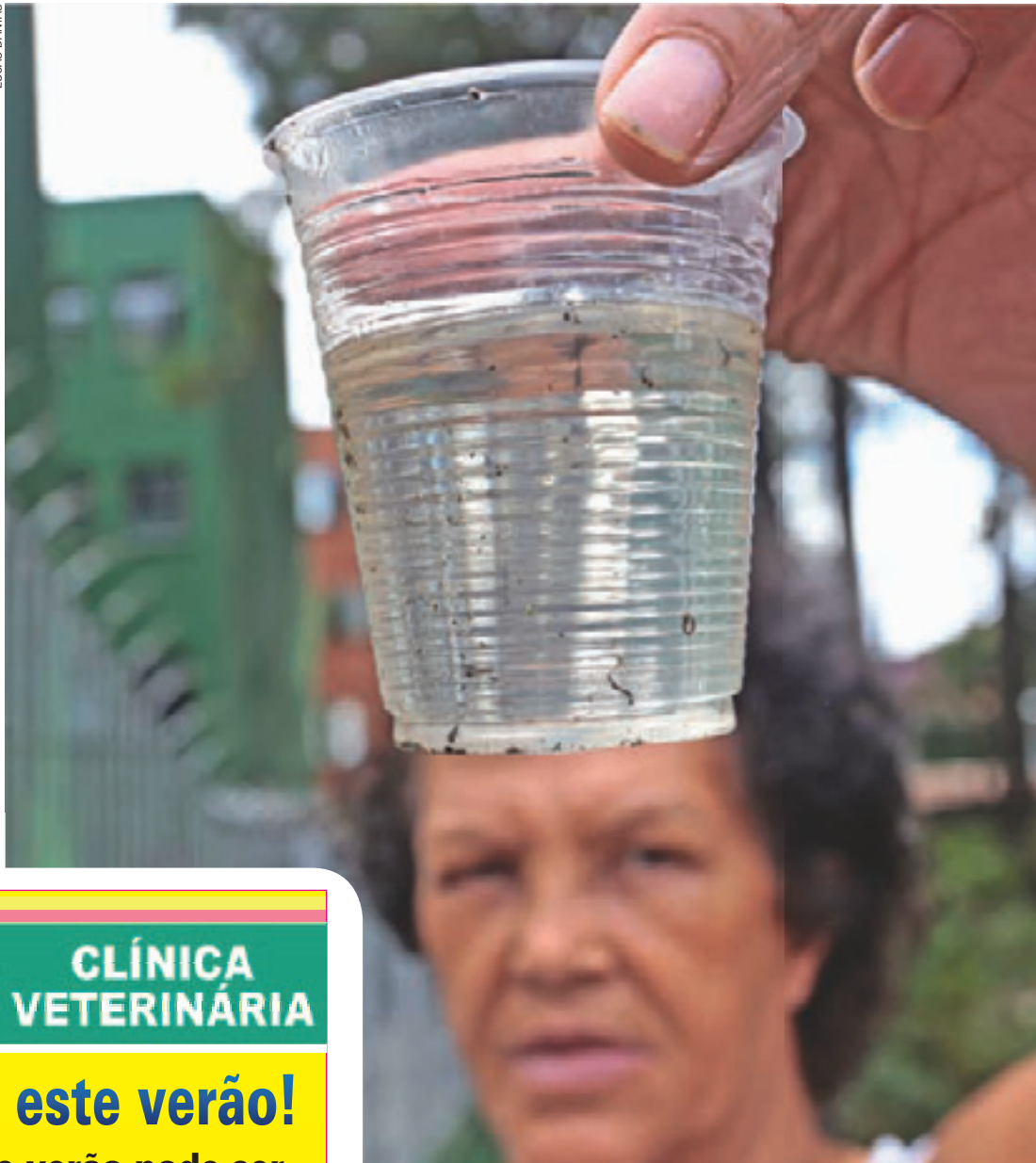
Alerta - Moradores do entorno temem contaminação pelo Aedes Aegypti