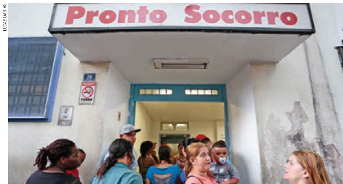
Superlotação - No início da semana, a espera para atendimento era de seis horas no Hospital da Criança

Pais reclamam por não encontrar pediatra em bairros; Secretaria da Saúde nega