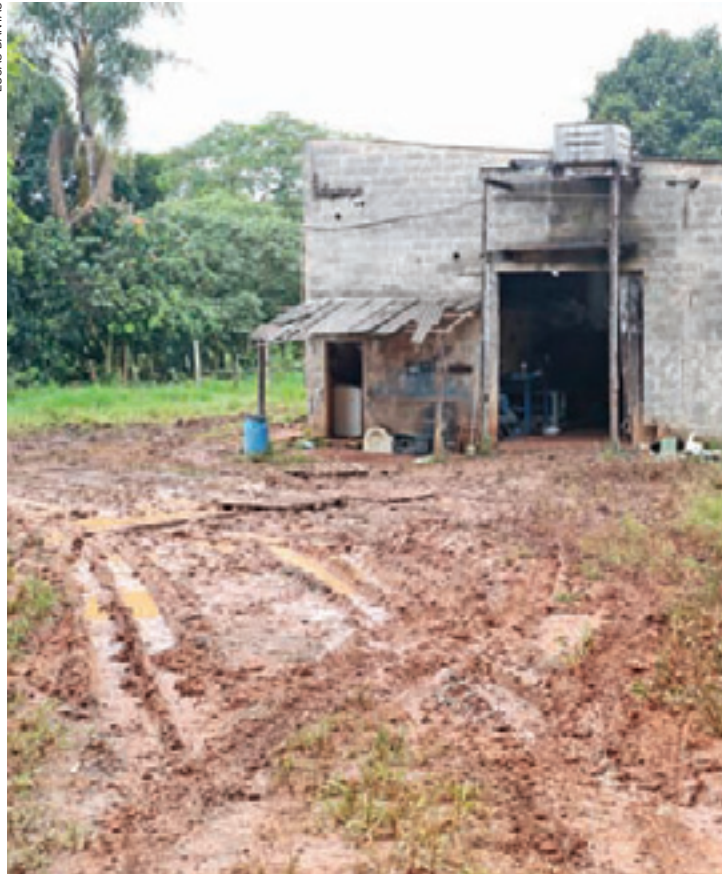
Atoleiro - Caminhão com explosivos estava em local de difícil acesso