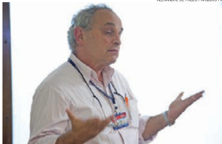
ALEXANDRE DE PAULO / ARQUIVO FM

O gerente responsável pelos condutores, conhecido como Gamboa, disse aos