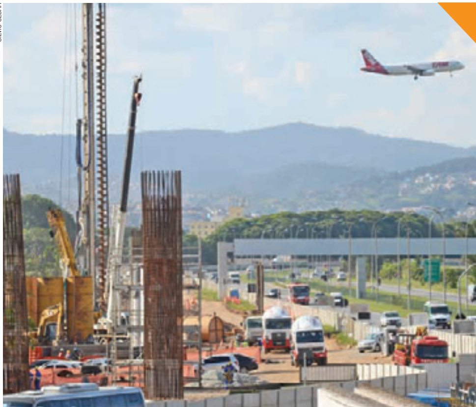
Construção - Canteiro de obras na Hélio Smidt segue a todo vapor, mesmo sem verba do PAC