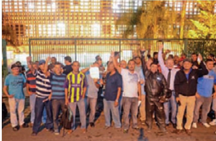
Manifestação - Metalúrgicos se reuniram ontem à noite diante do Fórum