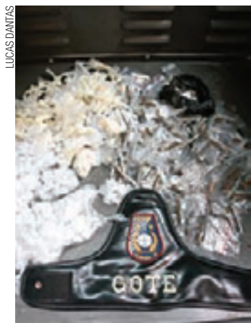
Entorpecentes - GCM apreendeu 1338 pacotes com drogas

A GCM informou que o Gote estava em patrulhamento na região quando avistou um indivíduo carregando sacolas suspeitas na altura do número 534 da Rua Santa Angelina. Quando o homem viu os guardas, largou os pacotes com as drogas no chão e fugiu por uma viela que fica próxima à rua. Os guardas não conseguiram alcançá-lo.