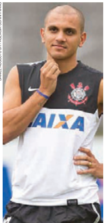
De volta - Lateral já está fazendo trabalhos no gramado