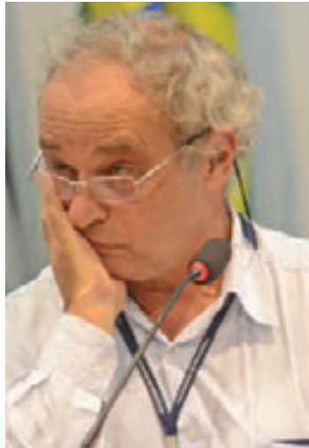
Bravo - Derman negou que tenha orientado motorista

De acordo com Derman, o motorista deu carona para conhecidos que voltariam para Guarulhos. Segundo o secretário, o condutor transportava dois pacientes que fazem tratamento no Instituto do Câncer de São Paulo (Icesp) e deu carona na Avenida Consolação.