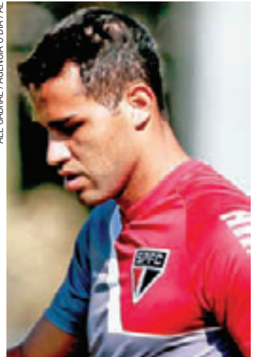
Trabalhando - Atacante respeita a reserva, mas quer ser titular