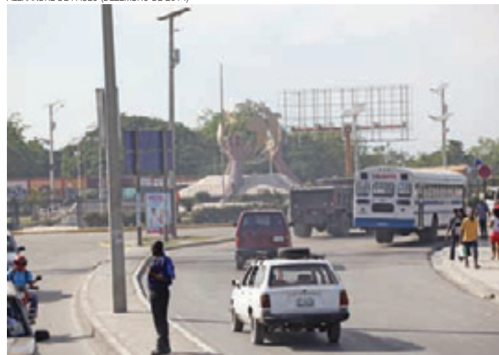
Porto Príncipe - Pleito presidencial está agendado para 25 de outubro