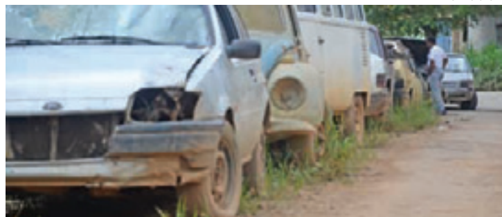
Problema - Veículos velhos são estacionados de forma irregular na rua

A Proguaru informou que realizará vistoria técnica no local para identificar os problemas e programar as intervenções necessárias.