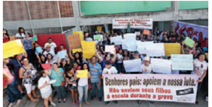
Manifestação - Na Região Pimentas, passeata reuniu dezenas de pessoas