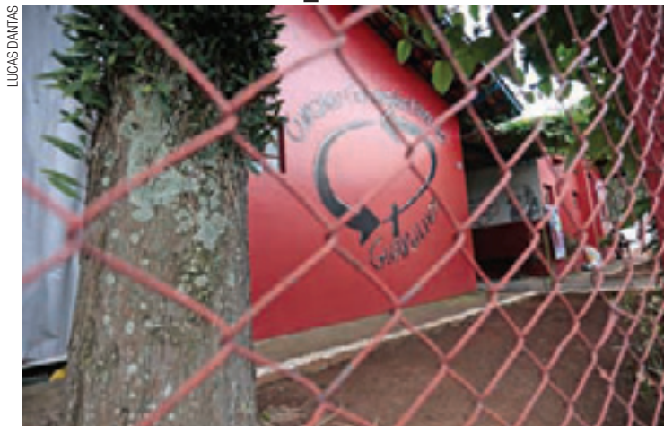
Espaço - Associação Babi possui projetos sociais nos Pimentas