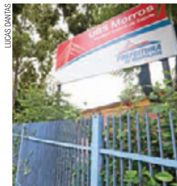
UBS Morros - Não há vagas para consultas ginecológicas de rotina