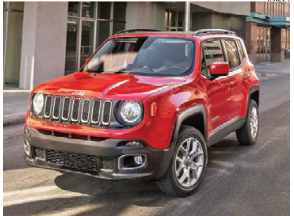
Robusto, moderno e ágil - O Renegade tem tudo para conquistar todo tipo de consumidor

O Renegade cumpre a promessa de um fora-de-estrada devido ao sistema de tração 4X4 Jeep Active Drive Low. No modo automático, o conjunto corta a tração traseira quando não há necessidade de utilizar a força integral. Oferece ainda o sistema Select-Terrain, onde o motorista tem disponível quatro modos de operação: automático, areia, lama ou pedras.