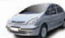
PICASSO EXCLUSIVE 1.6 FLEX 08 PL-8687 - AR/DH/DIG./RODAS/SOM R$ 22.990,