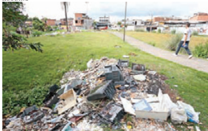
Poluição - Aparelhos de TV, sofás e entulhos estão espalhados pela grama