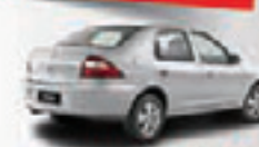
PRISMA MAXX 1.4 11 PL-0225 - AR/DH/CONJ. ELÉTR. R$ 23.900,