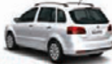
SPACEFOX TREND 1.6 FLEX 12 PL-2880 - COMPL./RODAS R$ 33.500,