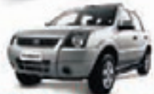
ECOSPORT XLT 1.6 FLEX 08 PL-4773 - COMPL./MEC. R$ 29.900,