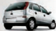
CORSA HT 1.0 04 PL-2183 - 0H R$ 12.990,