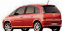
MERIVA JOY 1.8 07 PL-5488 - COMPL. R$ 16.990,