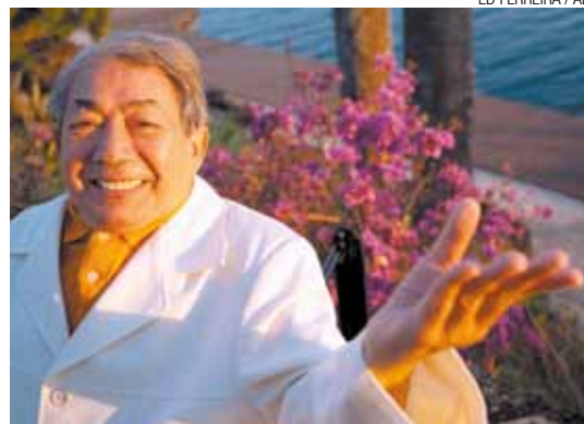
Joãozinho Trinta - O povo gosta mesmo é de luxo