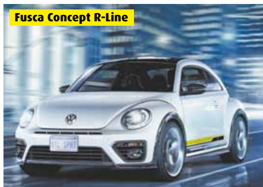
Fusca Concept R-Line