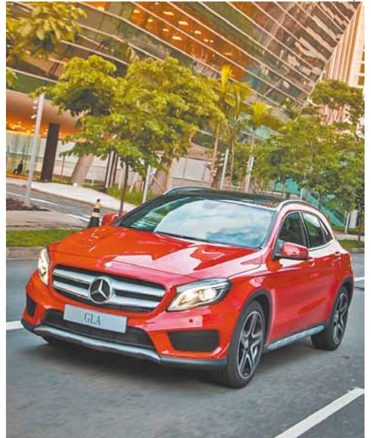
Design - Grades do radiador e desenho dos faróis integrados são destaque

O novo GLA 250 estará disponível em toda a rede de concessionários a partir de abril, com preço sugerido de R$171.900,00 para a versão Vision e R$189.900,00 para a versão Sport.