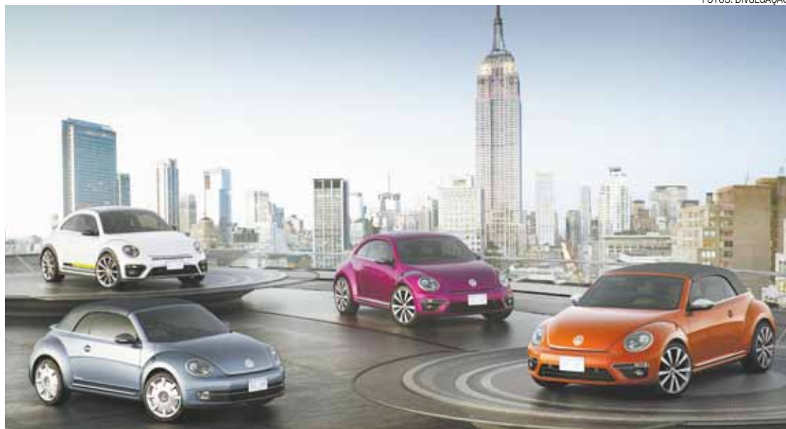
Novas versões - Fusca Concept R-Line, Fusca Cabriolet Denim, Fusca Pink Edition e Fusca Cabriolet Wave

O Beetle R-Line Concept 1 se destaca claramente pela esportividade. Ele é impulsionado pelo motor 2.0 TSI que gera potência de 220 cv (162 kW) e harmoniza perfeitamente com o design do carro. Essa versão do Fusca, pintada em "Branco Orix Perolizado", chama a atenção por seus para-choques independentes e painéis envolventes da carroceria em preto com alto brilho, um difusor também em preto e um grande defletor de ar traseiro. A impressão esportiva do carro se manifesta também no interior, com bancos esportivos tipo concha e elementos com aparência de couro e fibra de carbono.