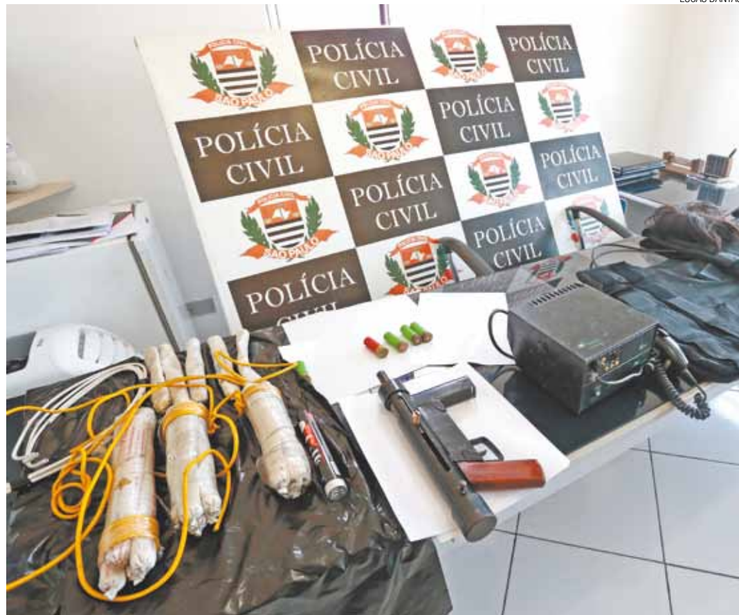
Crime detonado - Bandidos estavam fortemente armados com alguns explosivos e duas armas militares