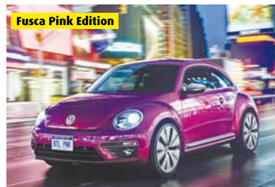
Fusca Pink Edition

Fusca Concept R-Line, Cabriolet Denim, Pink Edition e Cabriolet Wave são atrações no Salão de Nova York