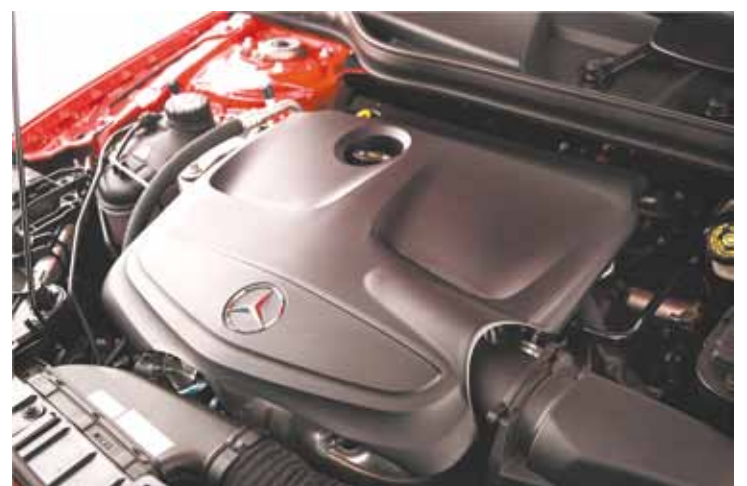
Motor - Apelo esportivo com aceleração de 0 a 100 km/h em 7,2 segundos