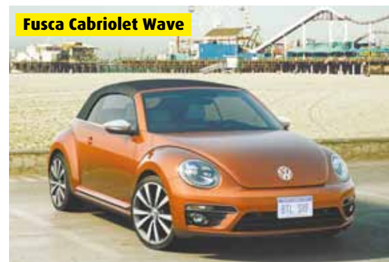
Fusca Cabriolet Wave