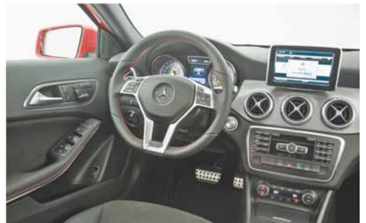
Interior - Arrojo e imponência tem continuidade no interior do veículo