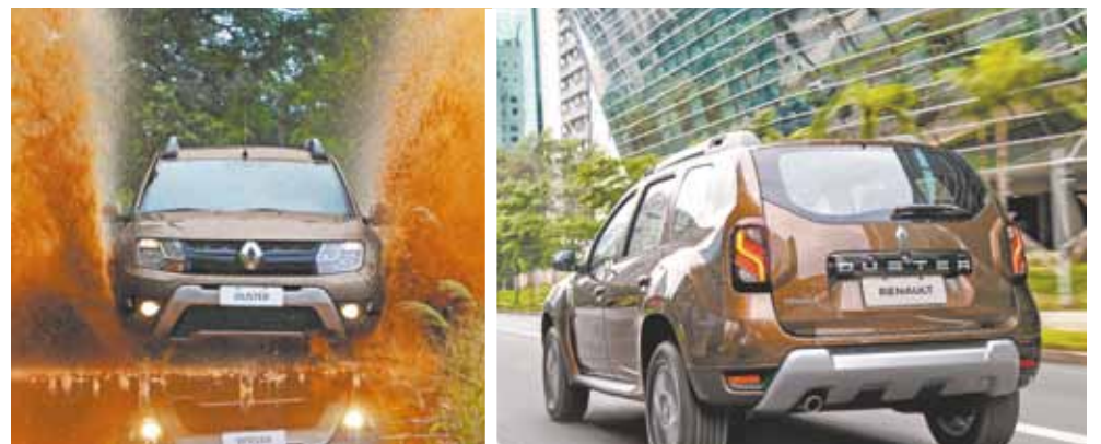
Design - Novo Renault Duster passa por discreta mudança no visual e interior na linha 2016