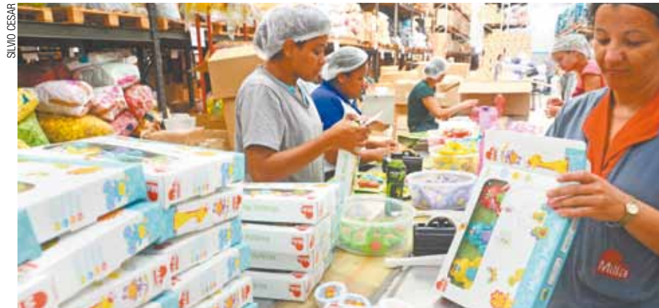
Produção - Na empresa Millababy, a fábrica segue a todo vapor com a expectativa de negócios

A 32ª Abrin acontece de hoje até quinta-feira (9), das 10h às 20h, e na sexta-feira (10), das 10h às 18h, no Expo Center Norte (Rua José Bernardo Pinto, 333, Vila Guilherme, São Paulo). Mais informações pelo telefone 2226-3100 e pelo site www.abrin.com.br .