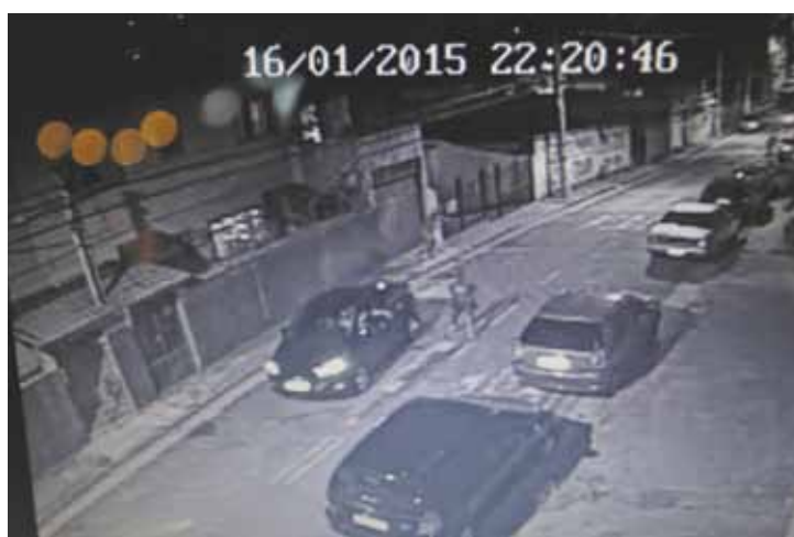
Crime - Imagens registram fuga de suspeitos de matar Isaias da Silva