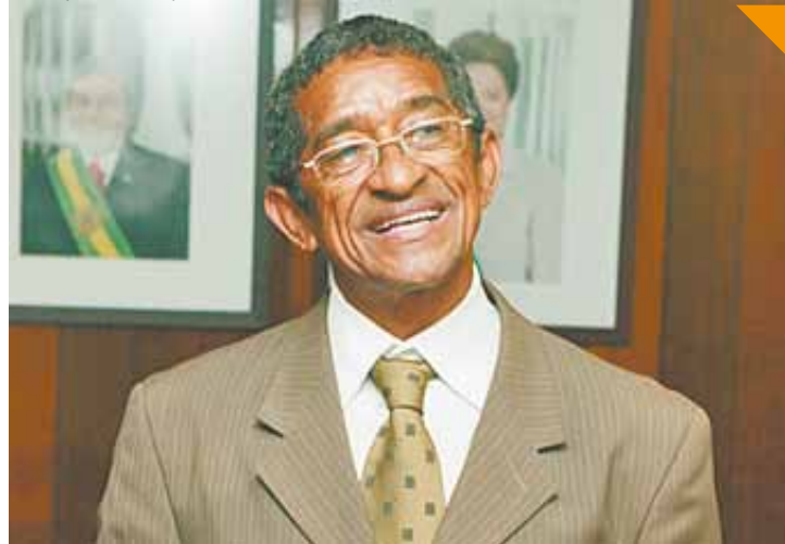
Alternativa - Vicentinho defende mais direitos para terceirizados