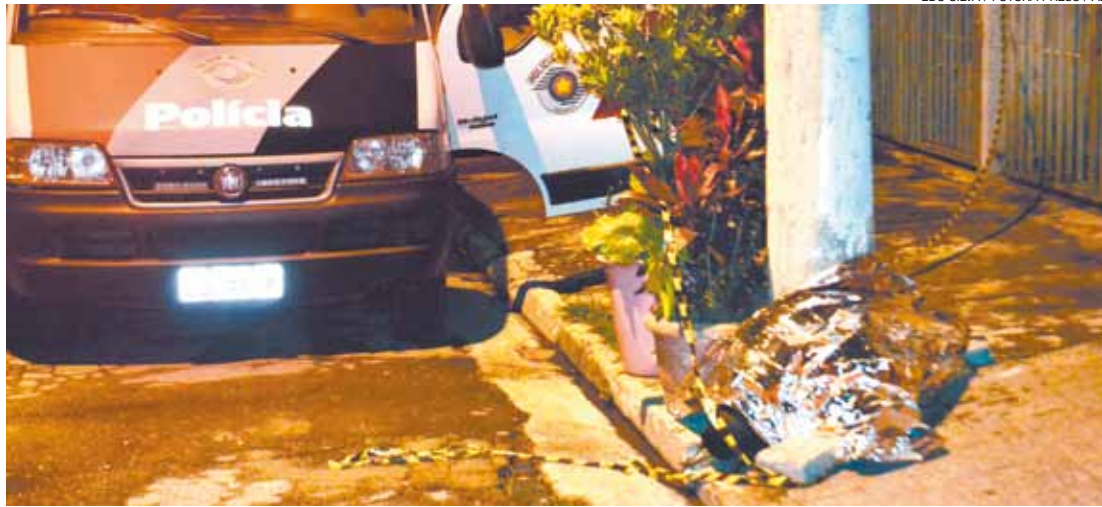
Violência - Em todas as ocorrências as vítimas foram mortas a tiros e nenhum suspeito foi identificado

No final da noite de domingo, Sérgio Duarte, 39, foi encontrado morto na altura do número 234 da Rua Pavini (Região Centro). Ele estava dentro de sua borra-