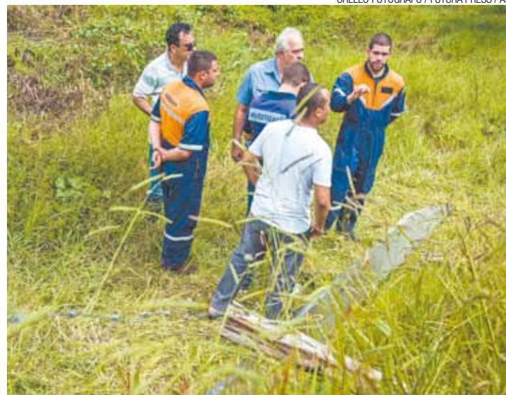
Acidente - Técnicos próximos de uma das pás que se despreendeu

Peritos da Aeronáutica que estiveram no local do acidente nos últimos três dias também citam como "totalmente incomum" a soltura de pás da hélice de um helicóptero. Além do filho de Alckmin, estavam na aeronave o piloto e um me-