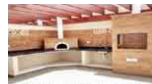
CHURRASQUEIRA E FORNO