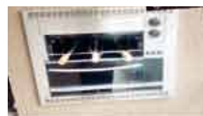
CHURRASQUEIRA A GÁS EM TODOS APTOS

AV. DR. TIMÓTEO PENTEADO Nº 4.056 - VILA GALVÃO - GUARULHOS