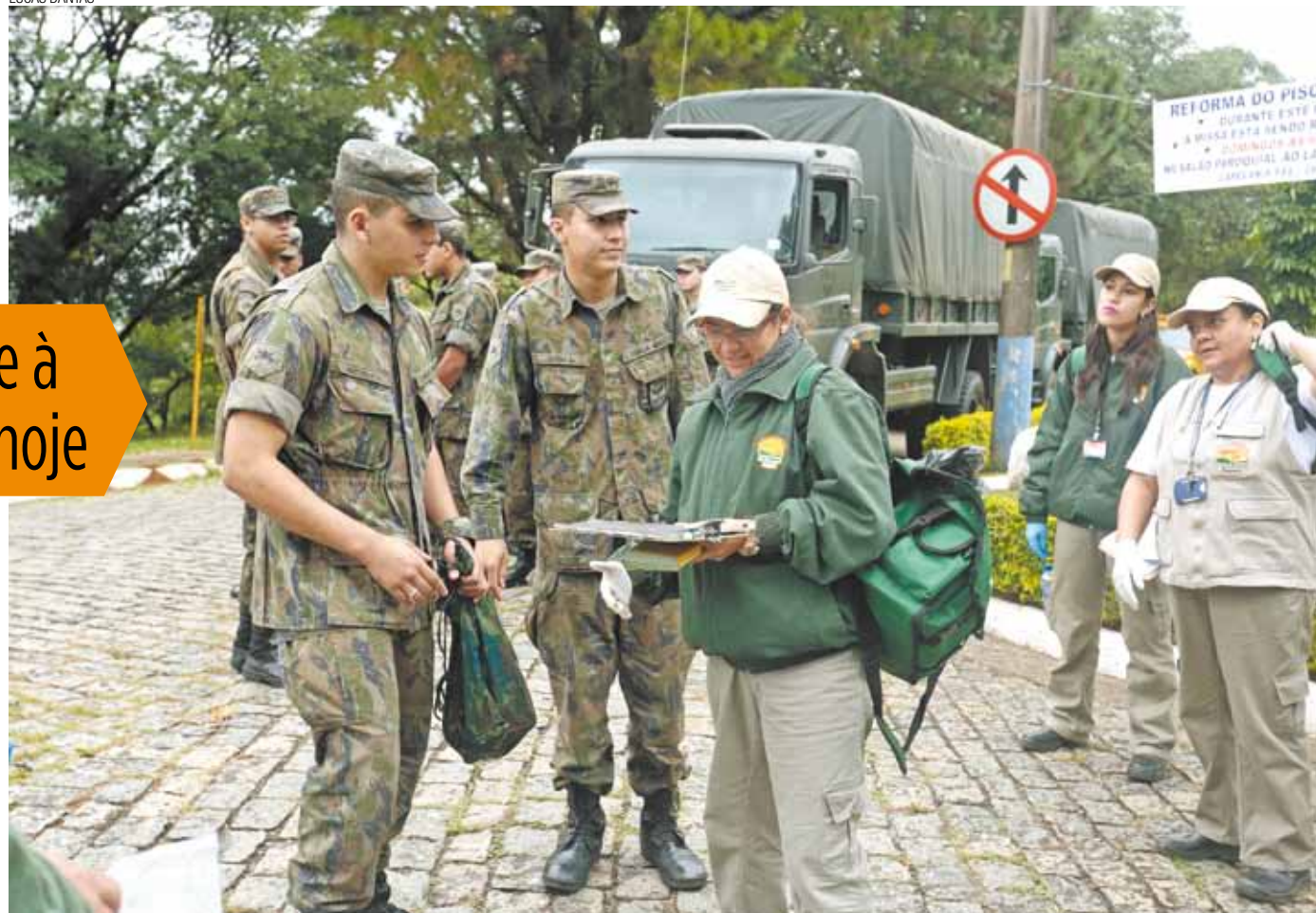
Ação civil-militar - Agentes do CCZ e militares da FAB trocaram informações e agora compõem efetivo de luta contra focos do mosquito

Educação atrasa entrega de uniformes escolares Pág. 10