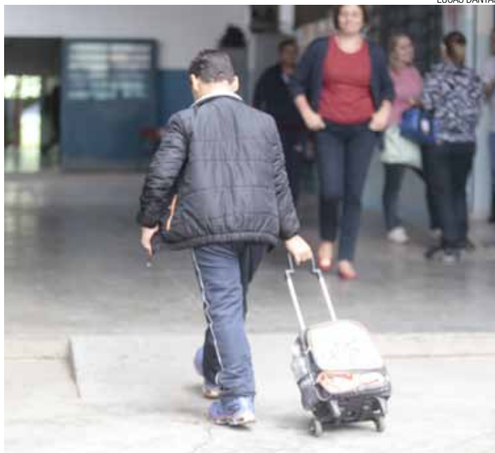
Uniformes - Alunos da EPG Moreira Matos também estão sem os kits

A EPG Siqueira Bueno, da Vila Galvão, já recebeu os kits.