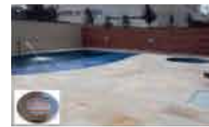
PISCINAS AQUECIDAS C/ LED