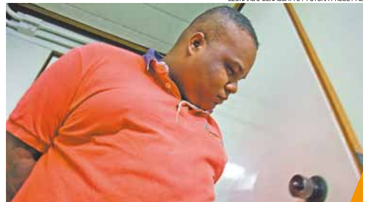
Em cana - Homem foi encontrado na Cohab Juscelino, em Guaianases

Em nota, o Metrô informou que foi a sua equipe de segurança "que fez o primeiro atendimento e providenciou o encaminhamento da funcionária para a Delpom".