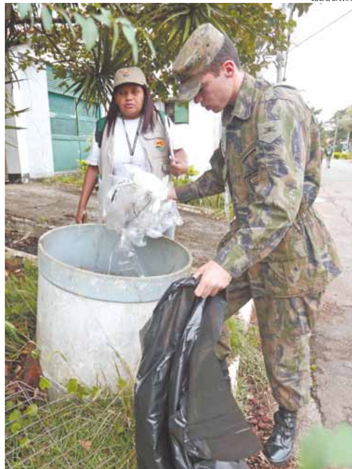
Ação - Varredura na Vila Militar fez parte da capacitação dos militares

Com essa capacitação a previsão é de que os militares comecem a visitar os bairros com os agentes a partir de hoje.