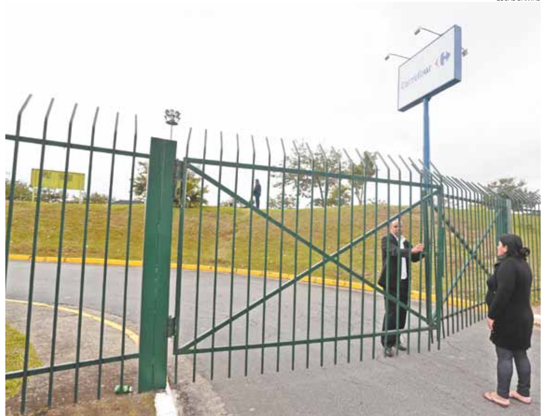
Silêncio - Nenhum informativo foi afixado na unidade para advertir os clientes sobre a interdição

Quando foi abrir o portão a um carro que saía do mercado, um segurança afirmou a clientes que o Carrefour estava fechado para “manutenção.”