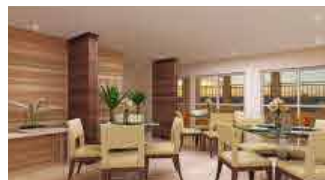
SALÃO DE FESTA