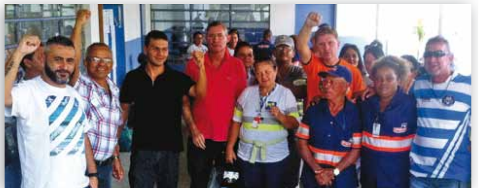
MOBILIZAÇÃO - Diretores reunidos com Servidores da unidade GOC Pio XII, na Proguaru

O povo brasileiro tem cobrado um Estado mais eficiente e melhores serviços públicos. E não há serviço público de qualidade sem Servidor Público valorizado.