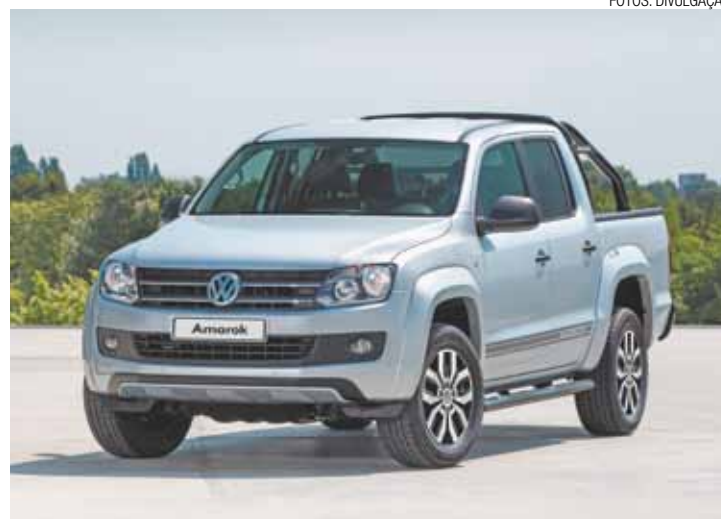
Série Especial - Dark Label, picape média da Volkswagen, apresenta um visual mais esportivo com elementos exclusivos