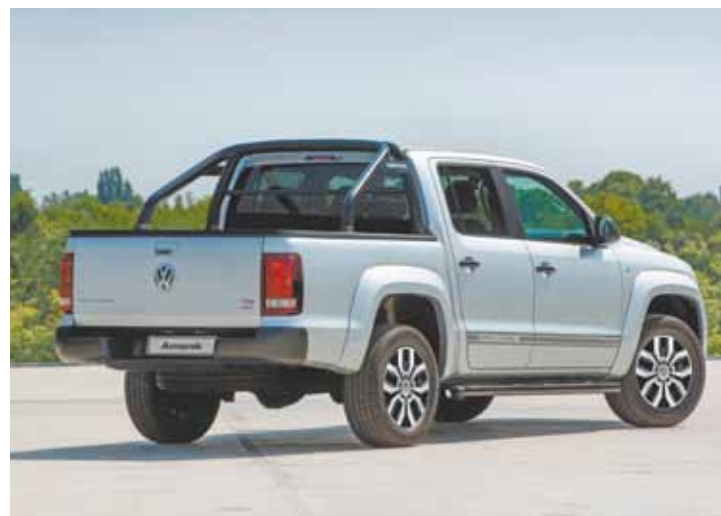
Exclusividade - Rodas de liga leve "Roca", com 17 polegadas com pneus 245/45 R17 distingue a Dark Label das outras versões