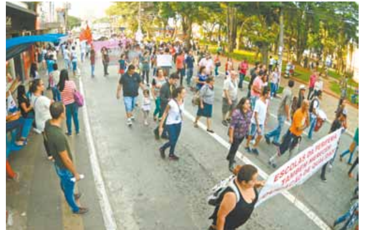
Caminhada - Cerca de 300 educadores foram do Centro até a Dutra

A empresa Engetal será responsável pela obra. Inicialmente, o valor total da construção estava estimado em R$ 67,3 milhões. A economia gerada com a licitação se aproxima de R$ 11,6 milhões. O prazo de conclusão do edifício é de dois anos e cinco meses, mas o contrato com a empresa se estenderá por mais seis meses.