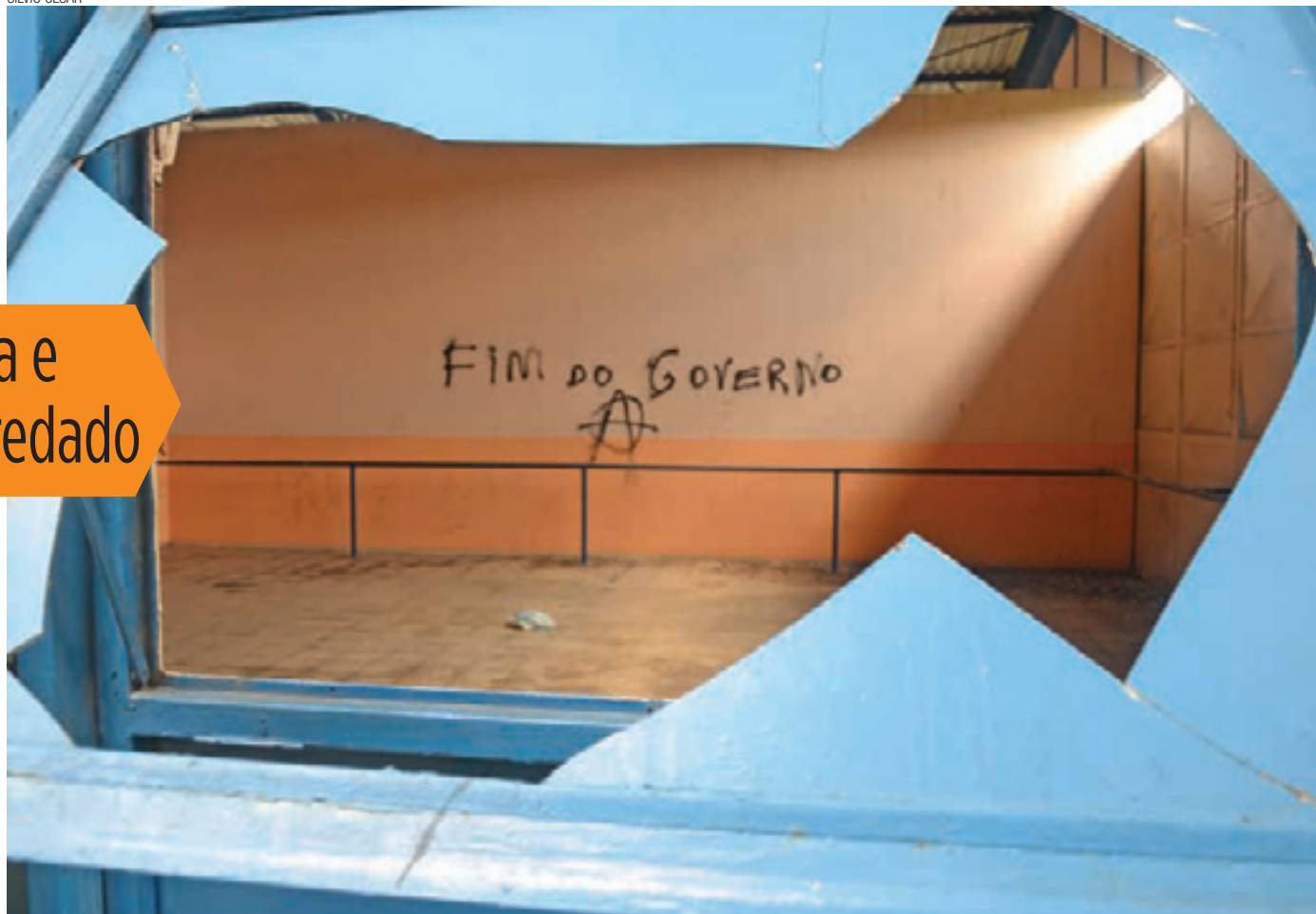
Largado - Espaço social do complexo poliesportivo é um dos mais detonados, com portas e janelas quebradas, pichações e bastante sujeira