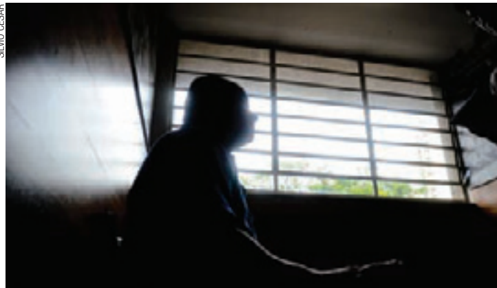
SUSTO - Homem, de 42 anos, foi abordado por ladrões a 200 metros de casa

ALFREDO HENRIQUE - Dois suspeitos, ainda não identificados, renderam ontem um condutor quando ele saía de casa para trabalhar. A vítima, de 42 anos, estava a 200 metros de casa, no Jardim Kátia (Região Cumbica), quando a dupla o abordou. Eles roubaram seu carro e quase R$ 1 mil que a vítima levava consigo para pagar uma prestação de seu veí-