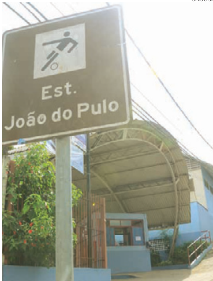
Às moscas - Em 2012, município gastou quase R$ 2 milhões em reformas