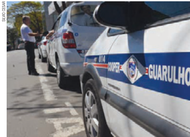
Herança - Novas placas passarão a motoristas que atuam como prepostos

Um Termo de Ajuste de Conduta firmado entre a STT