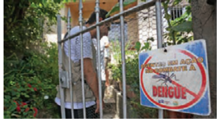
Combate - Segundo Saúde, março e abril são meses favoráveis à doença