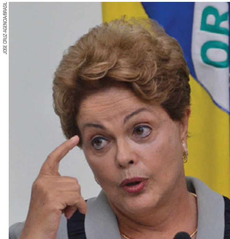
Dilma - Mais mimos para tentar ter os 'aliados' ao seu lado

Aeronáutica disse que não tem uma contabilidade