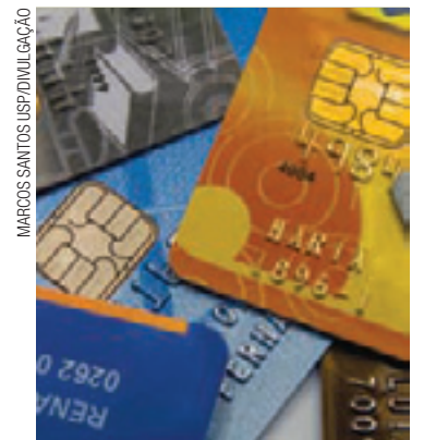
Cartões - Estão assustando e afastando os consumidores