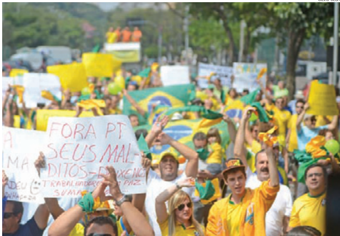
Impeachment - Manifestantes pediram a saída imediata da presidente da República, Dilma Rousseff (PT)

Durante o percurso, lideranças faziam discursos e críticas ao Partido dos Trabalhadores (PT) e sua gestão à frente dos poderes executivos municipal e federal. No fim, os manifestantes cantaram novamente o hino nacional.