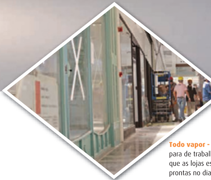
Todo vapor - para de trabalhar que as lojas estão prontas no dia