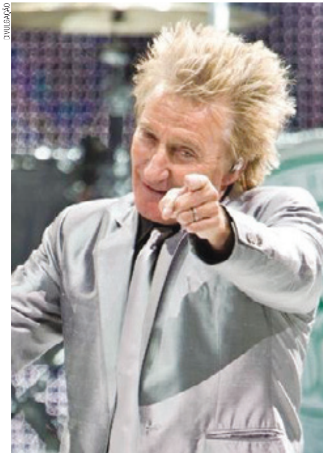
Esgotado - Show de Rod Stewart com os ingressos vendidos

Nas redes sociais, alguns fãs reclamaram que as entradas se esgotaram em menos de 15 minutos. Pelo Twitter, a produção do festival disse que as vendas seguiam normais e não havia instabilidade no sistema. "Há ingressos para todos os dias do festival", diz mensagem postada no site do evento.