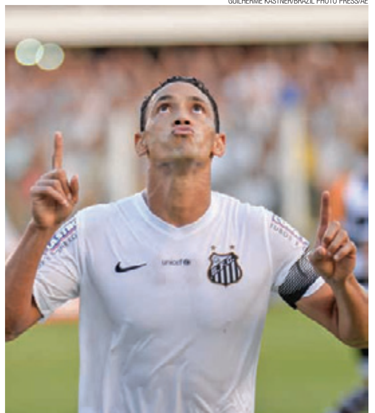
Goleador - Ricardo Oliveira marca e assume artilharia do campeonato