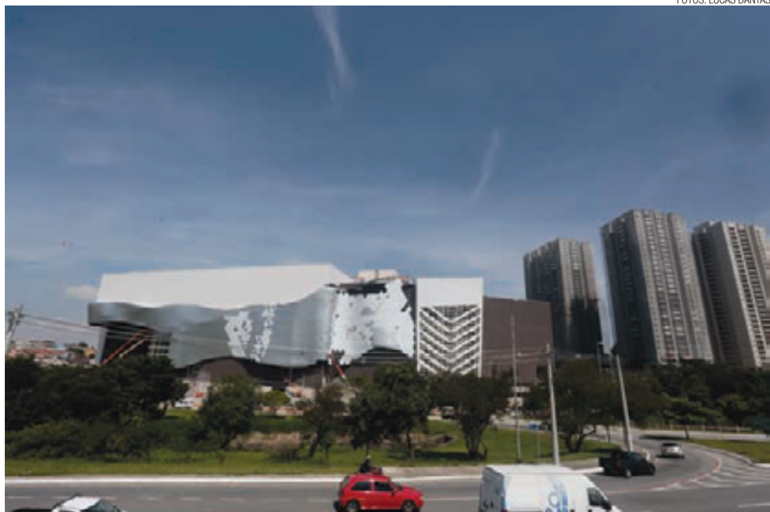
Luxuoso - Shopping será o primeiro de Guarulhos destinado a um público dos mais sofisticados da cidade