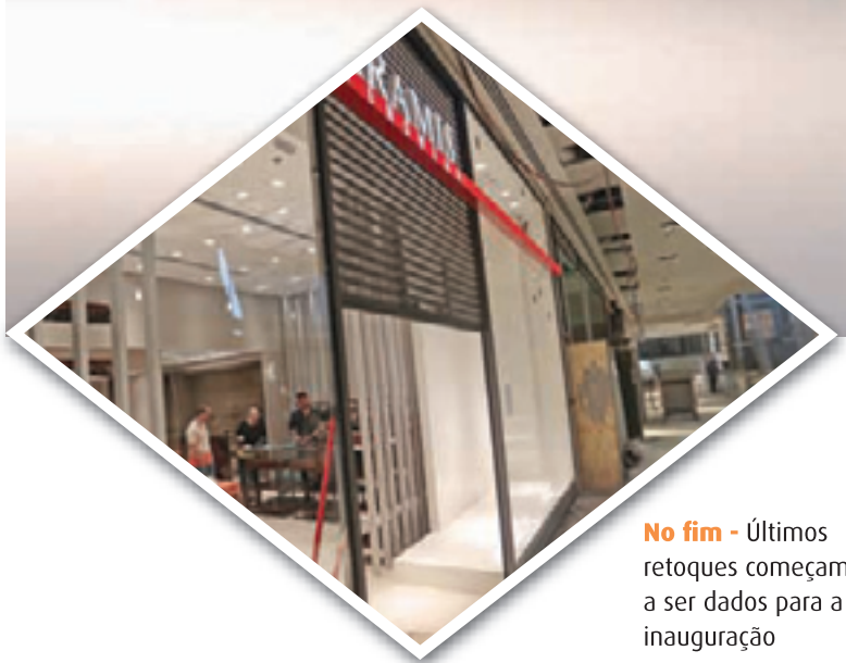
No fim - Últimos retoques começam a ser dados para a inauguração