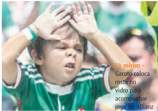
Fã mirim - Garoto coloca rosto no vidro para acompanhar jogo no Allianz

LOCAL - estádio Allianz Parque, em São Paulo (SP).