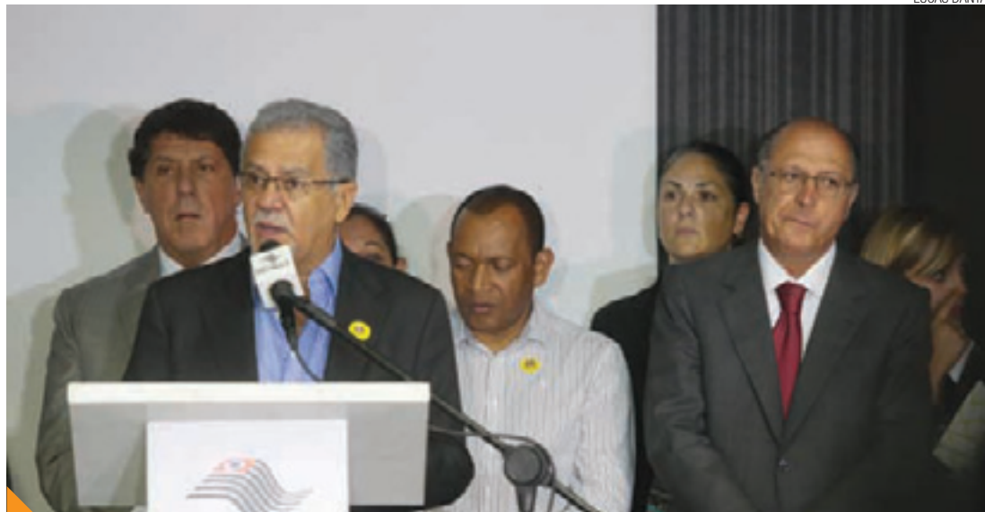
Ressarcimento - Almeida analisa ceder gestão de saneamento à Sabesp para quitar dívida

O governador Geraldo Alckmin chegou a dizer que a dívida de R$ 2,3 bilhões do Saae com a Sabesp por conta da compra de água poderia ter incentivado ao processo judicial contra a autonomia da cidade. O prefeito Sebastião Almeida chegou a dizer que poderia passar a gestão do esgoto ao Estado para quitar toda a dívida.