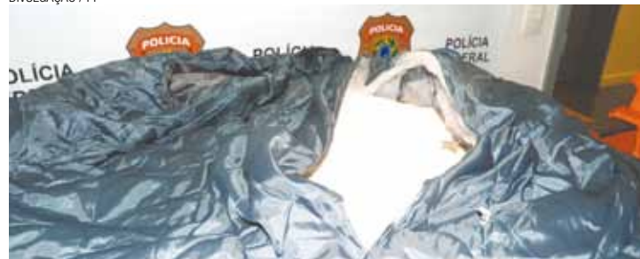
Flagrante - Homem da Costa do Marfim levaria droga até o Marrocos