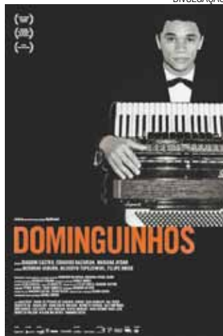
Dominginhos - Um músico escolhido e predestinado-

Agora o olhar é para ele que nos deixou, depois de lutar contra um câncer de pulmão por seis anos. A película é uma compilação de entrevistas dadas por ele próprio para equipe do longa, bem como para programas televisivos, especialmente à TV Cultura, que é coprodutora do filme. A cronologia de sua vida é narrada por ele, desde os tempos de Garanhuns, sua terra natal, com participações de grandes nomes da nossa música. Quero destacar a emoção de Nana Caymmi ao cantar “Contrato de Separação” em dueto com o artista. Luiz Gonzaga o conheceu com oito anos na porta de um hotel e, a partir dali, a história do menino mudaria para sempre. Uma narrativa rica em imagens e encontros vai ficar para quando a saudade bater, colocarmos no aparelho para lembrar esse, que foi, sem dúvida, a continuação da obra de Seu Luiz “Lua” Gonzaga. Veja o DVD e, se seus olhos se molharem, saiba que isso é saudade.