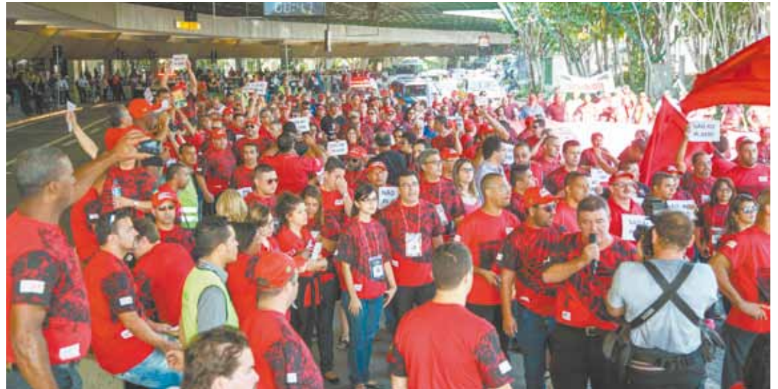
Manifestação - Mais de 300 pessoas fizeram uma passeata pelo aeroporto contra a lei da terceirização

O projeto que foi aprovado na Câmara dos Deputados com 324 votos a favor precisa ainda passar pelo Senado para depois ser encaminhado à Dilma.