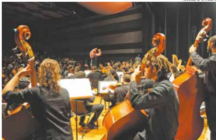
Música - Orquestra Jovem Municipal de Guarulhos se reúne neste sábado