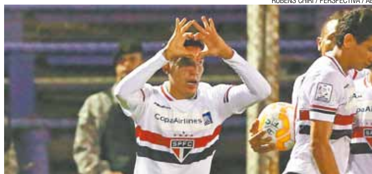
Sufoco e alívio - Centurión comemora gol marcado aos 46 do 2º tempo

Pelo Campeonato Paulista, o São Paulo volta a campo no domingo, às 18h30. A equipe tricolor vai até a Vila Belmiro para encarar o Santos, pela semifinal do campeonato.