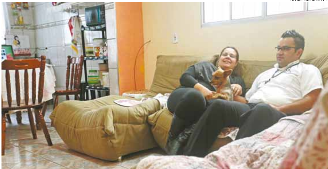
Vida nova - Evangelista celebra a mudança com a consciência da necessidade de empenho para novas conquistas

Os planos são muitos. O principal é sair do imóvel que alugaram na Região Taboão e conquistar a casa própria. "Vejo com clareza que tive uma nova oportunidade de vida. Conquistei bom emprego, tenho casa e uma esposa com que vou construir mais."