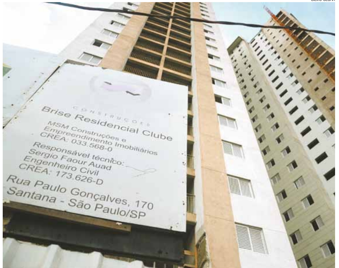
Frustração - Realidade da casa própria fica cada vez mais distante de compradores dos apartamentos da MSM

Apartamentos estão incompletos e abandonados pela construtora