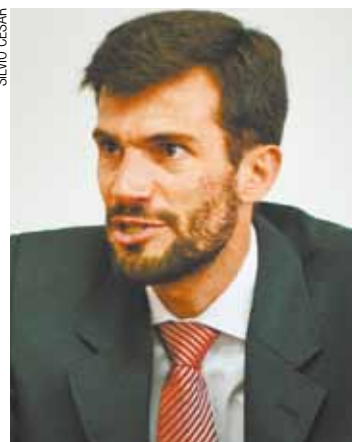
Pessimismo - Juiz afirma que remediação é “enxugar gelo”

tadual de Segurança Pública, a apreensão de menores aumentou 31% em Guarulhos, quando comparamos os 430 casos de 2014 com os 326 do ano anterior.