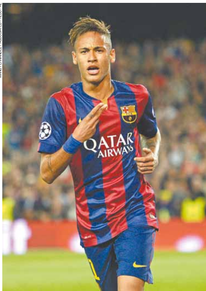
Show de bola - Neymar corre na comemoração do seu primeiro gol

PSG não foi um adversário à altura do Barcelona