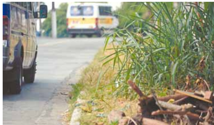
Descaso - Além de mato sem cortar há trecho com entulho e sujeira