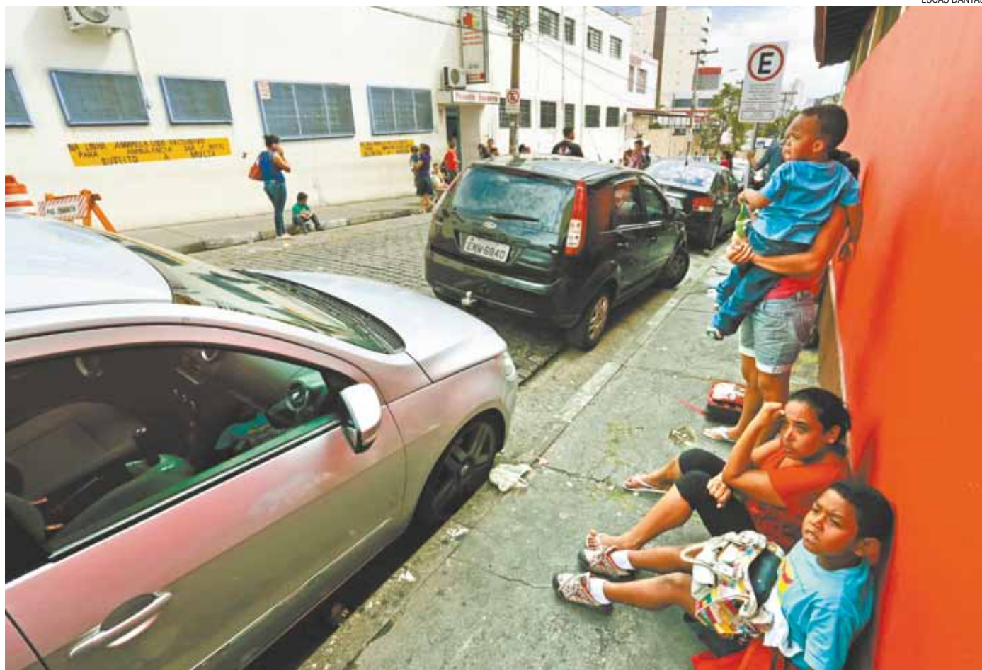
Desumano - Acúmulo de pacientes à espera de atendimento faz com que pais e filhos aguardem socorro nas calçadas vizinhas ao hospital

Alvo era único, mas oito corintianos morreram em chacina na Pavilhão 9