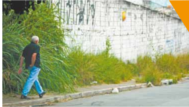
Negligência - Mato alto dificulta trânsito de pedestres na calçada