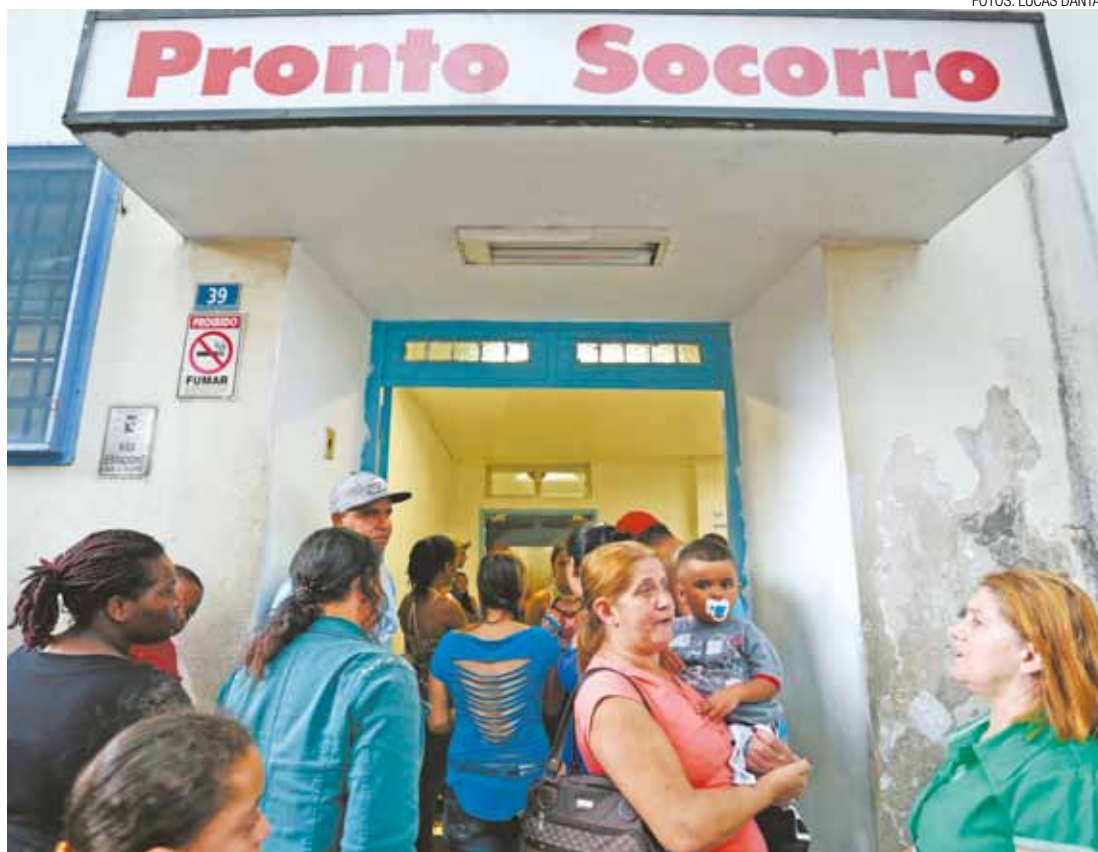
Lotado - Mães com crianças de colo buscam atendimento na porta do PS do Hospital Municipal da Criança