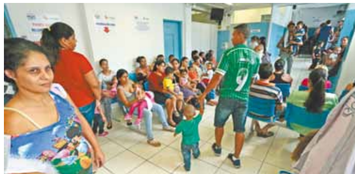
Paciência - Fila de espera dentro do hospital é maior do que na porta