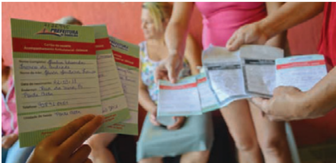
Altos índices - A Região 3, São João/Bonsucesso, segue com maior número de casos, somando 2.471