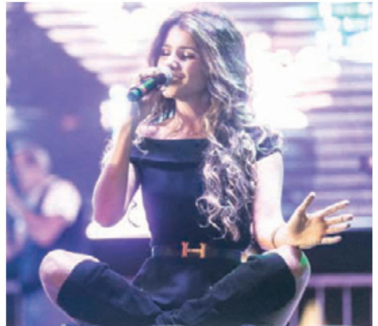
Dose dupla - Paula Fernandes fará show em Guarulhos e São Paulo