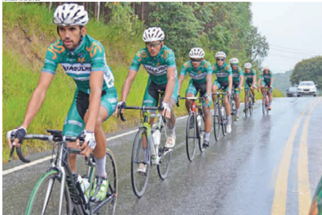
Força Máxima - Todos os integrantes da ADF/Guarulhos participarão da prova que vale 80 pontos no ranking