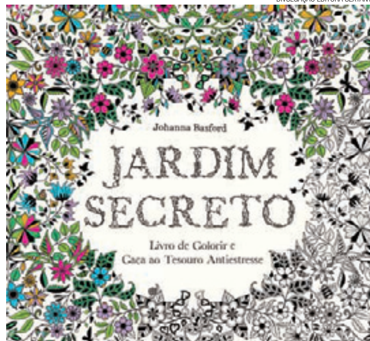
Antiestresse - 'Jardim Secreto' é um dos títulos mais procurados

O especialista argumenta que com as tensões do cotidiano, que envolvem trabalho, trânsito, relações, é comum que as pessoas fiquem estressadas. Segundo ele, entre as formas de enfrentar tensões estão as atividades lúdicas. "Com elas se tira o foco do que motiva a tensão ou o estresse", explicou.