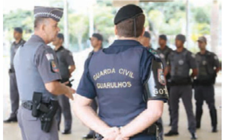
Prevenção - Ação foi realizada ontem à tarde no Centro e Vila Galvão