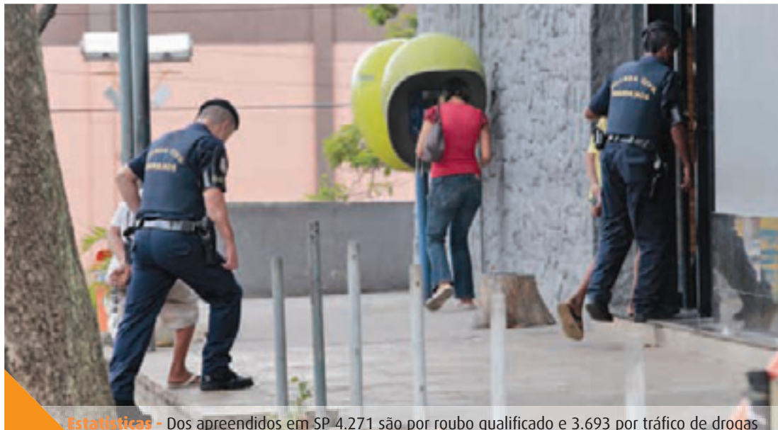
Estatísticas - Dos apreendidos em SP 4.271 são por roubo qualificado e 3.693 por tráfico de drogas