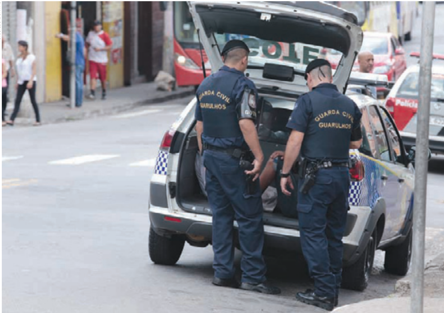
Cotidiano - GCMs apreendem menores infratores por roubo no Centro de Guarulhos e os conduzem ao 1º DP, que fica na mesma Região