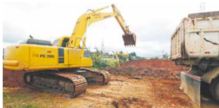
Contratada - Enpavi é a nova empreiteira contratada para finalizar Trevo