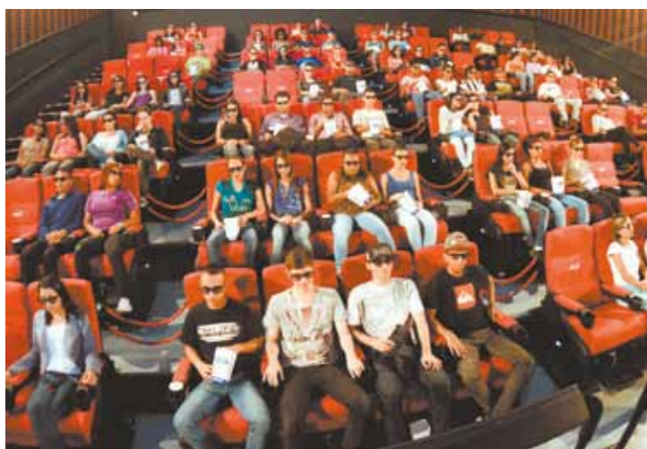
Modernidade - Salas do Cinépolis em Guarulhos têm tecnologia inovadora