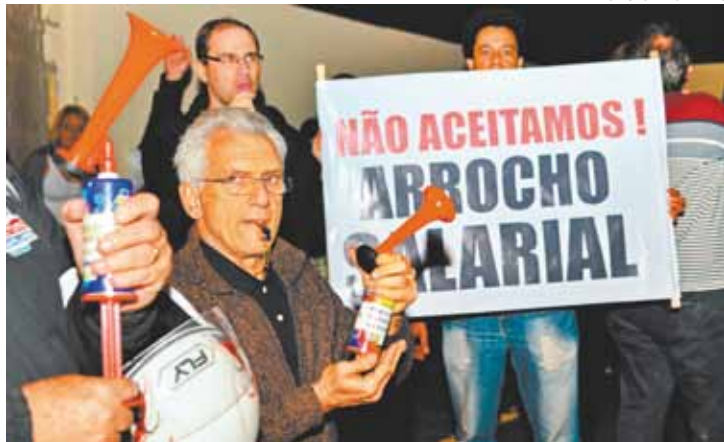
Manifestação - Com cartazes, buzinas e apitos, servidores protestaram

De acordo com representantes das associações, haveria uma reunião entre o Sindicato dos Trabalhadores da Administração Pública (Stap) na CPN para tratar do reajuste, mas até o fechamento desta edição não havia nenhuma