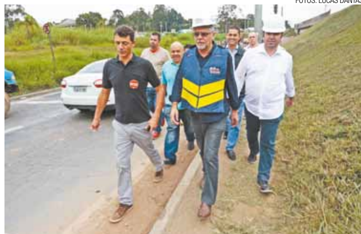
Vistoria - Almeida confirma Trevo como maior obra do segundo mandato

Toda a obra deve ficar pronta em agosto de 2016, e inclui a duplicação da Avenida Juscelino Kubistchek até o Terminal Pimentas e a duplicação da Papa João Paulo 2º, além da canalização do córrego Água Chata.