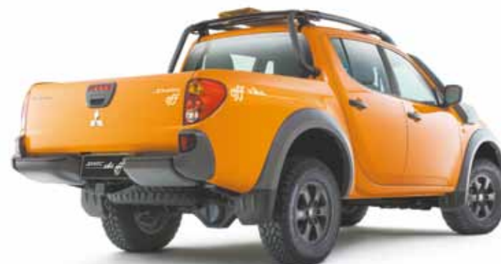
Motor - Diesel de 3.2 L DID-H, 16 válvulas, DOHC com 180 cv a 3.500 rpm

Agressiva por fora e confortável por dentro, a picape transporta até cinco passageiros