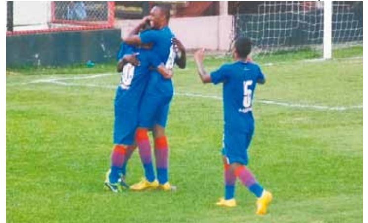
Força - Time goleou Mauaense no último jogo e vai para cima do Ecus