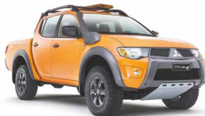
Aventura - L200 Triton Savana Off traz cor exclusiva Orange Sunshine

Tel.: 4966-2222 - ID: 55*117*27705/55*117*27703