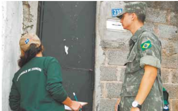
Guerra - Prefeitura convoca Exército para combater dengue na cidade

Até a terça-feira, 5, o hospital havia atendido uma média de 250 pessoas com suspeita. Em abril, a média diária era de 350 pessoas por dia.