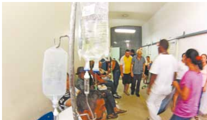
Lotação - Mais de 300 pessoas passam diariamente pelo hospital HMU