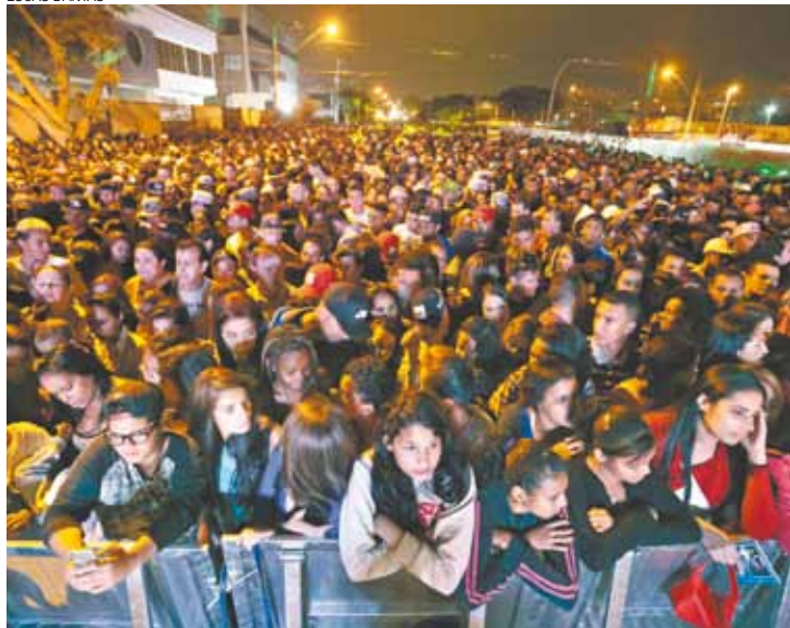
Festa - Mais de 50 mil pessoas compareceram ao 'Show do Trabalhador'