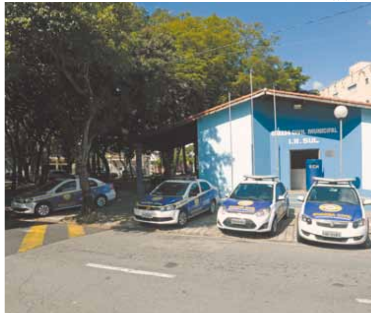
Fachada - Em frente à inspetoria havia ontem quatro carros e duas motos