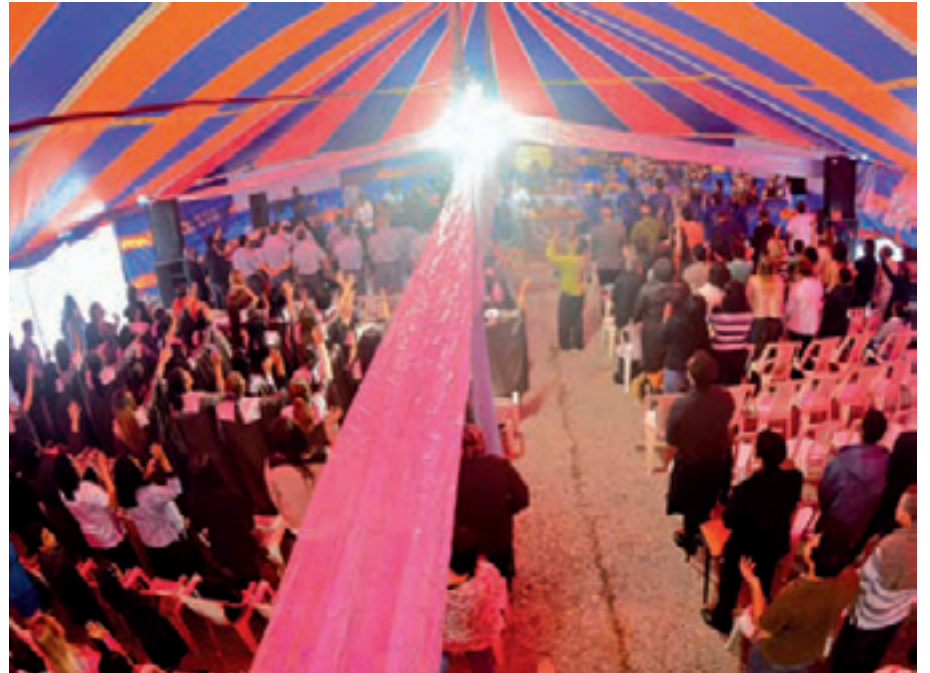
União - Palavras da missionária e ação social reuniram mais de 600 pessoas na comemoração