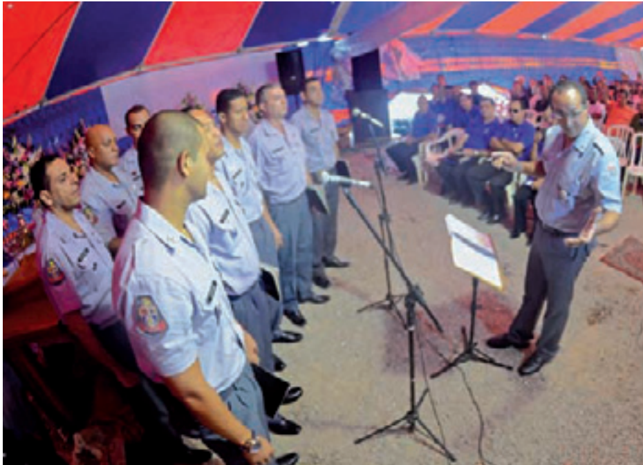
Coral - Corpo Musical da Polícia Militar, "PMs de Cristo" cantaram diversos hinos de louvor