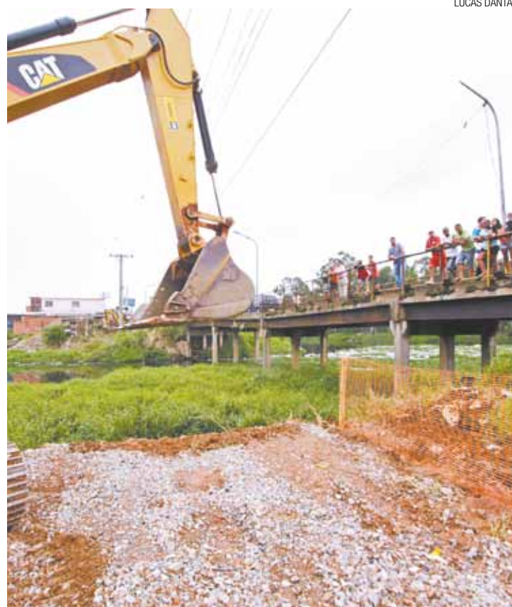
Precariedade - Ponte antiga não tinha passarela para pedestres

A antiga ponte já foi demolida e uma passarela foi erguida para pedestres. A nova passagem terá mão dupla e deverá aumentar a mobilidade da via em até 50%.