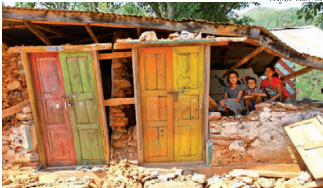
Cataclismo - Tremor de terra do dia 25 de abril matou mais de 7 mil pessoas e causou destruição inimaginável