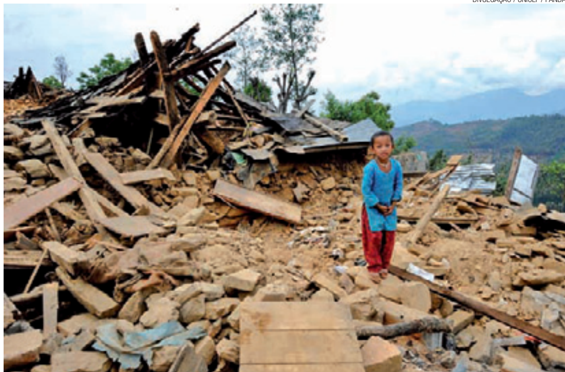
Tragédia - Terremoto derrubou cerca de 130 mil casas e deixou mais de três milhões de pessoas sem comida

Além disso, por um mês, todos os produtos desta origem, que são vendidos pelo e-commerce terão 5% do valor revertido para as instituições que estão auxiliando as pessoas atingidas pelo terremoto; a cópia do depósito da doação será enviada como comprovante para todos os clientes que adquiriram os tapetes.