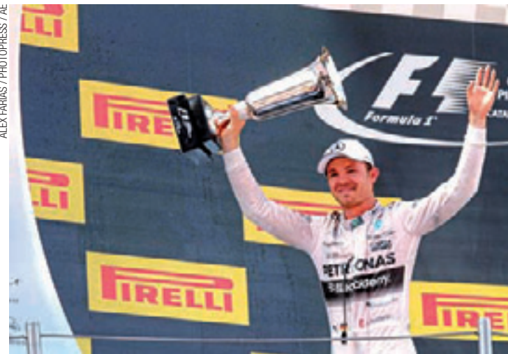
Brilhoso - Nico Rosberg saúda o público no pódio do GP da Espanha

A CORRIDA - Pole position nas quatro primeiras corridas da temporada, Hamilton saiu em segundo em Barcelona e, já na largada, perdeu o posto para Vettel, que largou em terceiro. Durante boa parte da corrida, lu-