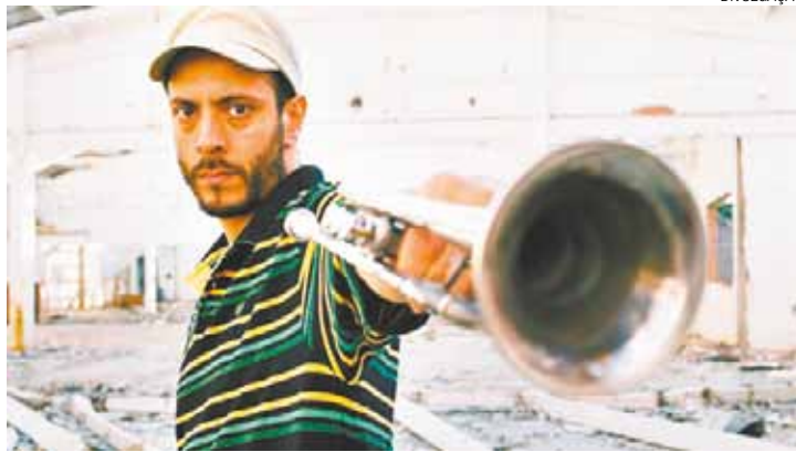
Itaú Cultural - Trompetista apresenta seu novo show nesta sexta