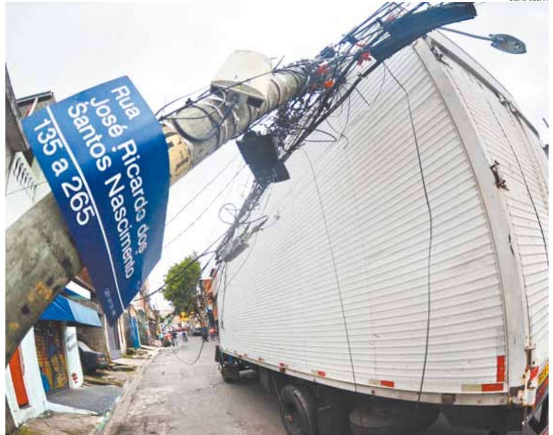
Queda - Baú do caminhão enroscou nos fios do poste de madeira que desabou e deixou a via sem luz ontem

Procurada, a distribuidora de energia não se pronunciou sobre a manutenção do local e não passou a atualização de quantos postes de madeira ainda há na cidade.