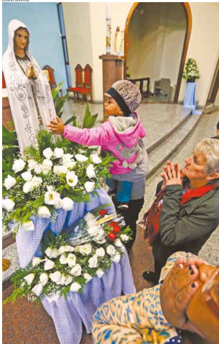
Fé - Religiosos lotaram igreja que fica no bairro de mesmo nome da Santa