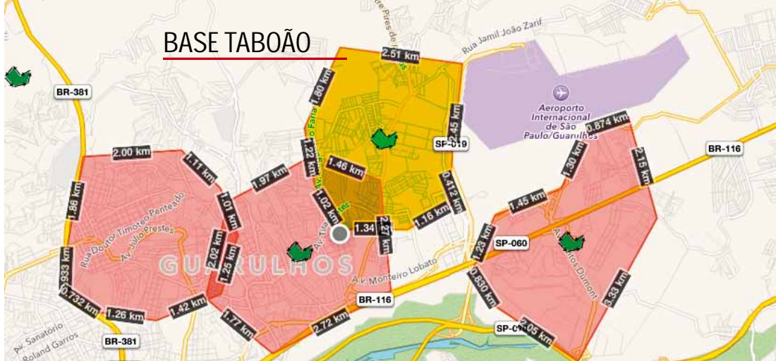
Atuação - Área destacada em amarelo (acima) corresponde à região da base dos Bombeiros desativada no Taboão