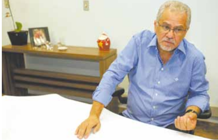
Gestão - Almeida tem enfrentado dificuldades para pagar fornecedores

Este ano, o “Pibinho” deve ficar em 1,5%. A estimativa de melhora do crescimento da cidade só ocorre em 2017, com uma elevação de 2,15% e em 2018, com meta de 2,34%.