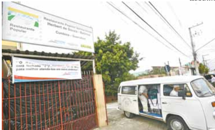
Fechado - Portões trancados; Kombi deixa o local carregada de materiais

O cartaz fixado no portão, informando sobre o fechamento, não impediu que anti-