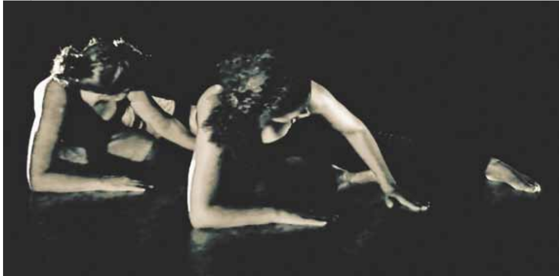
Dança - Espetáculo foi concebido a partir do ensaio "Notas Sobre a Experiência e o Saber da Experiência"