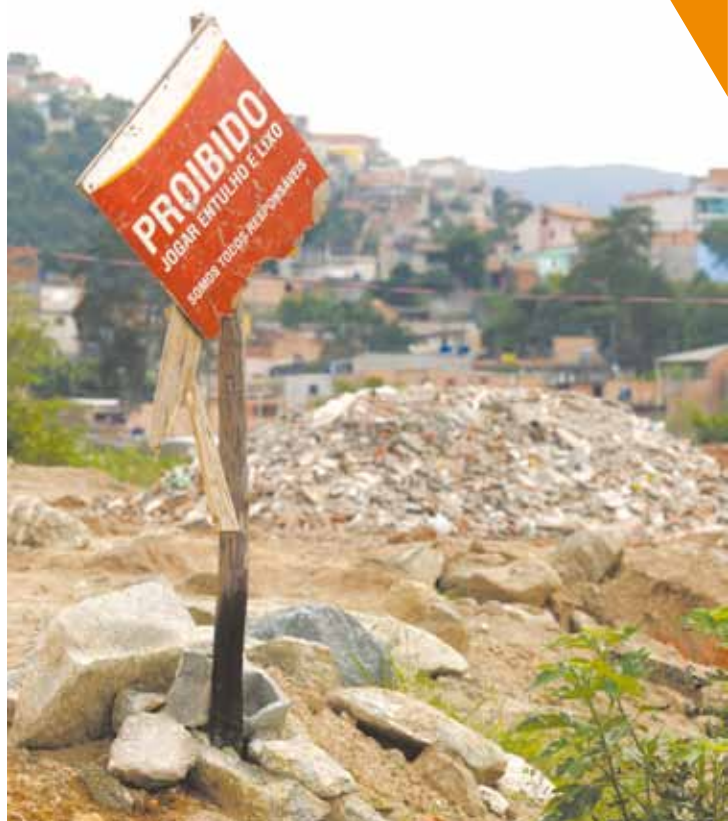
Desrespeito - Placa de "proibido" não inibe agressão ao meio ambiente

Entulho é despejado em área de manancial no Paraíso Pág. 8