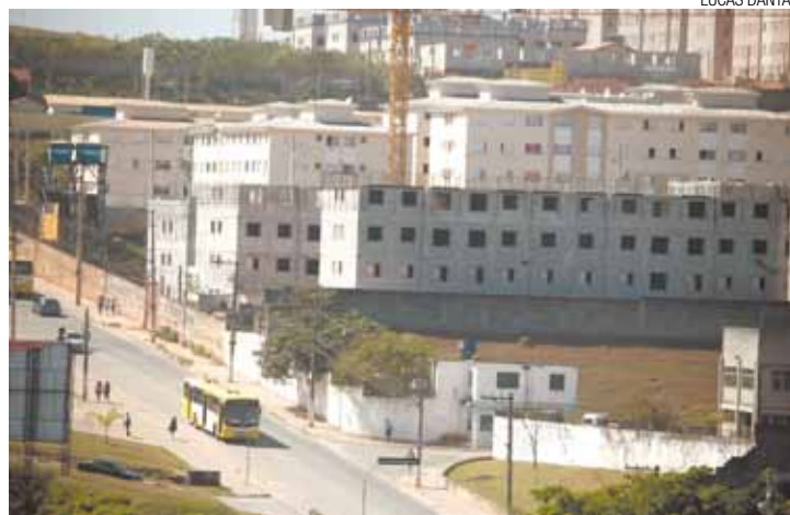
Pimentas - Habitações serão entregues para famílias de baixa renda

Mais de 1,3 mil residências já foram entregues