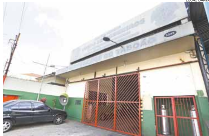
Precária - Local é "insalubre" para o trabalho da corporação, disse coronel

SSP determinou que posto continue aberto