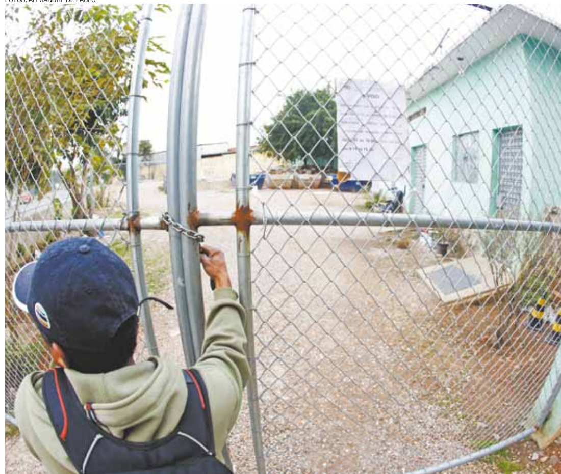
Fim do expediente - Funcionário fecha o Ponto de Entrega Voluntária (PEV) do Macedo, às 16h de ontem