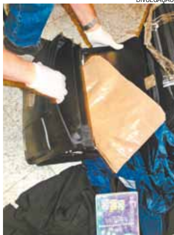
Flagrante - Droga apreendida seria levada para a Alemanha

Ele já havia tentado embarcar no dia anterior, mas foi impedido por ter se apresentado muito alcoolizado na fila do check-in . O passageiro foi entrevistado e conduzido para passar por busca pessoal e revista de suas bagagens. Dentro da valise e de sua mala foram encontrados 5 pacotes ocultos em fundos falsos que, após a realização dos exames periciais revelaram conter mais de dois qui-