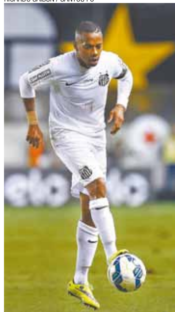
Robinho - Craque santista desfilou sua classe em Pernambuco