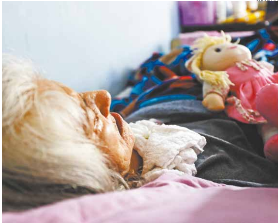
Estática - Idosa fica o dia inteiro na cama e precisa do acompanhamento de enfermeira e fisioterapeuta

A Justiça informou que para garantir o cumprimento da decisão por parte da Prefeitura precisa ser “provocado” (informado) para poder tomar uma nova decisão ou medida.