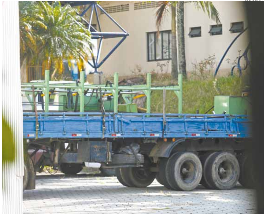
Mudança - Dois caminhões foram à empresa, na tarde de ontem, para transportar o maquinário

Segundo funcionários da metalúrgica, 500 trabalhadores da unidade que funciona na Vila Miriam (Região Centro) e 300 da Região Cumbica foram demitidos "de surpresa".