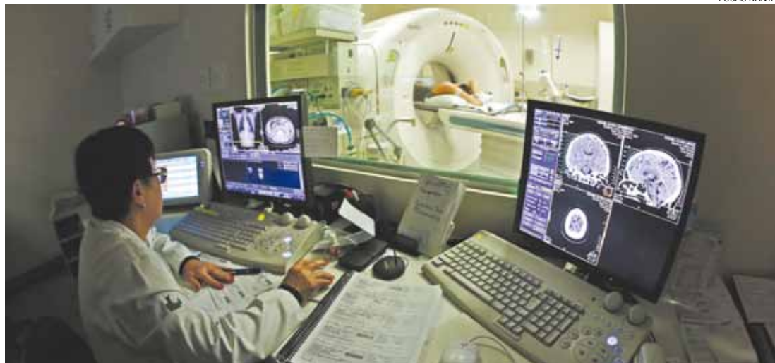
Tomografia - Uma das especialidades que irá aumentar a quantidade de procedimentos realizados

Durante a Operação Verão são elaborados os Planos Preventivos de Defesa Civil (PPDCs) para prevenir os cidadãos de situações de risco causadas pelas chuvas.