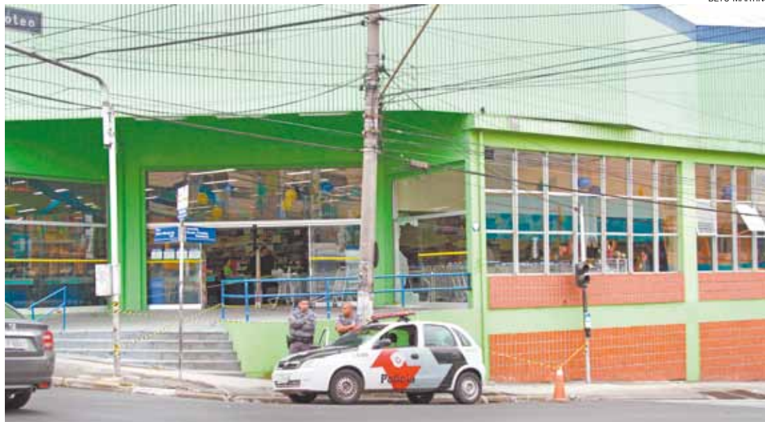
Dúvida - Policial atirou aparentemente sem motivo contra vítimas; PM alega que ele teve um "surto"