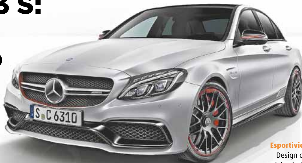
Esportividade - Design confere ao modelo ainda mais dinamismo na condução

RECT, se destaca pela disponibilidade de força, a construção intencionalmente leve e sua alta eficiência e compatibilidade ambiental. Ele também atende às mais altas expectativas relativamente ao conforto sonoro e vibrações.