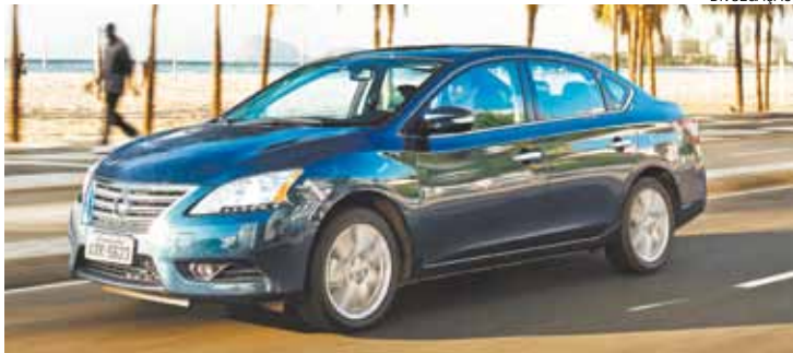
Nissan Sentra - Foi eleito o sedã médio mais seguro contra furtos