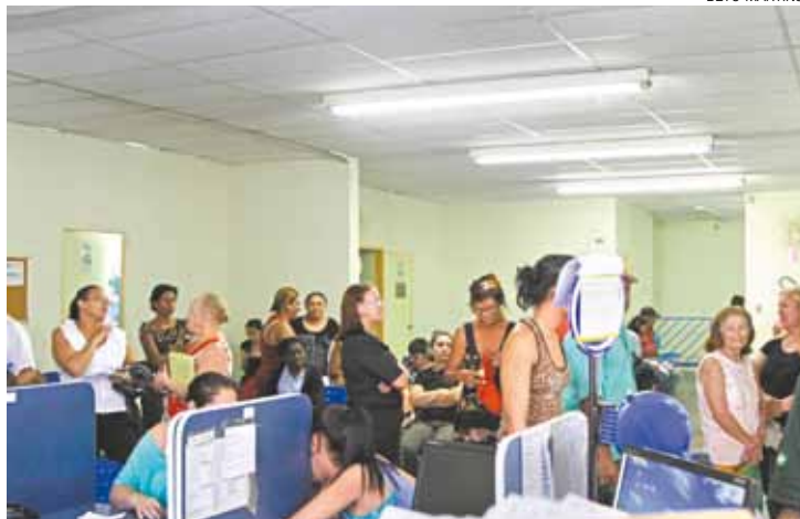
Gravação - Tumulto teve início porque paciente filmava “superlotação”