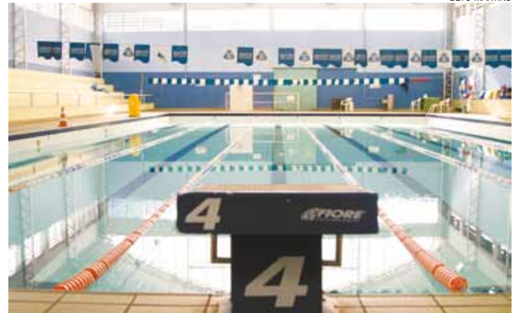
Vazio - Espaço no João do Pulo está fechado desde o dia 20 de maio