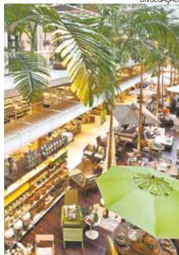
Conforto - Loja oferece itens para decorar e mobiliar qualquer casa