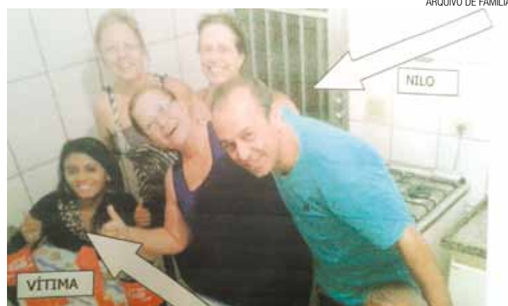
Frieza - Homem teria afirmado à polícia que premeditou o crime

Suspeito ainda é indiciado por outro crime violento