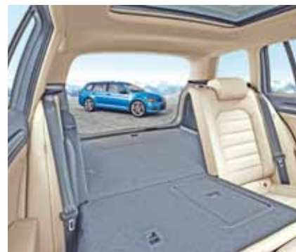
Interior - O amplo console central remete a veículos de classes superiores. Destaca-se o porta-malas de 605 litros