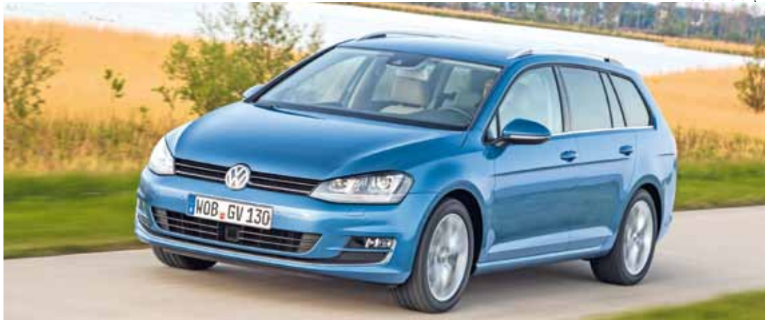
Segurança e esportividade - O Golf Variant combina toda a versatilidade espaço e conforto para a família

Com 307 mm a mais no comprimento em relação ao hatchback, o Golf Variant mede 4.562 mm.