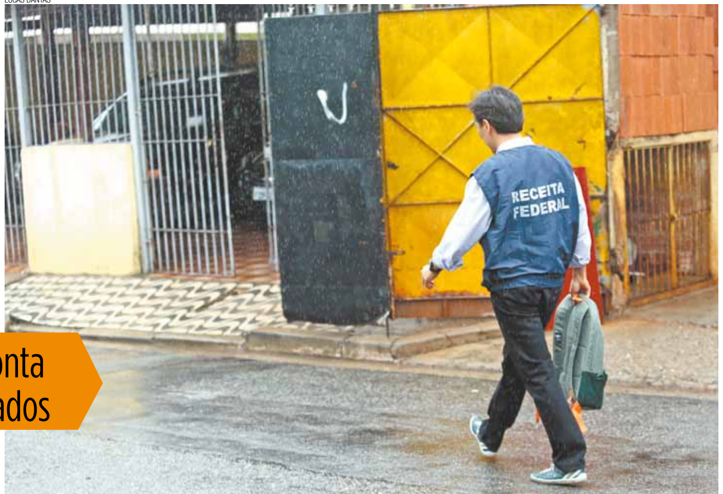
Fraude - Fiscais da Receita Federal fizeram diligências e constataram endereços ‘fantasmas’ de empresas em dois bairros da cidade