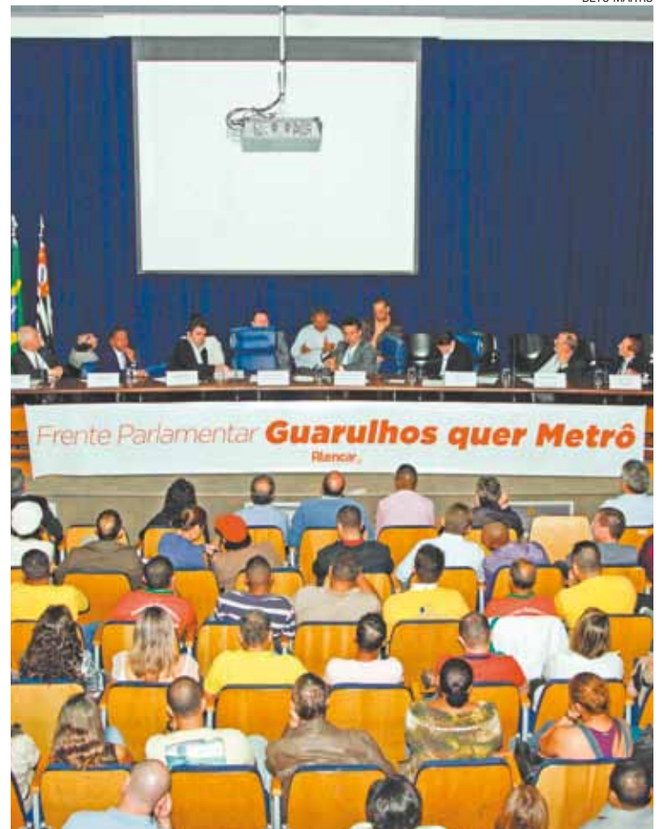
Transporte - Evento aconteceu ontem na Assembleia Legislativa de SP

Grupo pretende acompanhar as obras do metrô