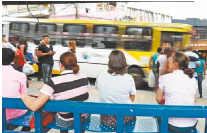
Transporte - Categoria quer reajuste salarial maior do que 8% proposto

Inicialmente, o sindicalista exigia a reposição da infla-