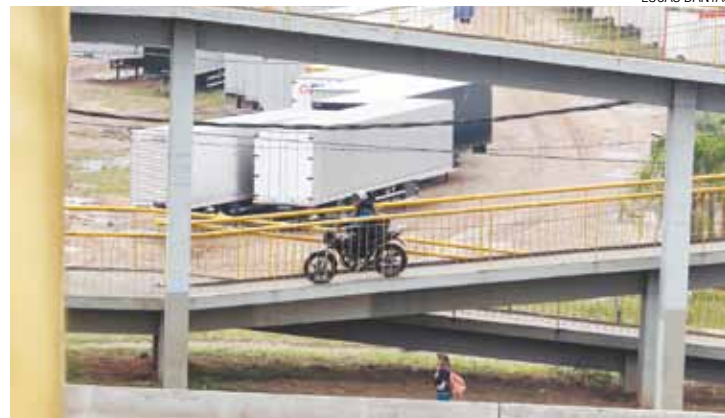
Flagrante - Motoqueiro corta caminho irregularmente com sua motocicleta

Av. Dr. Timoteo Penteado, 3958 – Vila Galvão - Guarulhos/SP