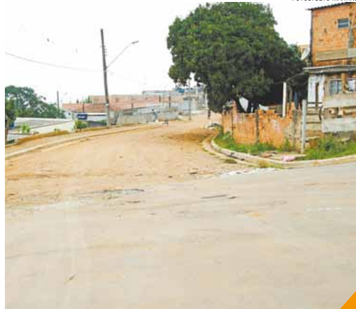
Quase lá - Limite entre terra e asfalto causa ira nos moradores