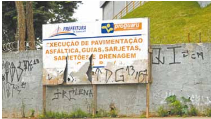
Promessa - Outdoor degradado indica execução de obras no bairro

A Rua Conceição de Pedra faz jus ao nome. A partir do número 437 as pedras colocadas em 2014 colaram na terra, outras estão soltas e viraram obstáculos para pedestres e veículos. "Passaram uma má-